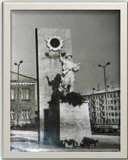
Фото 2: Из семейного архива Горохова В.Г.