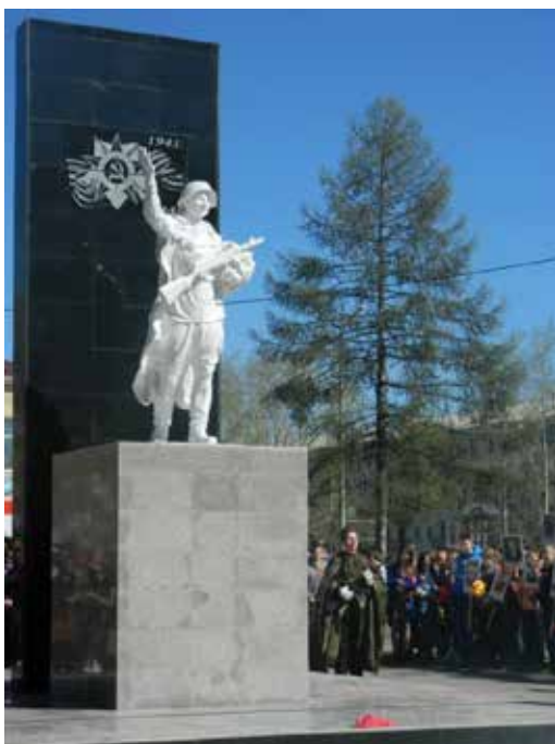
Фото 4: Открытие памятника после реставрации.