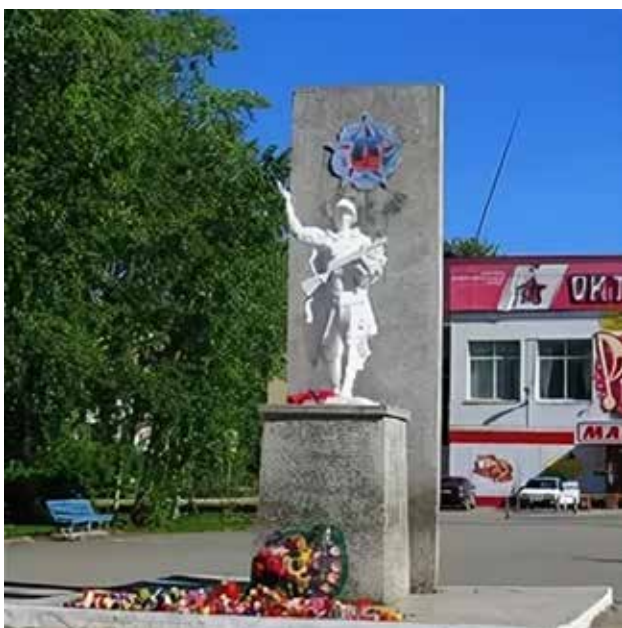
Фото 1: Put - Nik