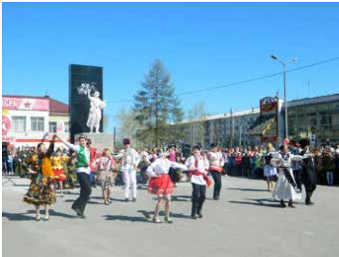
Фото 6: