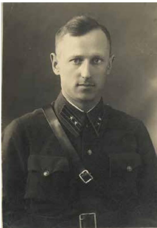
Фото 8: Из семейного архива Горохова В.Г.