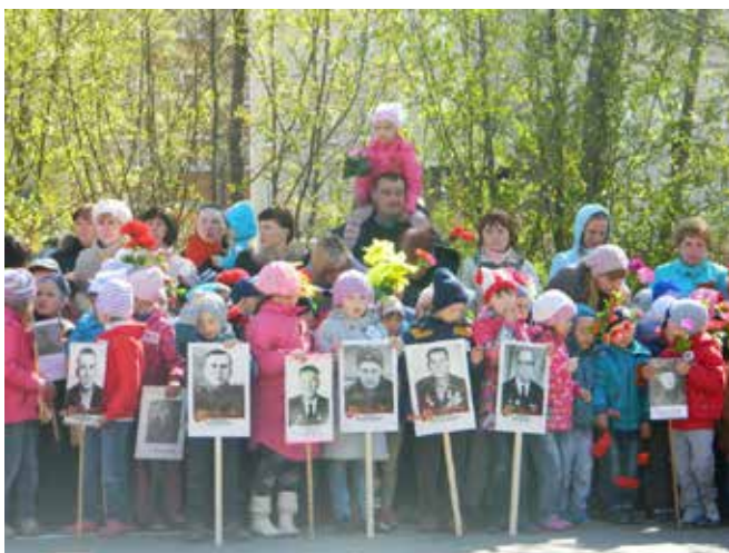
Фото 5: Открытие памятника после реставрации.