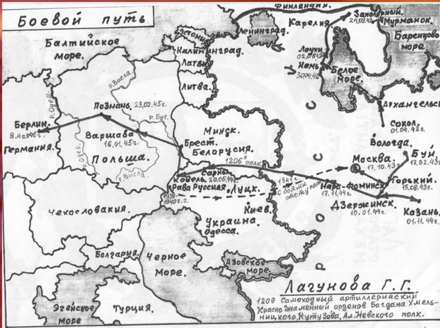
Карта нарисована собственноручно Лагуновым Г. Г.