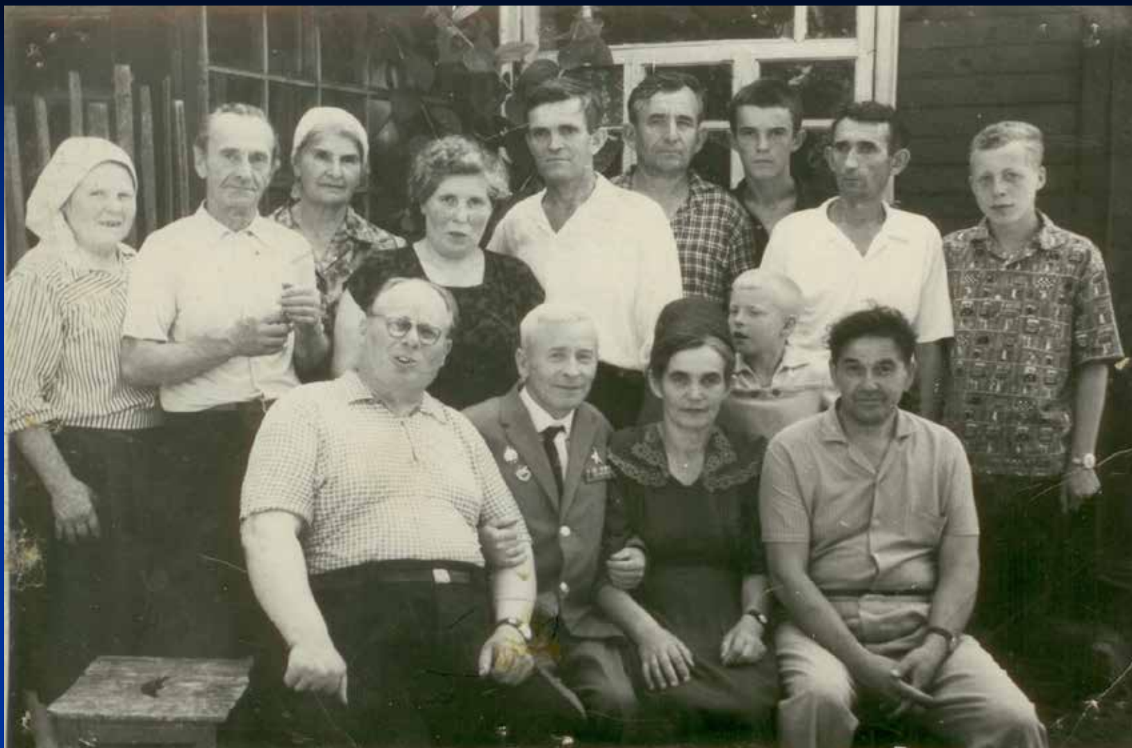
В гостях у партизан Брянска в г. Дятьково. 1966 г.