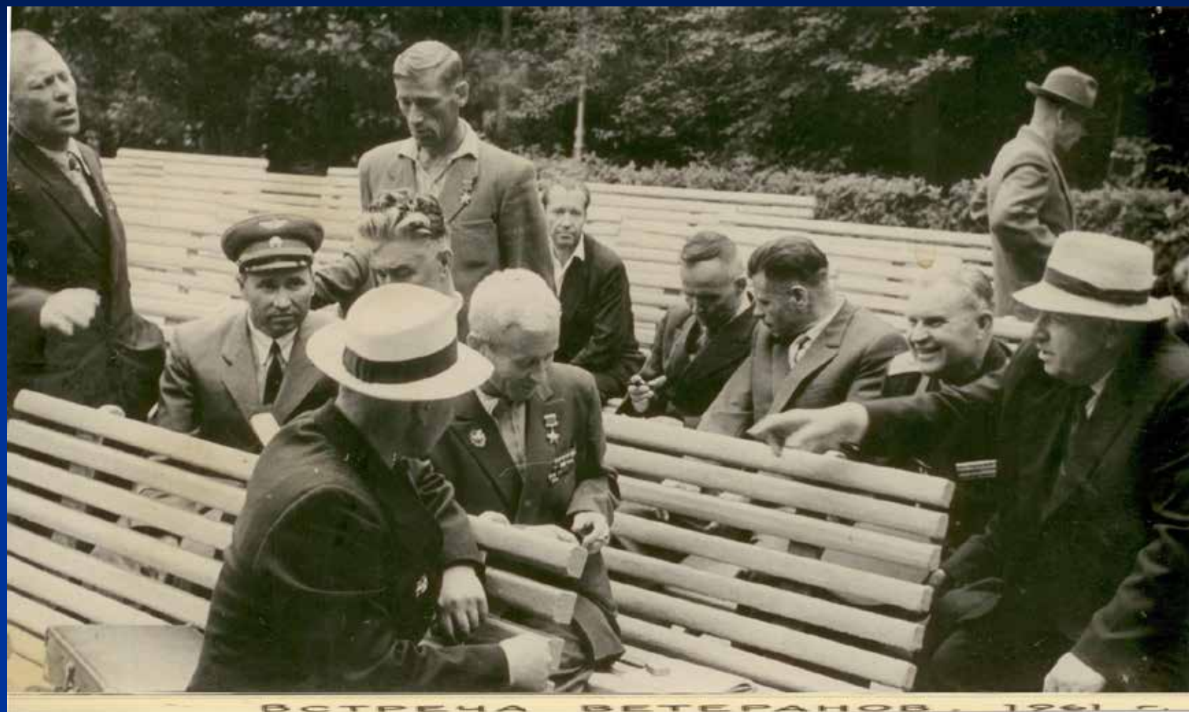
Встреча ветеранов. Москва. 1961г.