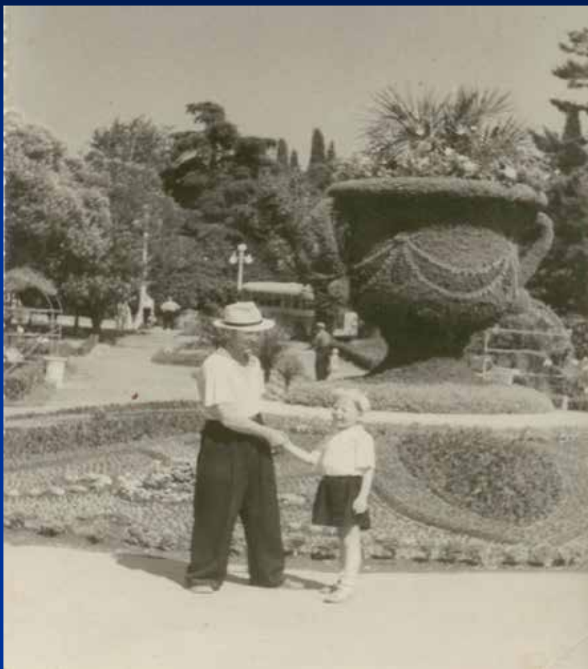
На отдыхе с сыном