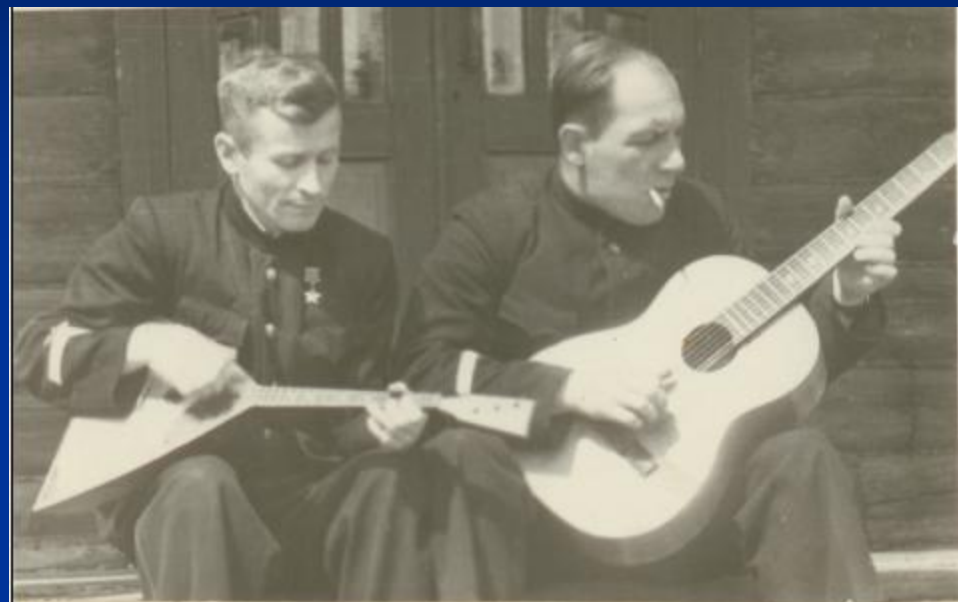
В ЧАСЫ ДОСУГА