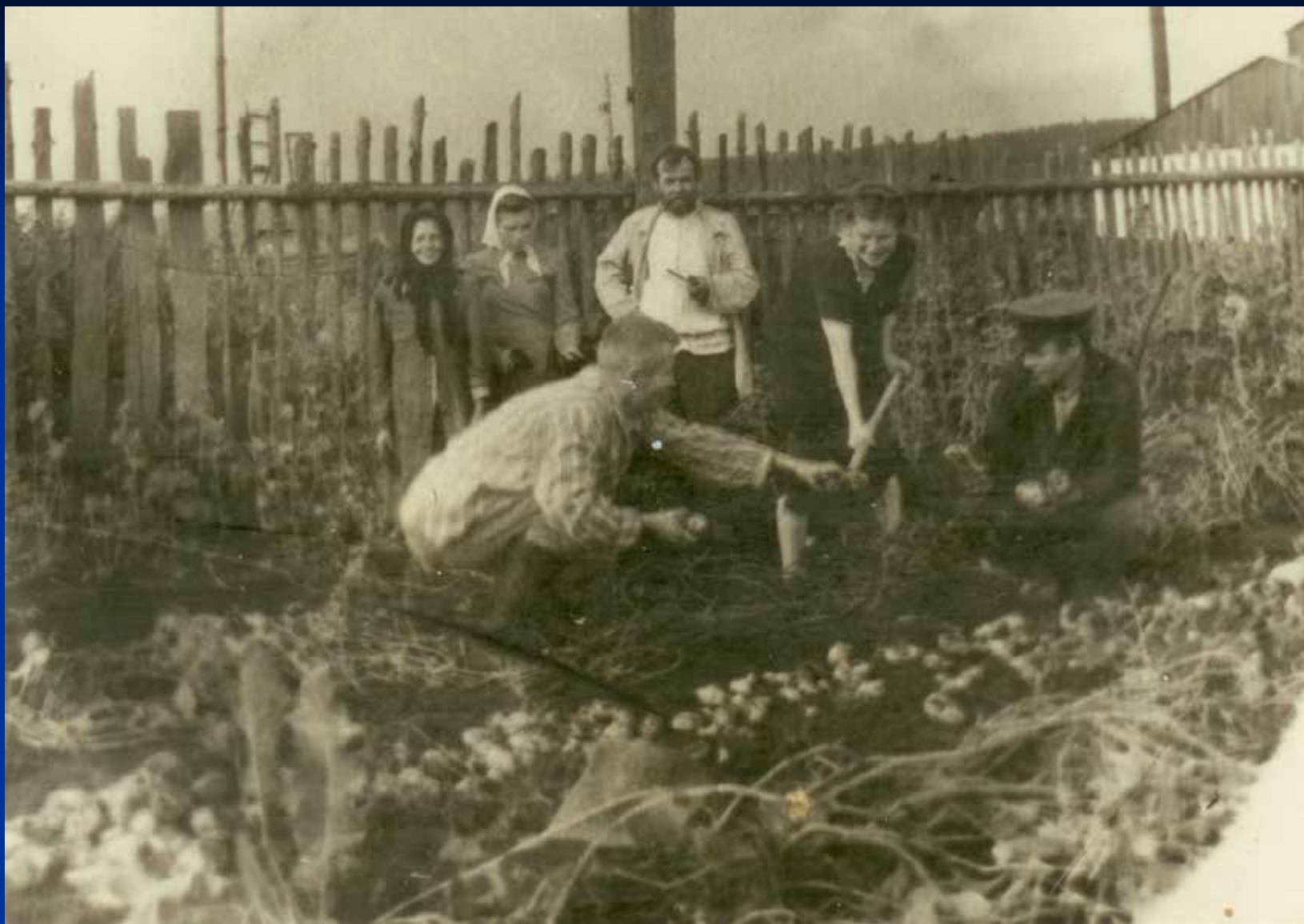
На родительском огороде