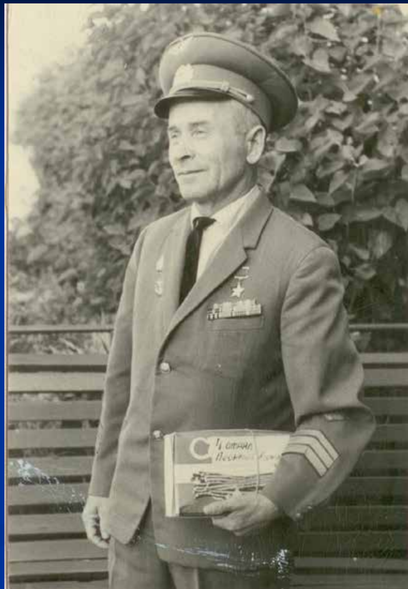
Фото 1967 г. Москва.