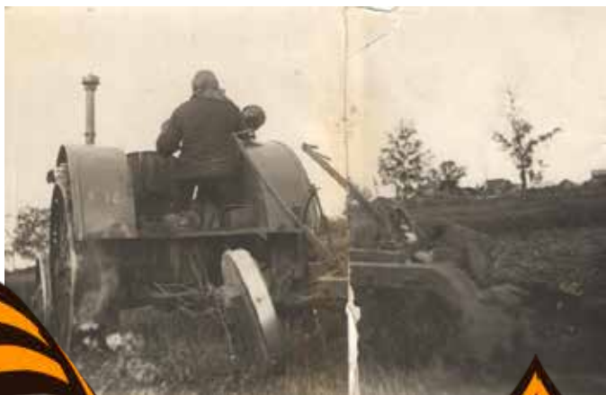
Один из первых тракторов 1937 год.

- Будем строиться, народ весь перетянем, - убеждено говорил он крестьянам.