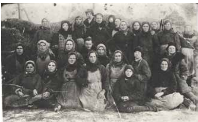
1931 год. Бригада колхоза им. Будённого