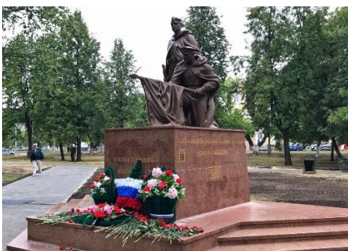
Памятник героям-победителям в Великой Отечественной войне, 24 июня 2020