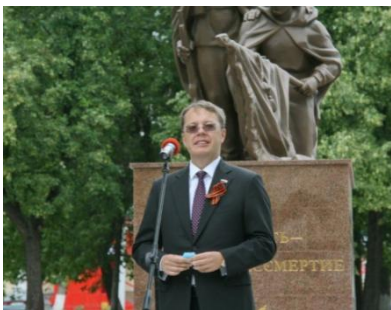
Депутат Государственной Думы РФ Лев Ковпак, 24 июня 2020

Это был цветущий майский день. Собралось много каменцев и гостей города. В торжественной церемонии приняли участие глава города Алексей