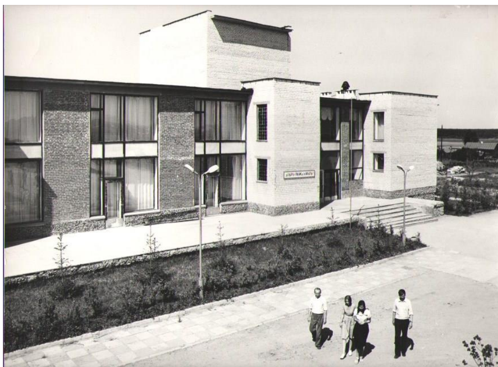
Баранниковский Дом культуры. 1980 г.

В 1980 году в деревне открылся Дом культуры, даже по архитектуре отличающийся от типовых сельских ДК.