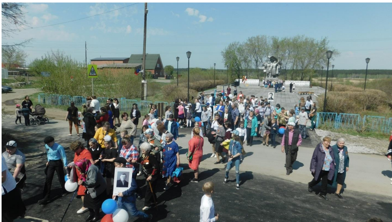
9 мая 2019 г.

Память о погибших земляках и тружениках тыла бережно хранят их потомки, живущие сейчас в Баранниковой.