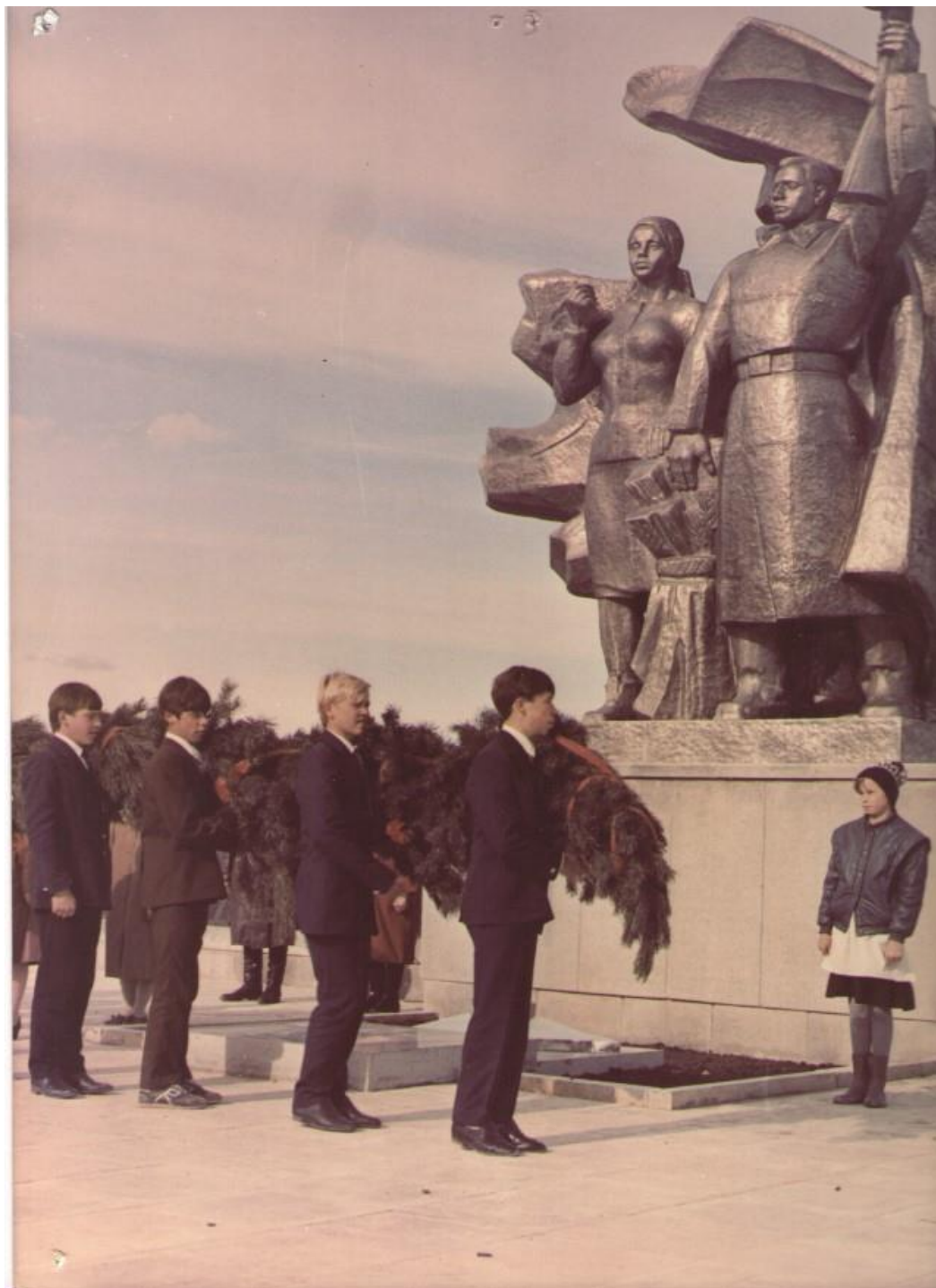
Мемориал Славы. Д. Баранникова, 2019 г.