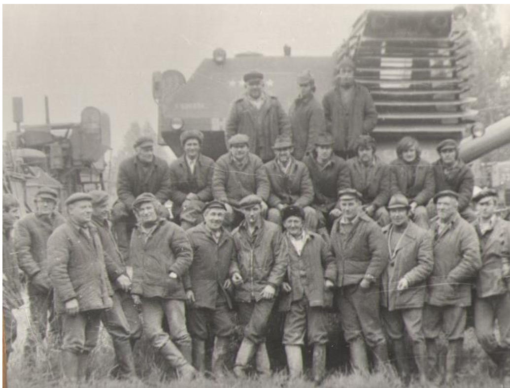
Механизаторы совхоза «Камышловский». Конец 80-х г. г.