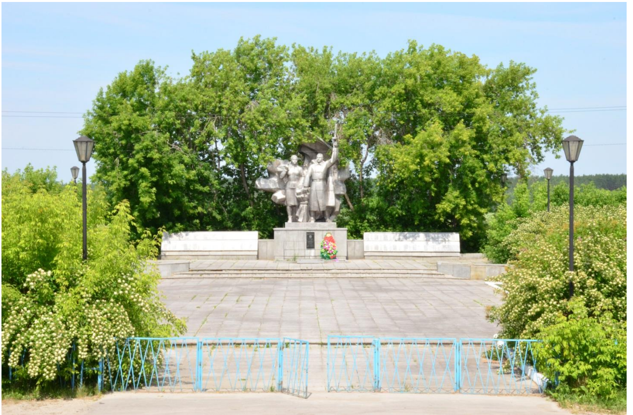
Мемориал Славы. Д. Баранникова, 2020 г.

Защищать Родину ушли 598 жителей Зареченского сельского совета, 441 не вернулся в родной дом. 10 мемориальных плит с именами погибших и бронзовый венок вечного огня были отлиты на одном из заводов Нижнего Тагила.