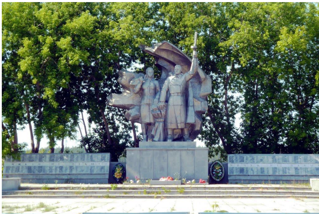
Мемориал Славы. Д. Баранникова, 2019 г.

Как все, пережившие Великую Отечественную войну, Герман Макарович трепетно относился к памяти погибших, восхищался силой воли ветеранов и тружеников тыла. У него возникает идея – создать Мемориал памяти в честь единства фронта и тыла.