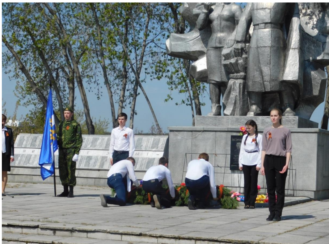
Мемориал Славы. Д. Баранникова, 2019 г.

Защищать Родину ушли 598 жителей Зареченского сельского совета, 441 не вернулся в родной дом. 10 мемориальных плит с именами погибших и бронзовый венок вечного огня были отлиты на одном из заводов Нижнего Тагила.