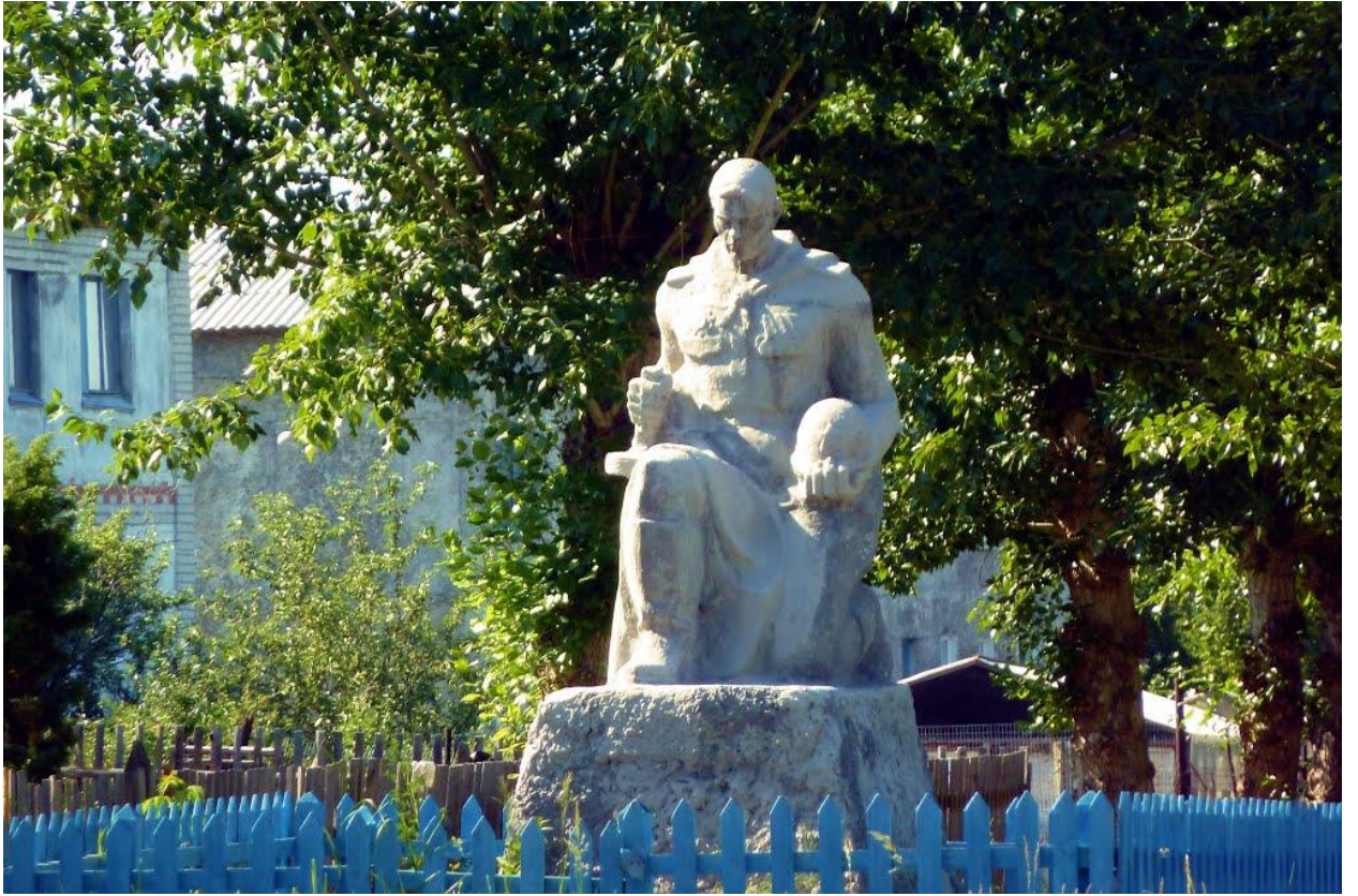
Памятник погибшим землякам. Д. Баранникова, 2019 г.

В лихие 90-е на мемориал покушались вандалы, сбивали литые буквы, выломали звезду вечного огня, чтобы сдать в металлолом.