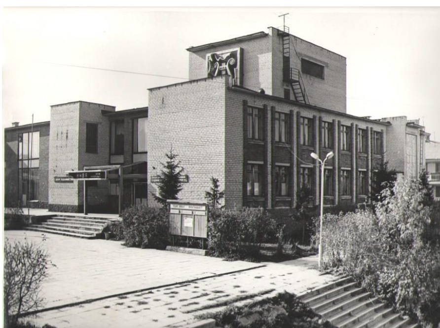
Баранниковский Дом культуры. 1987 г.