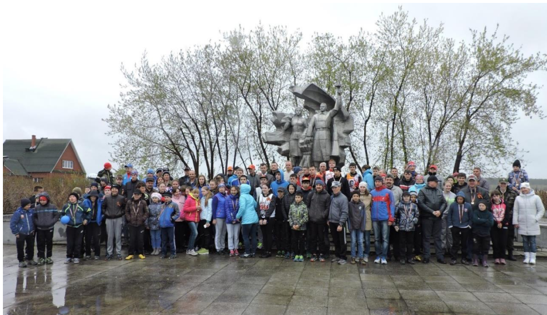
2015г.