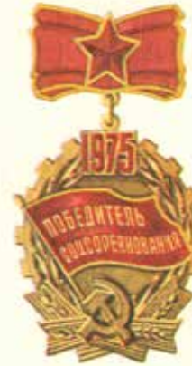
Знак учрежден Центральным Комитетом КПСС, Советом Министров СССР, ВЦСПС и ЦК ВЛКСМ