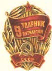
Знак учрежден Центральным Комитетом КПСС, Советом Министров СССР, ВЦСПС и ЦК ВЛКСМ

Ю. Бещев (подпись) Н. Ковалев (подпись) В. Бещев (подпись) Н. Ковалев (подпись)