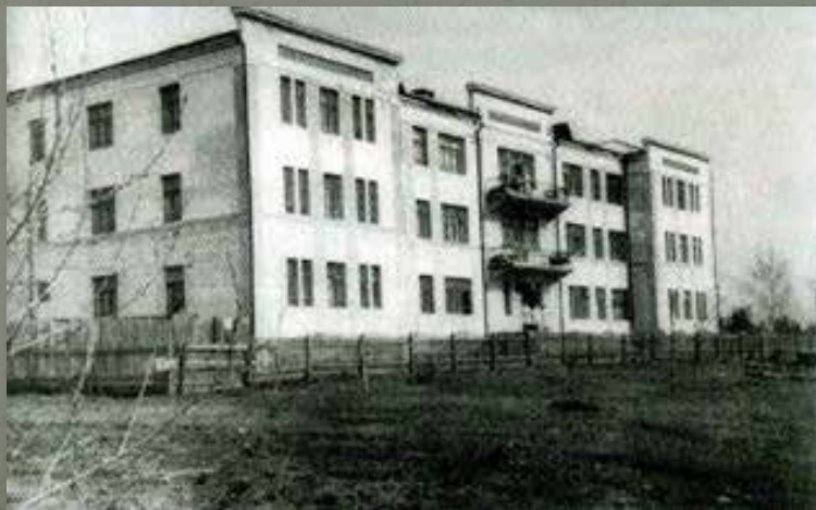
Здание треста «Богословскуголь» , переданное под помещение эвакогоспиталя