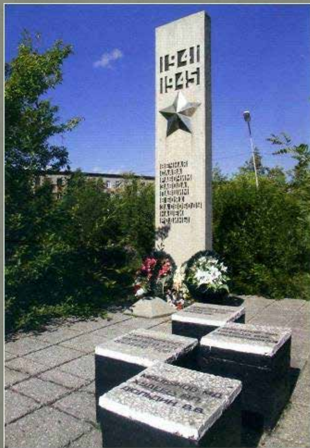
Обелиск к 30-летию Победы у здания управления Завода горного машиностроения по ул Карпинского