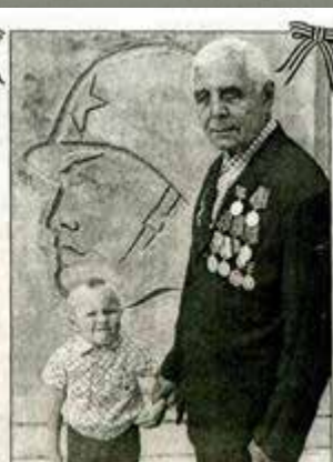
Кытымский ветеран войны.