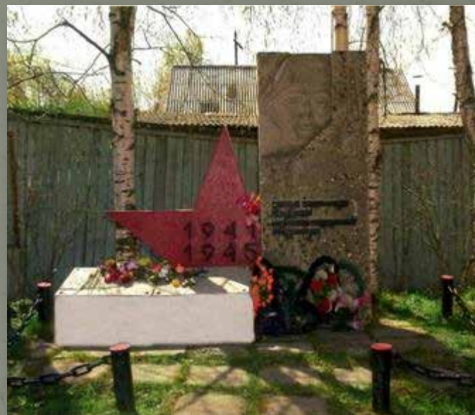
Обелиск к 30-летию Победы у здания управления Карпинского филиала ЗАО ПО «Свердлес» по ул. Ленина