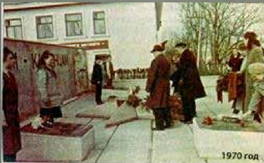
Памятник воинам-горнякам на площади имени В.В. Вахрушева.

10. Чусовитин Б. М. Памяти горняков, погибших в боях за Родину : [о памятнике воинам-горнякам на площади им. В. В. Вахрушева, г. Карпинск] / Б. М. Чусовитин // Карпинский рабочий. – Карпинск, 2015. – 22 – 28 апреля (№ 17). – С. 4 : фот. (Прил. «Богословский родник», вып. № 4).