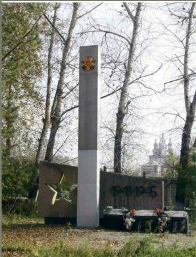
Обелиск к 30-летию Победы в сквере около машиностроительного завода по ул. Советской