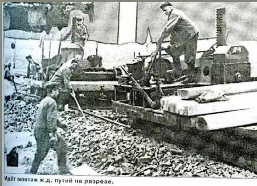
Идёт монтаж ж.д. путей на разрезе.