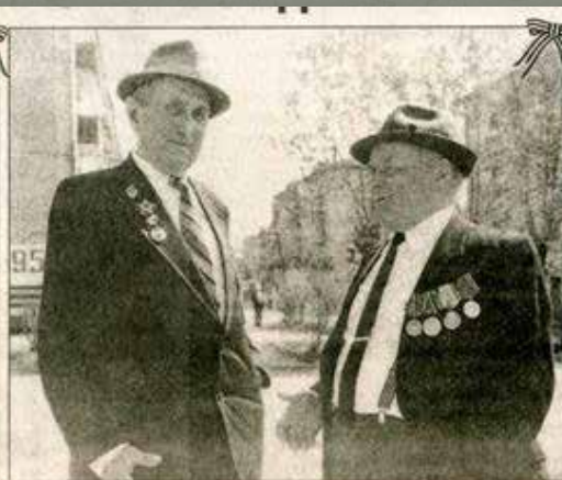
Ветеранам есть о чём поговорить.