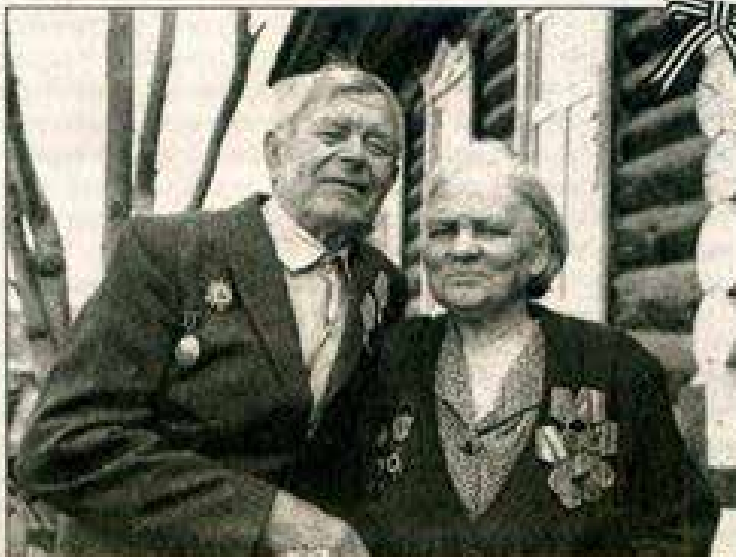
Ещё одна весна Победы.