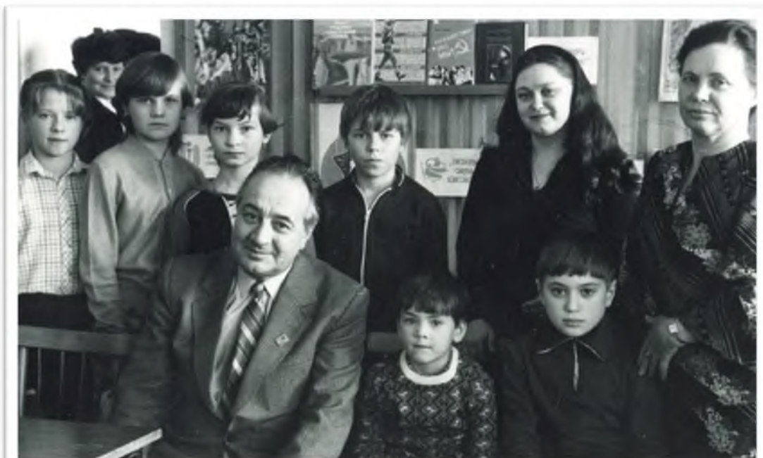
Анатолий Алексин на встрече с юными читателями. Каменск-Уральский. 1985 год

141. Востряков В. Возвращение в юность // Каменский рабочий. – 1985. – 23 марта (№ 58). – С. 3.