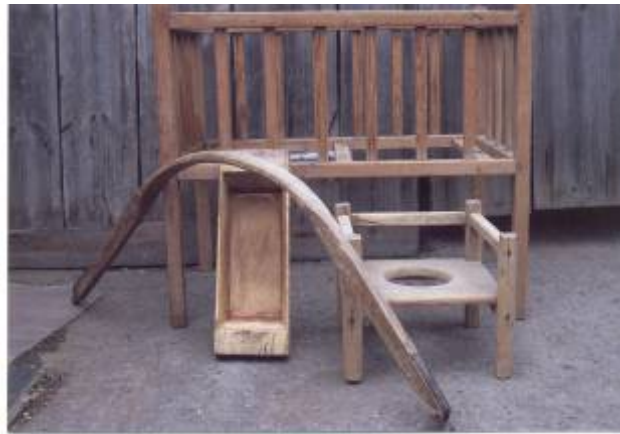
детская кроватка, коромысло, корытце, стульчик.