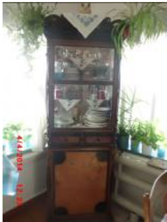
Горка до сих пор стоит в избах у каждого из детей.