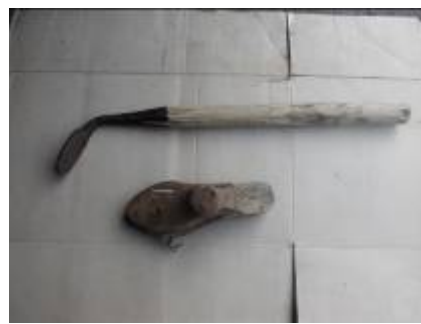
лапа и колодка - сапожные инструменты прадеда