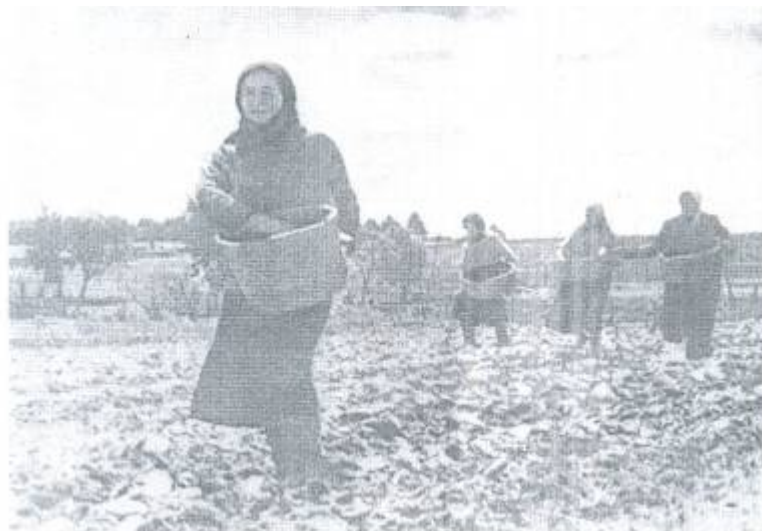
Ветер не задул