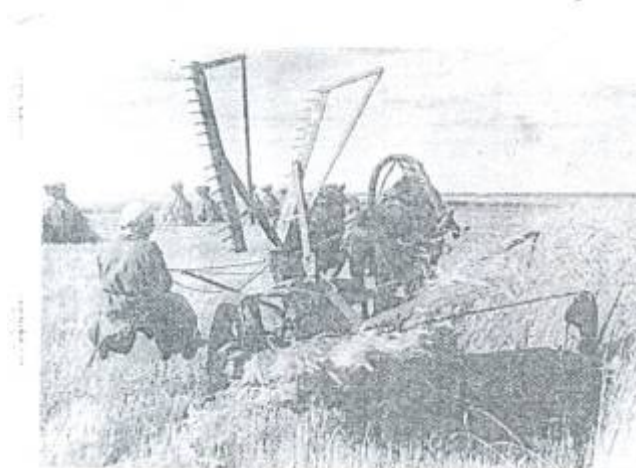
косыба зерновых конной косилкой в колхозе им. Тельмана