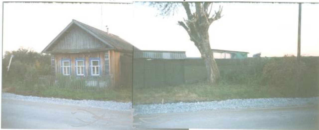
Родители бабушки жили в доме за этим деревом. Он рос перед окнами. Дома уже нет, а тополь стоит до сих пор. Семья построила новый дом в 1960 – 1962 годах. За домом сад.