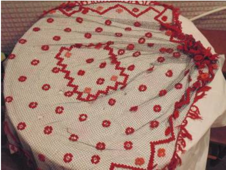
Скатерть – пофилея.