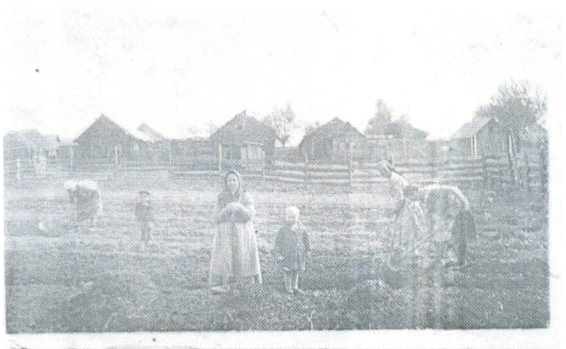
на огороде женщины и дети