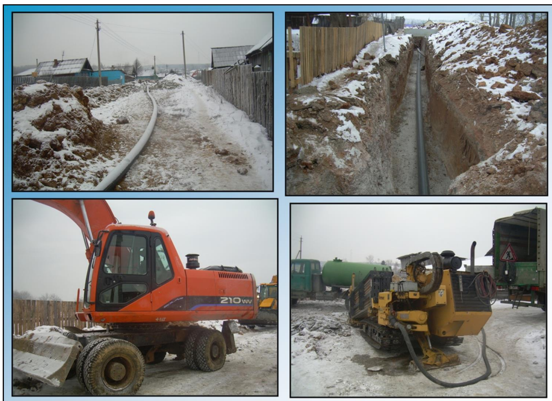
Строительство газопровода в селе Большое Трифоново 2011 год.

В 2011 году в селе Большое Трифоново началось строительство газопровода. Голубое топливо с нетерпением ждали все жители села.