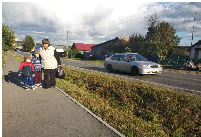
Новый тротуар в селе Большое Трифоново Фото Редькиной Н.А. 2020 год.

В июле 2018 года вдоль главной улицы села Большое Трифоново был обустроен тротуар площадью 362 кв.м. По нему идут учащиеся в школу, дети в детский сад, жители спешат на автобусную остановку и в магазин.