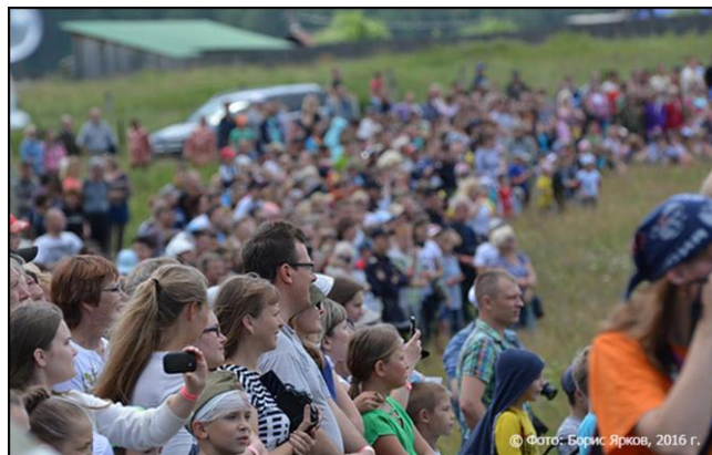
Покровский рубеж 17 июля 2016 г.

Тогда же зародилась и традиция дополнять фестиваль исторической реконструкции интерактивными площадками: гостям показали, как выглядели быт полевых лагерей и лазарет, дали возможность ближе познакомиться с народными промыслами и продемонстрировали азы кулачного боя от мастеров военно-спортивных клубов.