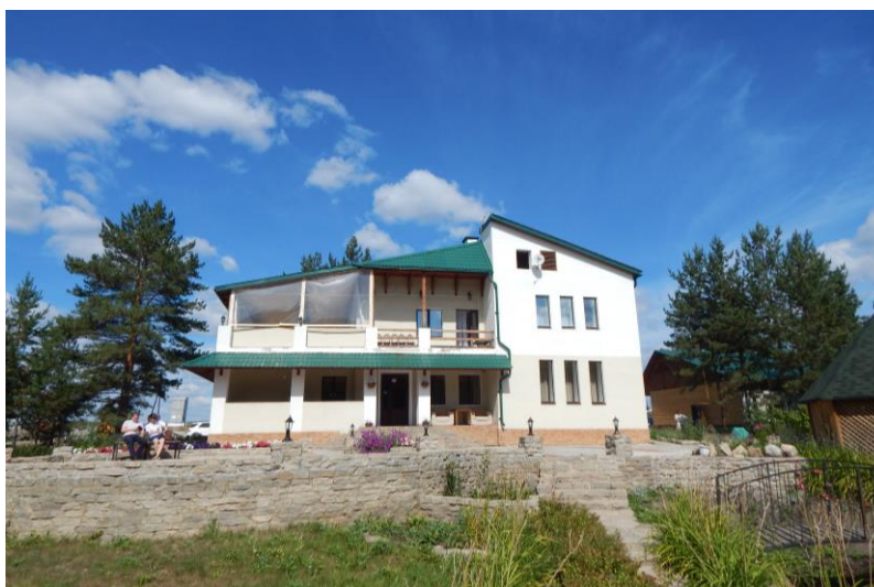
Загородный гостинично-ресторанный комплекс «Усадьба» Фото Редькиной Н.А. 2013 год

В 2011 году вырос загородный гостинично-ресторанный комплекс «Усадьба».