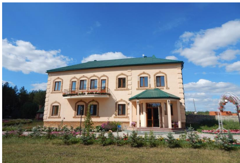
Гостиница «Малахит» Фото Редькиной Н.А. 2013 год

В 2010 году на территории села Большое Трифоново был создан уникальный островок спокойствия и свежего воздуха – гостиница «Малахит».