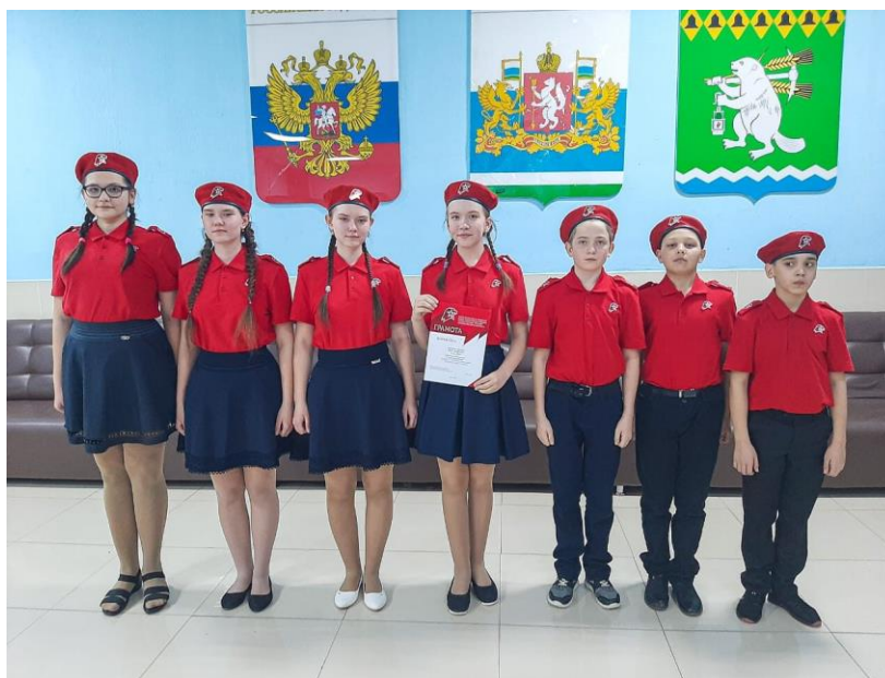
Юнармейцы отряда «Кречет» Фото Дудиной Е.М. 2020 год.

С 20 декабря 2019 года на базе МБОУ «ООШ № 5» сформирован отряд «Кречет» Всероссийского детско-юношеского военно-патриотического общественного движения «ЮНАРМИЯ». В нашем отряде состоит 19 учащихся.