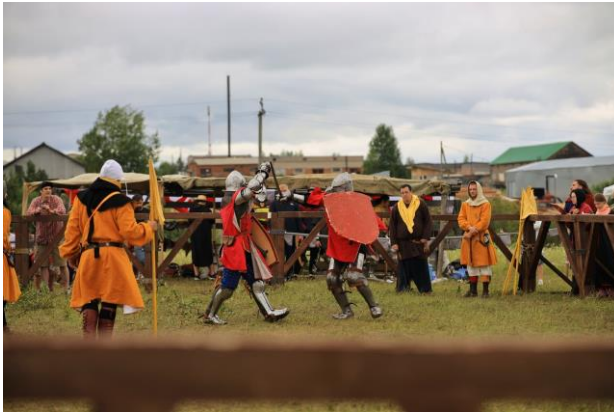
«Покровский рубеж» 12 июля 2021 г.

Проект «Военно-исторический парк "Покровский рубеж"» реализуется с использованием гранта Президента Российской Федерации.