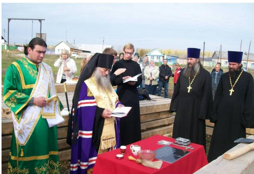
Освящение камня у основания храма во имя святого Трифона