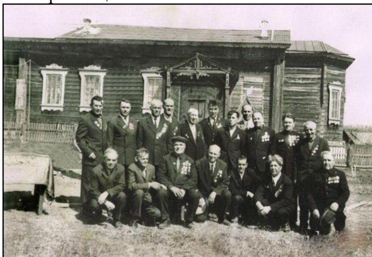
Фронтовики села Большое Трифоново напротив здания бывшей церкви Конец 60-х годов 20 века.

В конце 30-х годов XX века она была приспособлена под сельский клуб, на втором этаже размещалась библиотека.