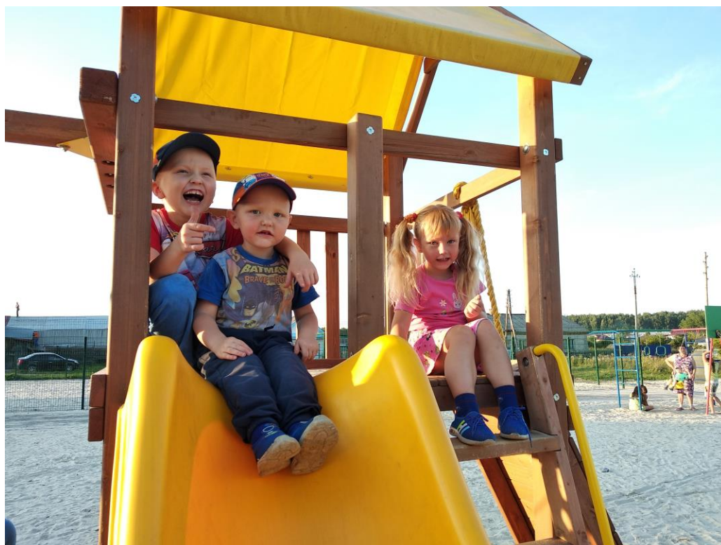
Местные ребятишки на горке 2019 год.

Желающих отдохнуть в селе заметно прибавилось, площадка стала излюбленным местом проведения досуга для детей и подростков.