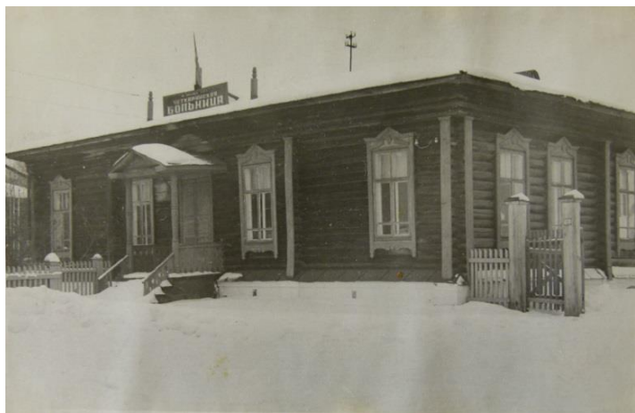
Амбулатория 1970-е гг.