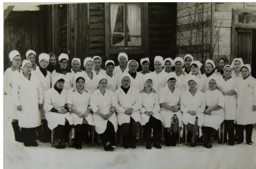
Коллектив больницы 1970-е гг.