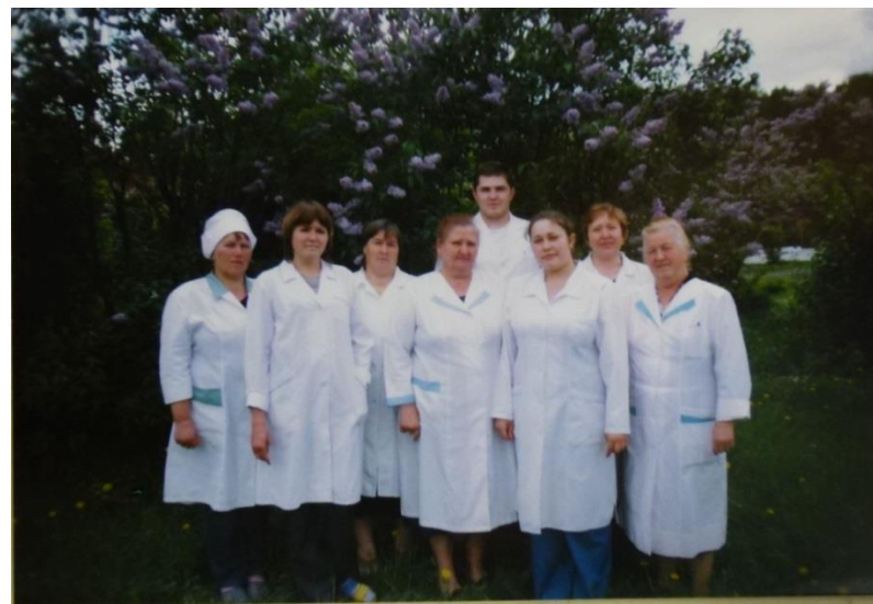
Коллектив больницы 2008г.