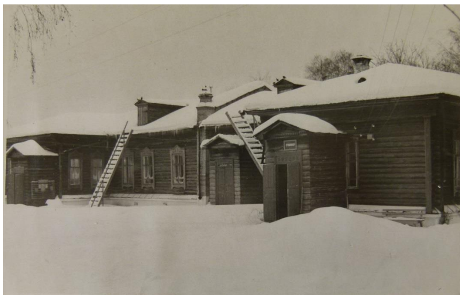
Стационар 1970-е гг.