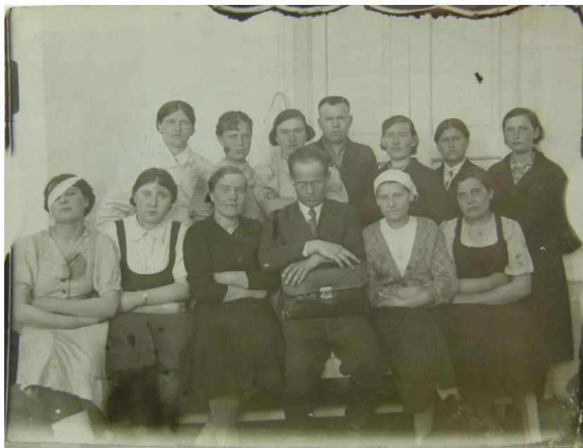
Коллектив больницы. Фото предвоенных годов.