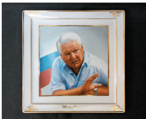
Рис. 9 – Портреты ручной росписи, изготовленные к открытию Президентского центра Б.Н. Ельцина 25.11.2015 г. в Екатеринбурге