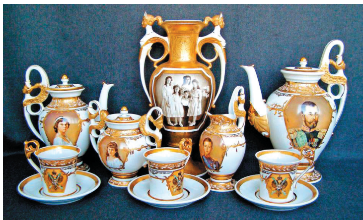
Рис. 2 – Чайно-кофейный сервиз (форма «Дворянская», ручная роспись «Царская семья»)

После окончания Абрамцевского ху-дожественно-промышленного училища на завод приехали художники Н.Ф. Малы-шев и Н.С. Иноземцев, ранее проходившие здесь практику. С их приездом расширил-ся ассортимент изделий, повысился их технический и художественный уровень, усложнились формы. Создаются изделия на разные сюжеты из сказов П.П. Бажова, посвящённые юбилейным и знаменатель-ным событиям. С этого периода существен-