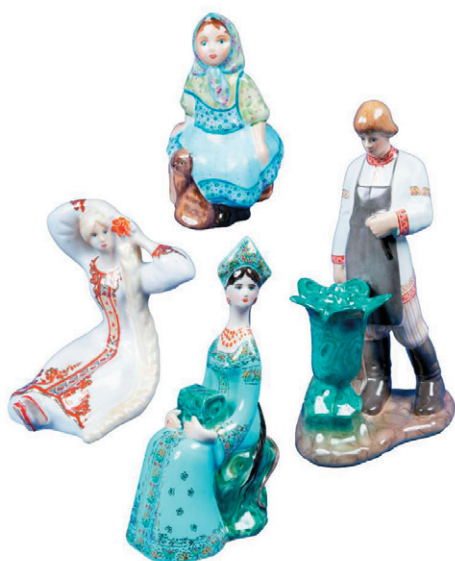
Рис. 3 – Фарфоровые сувениры «Хозяйка Медной горы», «Данила-мастер», «Дарёнка с Мурёнкой», «Золотой Волос»

но возрастает спрос на продукцию завода, улучшается качество, расширяется ассортимент. В продажу поступают чайные и кофейные сервизы, вазы, скульптуры. Среди прочих изделий, завод освоил выпуск малых скульптур по мотивам бажовских сказов «Хозяйка Медной горы», «Данила-мастер», «Дарёнка с Мурёнкой», «Золотой Волос» (рис. 3). Ежегодно завод осваивает