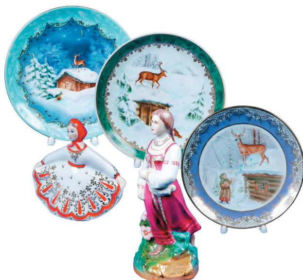
Рис. 1 – Фарфоровые изделия на разные сюжеты из сказов П.П. Бажова

когда на время покоса закрывались фабрики. Заготовка сена для личного хозяйства дополнялась работой на огороде, сбором грибов и ягод. Здесь духовно формировался писатель – видел и познавал нравы, обычаи уральских горнорабочих [1]. С молодых лет ему открывалась неписанная история родного края. Слушал рассказы заводских рабочих о даровитых мастерах, о тяжелом труде в старинных рудниках, о «вольных людях». В тихие вечерние часы он с заводскими ребятами слушал горняцкие были и легенды о сказочном змее Полозе и о его дочерях Змеёвках, о Хозяйке медной горы, что охраняет богатство уральских недр, пока не придёт за ними «смелый да умелый первый добытчик». В будущем эти услышанные в детстве рассказы послужили основой знаменитых произведений П.П. Бажова, на весь мир воспевающих красоту и богатство Урала и Сысертского края. Персонажи сказов П.П. Бажова вдохновили мастеров Сысертского завода художественного фарфора на создание их образов в скульптурах (рис. 1).