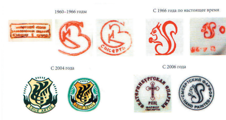
Рис. 6 – Клейма Сысертского завода различных лет

В 2000 г. творческая группа из 13 живописцев и 5 литейщиков – самый важный участок на предприятии. Отсюда идут в производство все новые разработки. Каждый живописец со своими задумками, у каждого своё лицо. Многие закончили училище № 35 при заводе, но есть и выпускники гжельского колледжа, Абрамцевского художественно-промышленного училища им. Васнецова. Ряд сотрудников ездили на стажировку в Академию художеств в Санкт-Петербург. Всего же на предприятии в этот период работает около 150 художников. До 90% выпускаемых изделий они расписывают вручную.