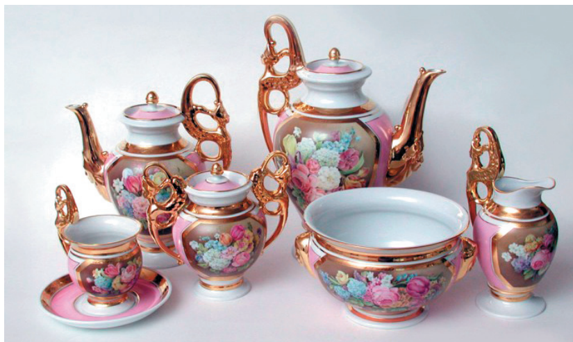
Рис. 4 – Чайно-кофейный сервиз (форма «Дворянская», роспись «Букет»)

В нач. 1980-х гг. на заводе была создана экспериментально-технологическая