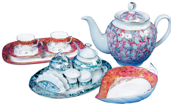
Рис. 5 – Фарфоровые изделия росписи «Русский сувенир» (набор «Тет-а-тет» и конфетница «Листок») и изделия с эффектом кракле (чайник и набор для завтрака)

С 2000 г. для разработки форм на заводе стали использовать технологии компьютерного моделирования. Впервые по этой технологии изготовили штоф по заказу фирмы «Алкона». Раньше была проблема с укупоркой, теперь появилась возможность обеспечить точность моделирования. Предложили «Алконе» несколько моделей. Они остановили свой выбор на чисто белом штофе, где играет только рельеф. Отправили в фирму первые сигнальные экземпляры, а они, сразу же, наполнив штофы, отослали свою продукцию на выставку в Санкт-Петербург. И завоевали там Гран-при! Причём отмечены были и сам бальзам, и дизайн его упаковки. В 2000 г. изготовлено 600 таких штофов.