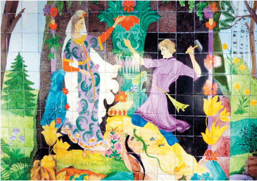
Рис. 8 – Панно Хозяйка Медной горы, выполненное художниками завода

существовали два клейма одновременно. Это продолжалось до тех пор, пока не закончились деколи нового клейма.