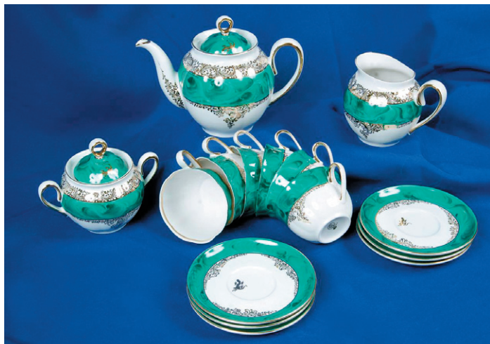
Рис. 7. – Сервиз ручной росписи «Малахит»

В это время знак «белочка» продолжали ставить на другие изделия завода. Таким образом, какое-то время на заводе