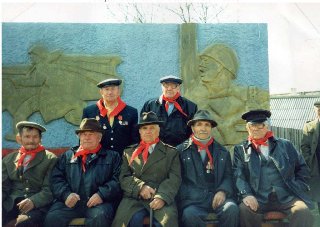
Не стареют душой ветераны 2005 год.

Как и много лет назад, у памятника собирается и стар и млад, чтобы отдать дань памяти тем односельчанам, что отдали свои жизни за мир на Земле.