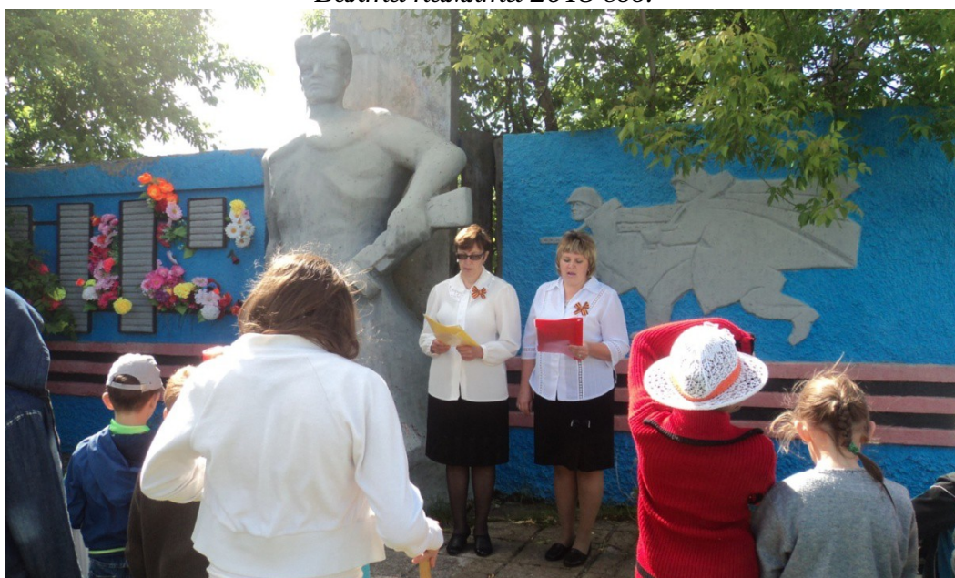
22 июня 2014 года Юбилей памятника 30 лет