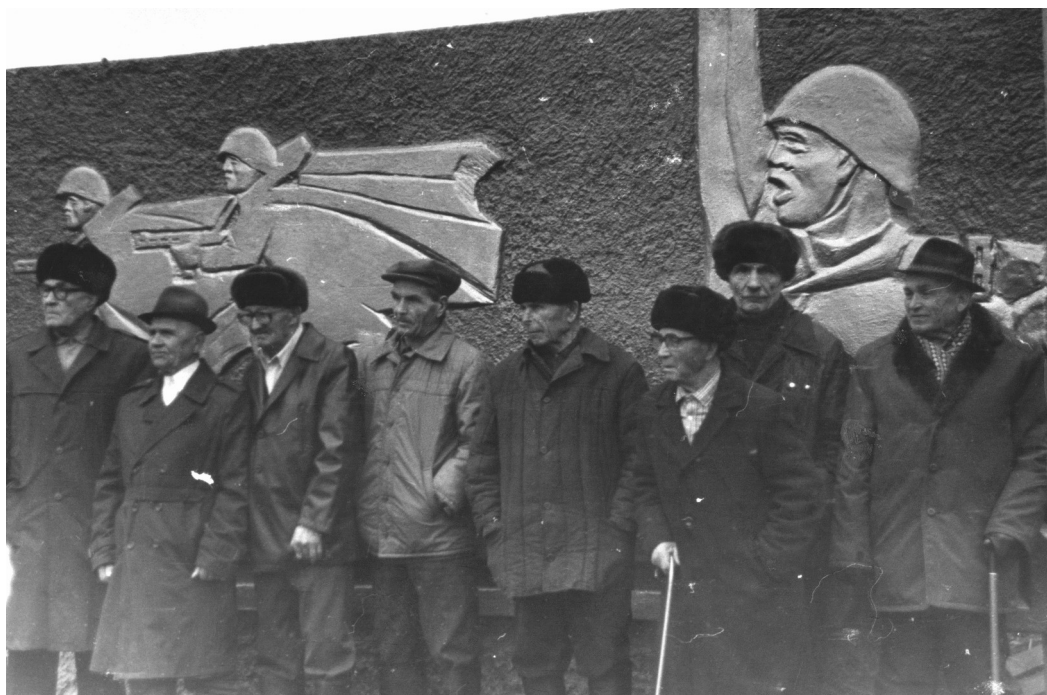
Вот они живые свидетели войны 1990 год.