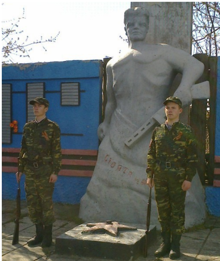
Вахта памяти 2013 год.

Не забывают односельчане собраться у памятника 22 июня и 23 февраля.