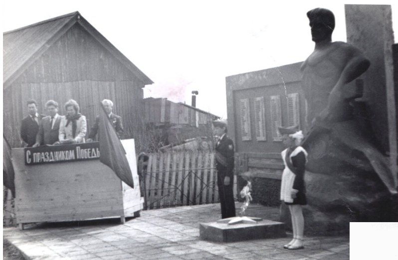
Вахта Памяти. 1986 год.