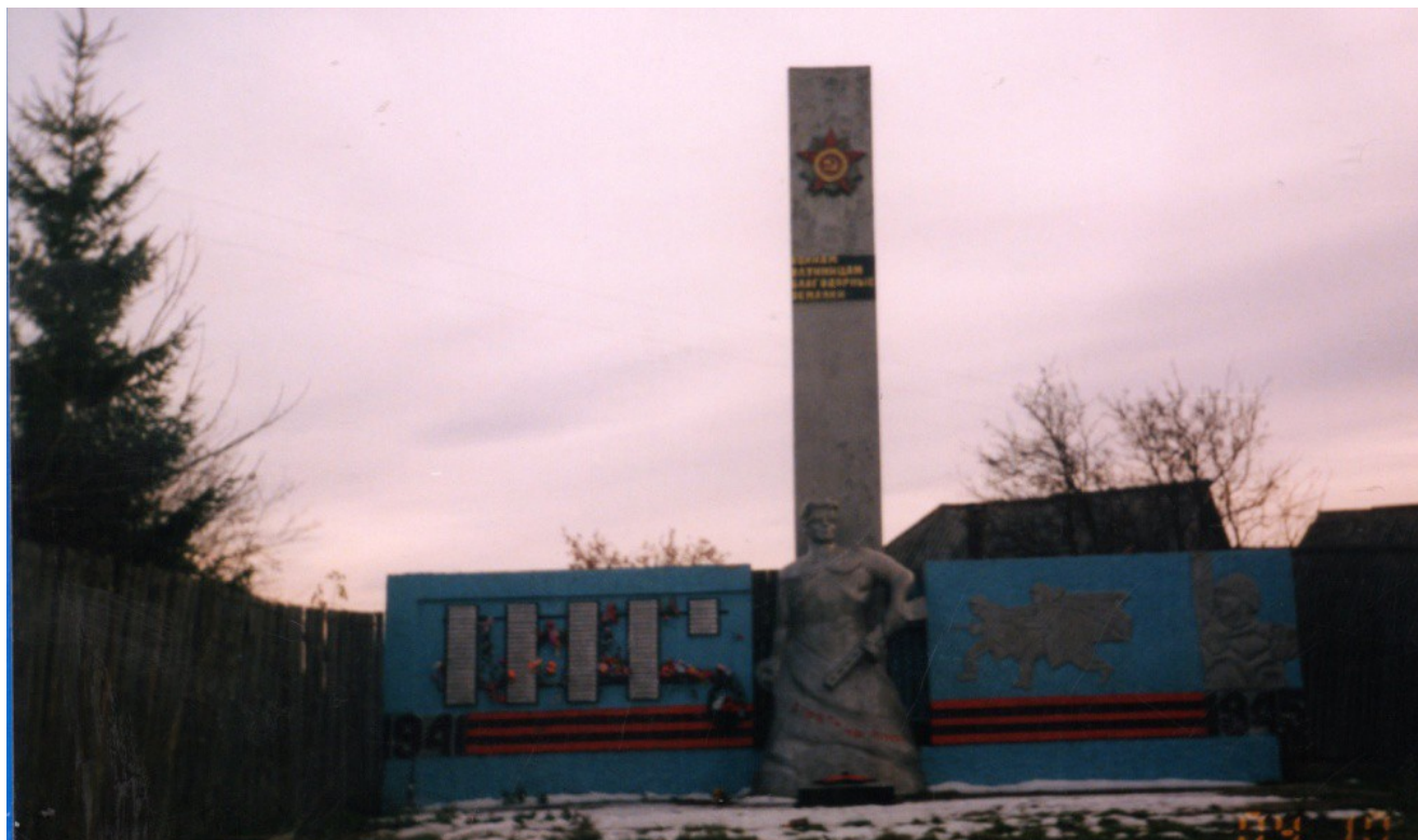
Общий вид памятника 2004 год.