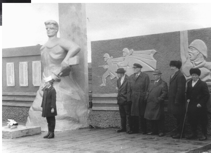
9 мая 1987 года, участники В.О. войны.