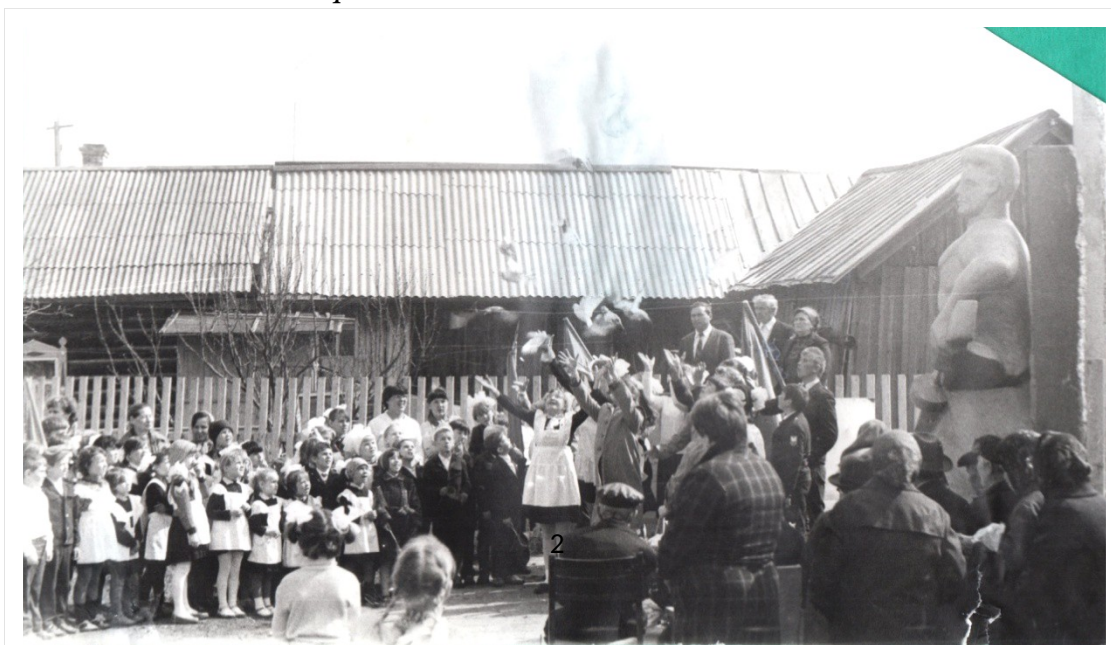
Открытие памятника 9 мая 1984 год

9 мая 1984 года состоялось торжественное открытие памятника, а вот имён героев Гражданской войны, на этом памятнике не разместили.