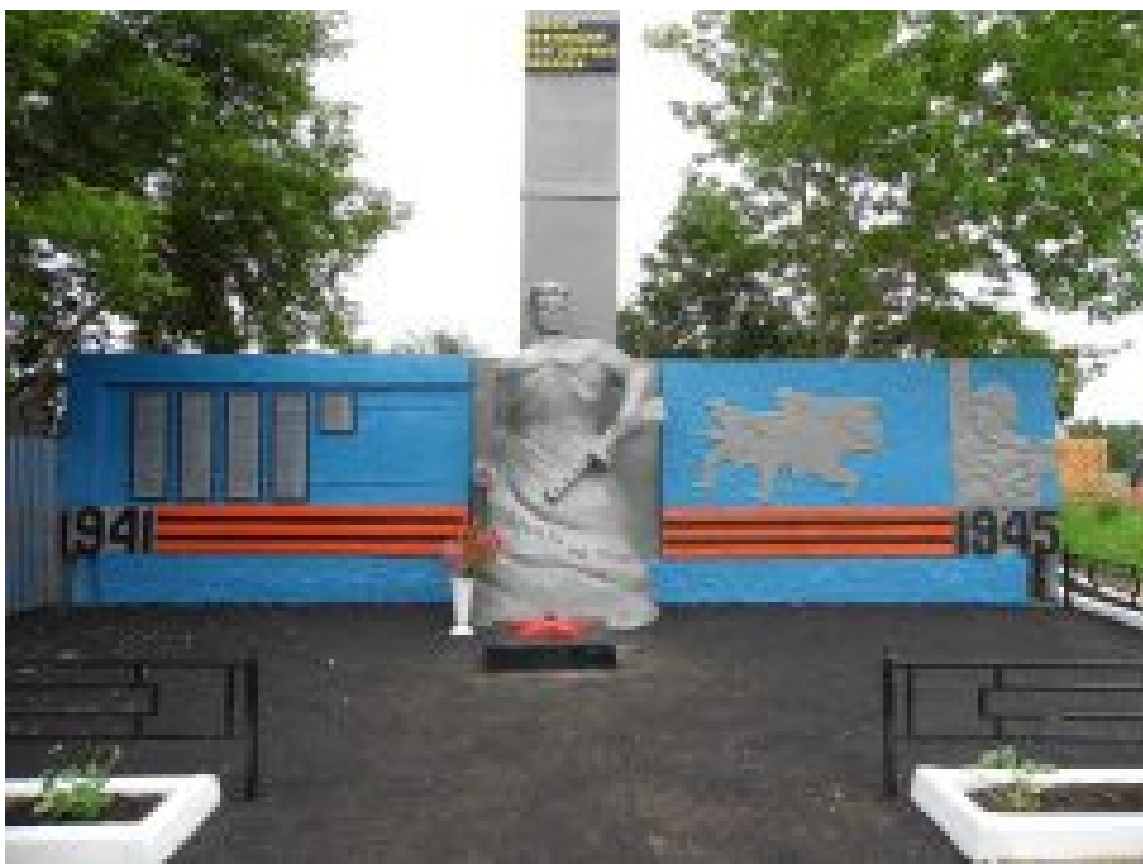
Памятник после ремонта июнь 2015 год

Материалы об истории села хранятся и обновляются в библиотеке в школьном музее «Истории села и школы».