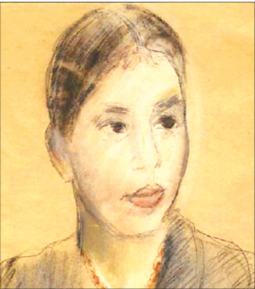
Один из двух десятков графических портретов Некрасовой (набросков, рисунков, этюдов), выполненных художником Робертом Фальком в 40-е-50-е годы XX века. Они разные, но все очень живые