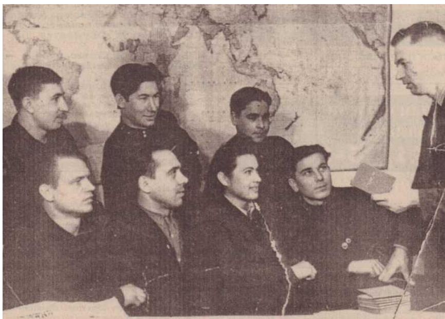
Отправка на целину. Март 1954 г.

Сегодня в сумятице голосов, напрочь отвергающих социалистическую идеологию, нет-нет и промелькнет нотка сожаления о том, что, поспешив расстаться с «застойным» прошлым, мы «с водой выплеснули ребенка». Никто ведь не будет спорить, что в комсомольском движении было много формализма, насаждаемого со стороны партийных органов. Но в то же самое время комсомольцы считала себя сопричастной ко всем событиям и свершениям, которыми жила страна. Комсомольцы с пониманием отнеслась к идеям партии об освоении целинных земель и активному участию в грандиозных стройках народного хозяйства. Само членство в комсомоле – уже было экзаменом на гражданственную зрелость.