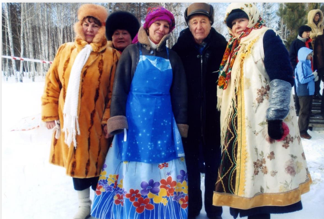
На масленице в Курганово (Полевской городской округ)

Воспоминания жителей об отдыхе на водоемах города Полевского и о лодочной станции на берегу Верхнего пруда в 1930–1970-е годы.