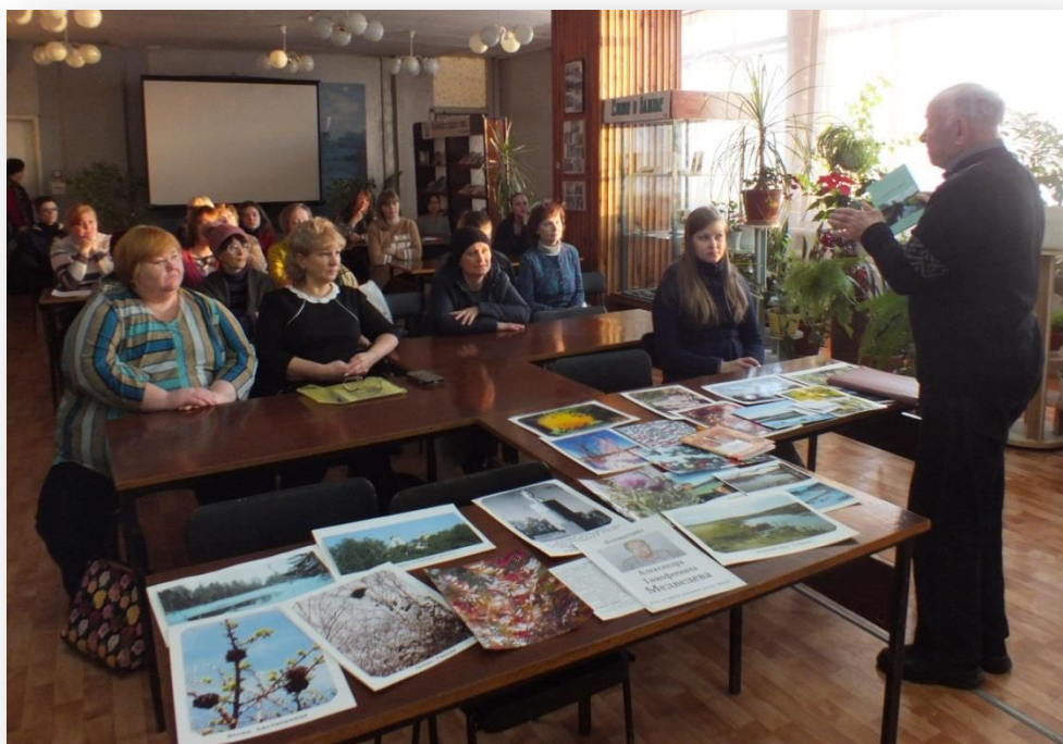
На презентации своей книги «У речки Полевой»

несколько экземпляров библиотекам Полевского городского округа и подписал их своей рукой.