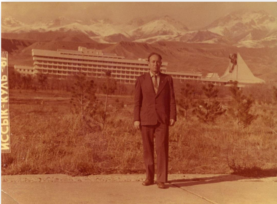
Иссык-куль, 1981 год