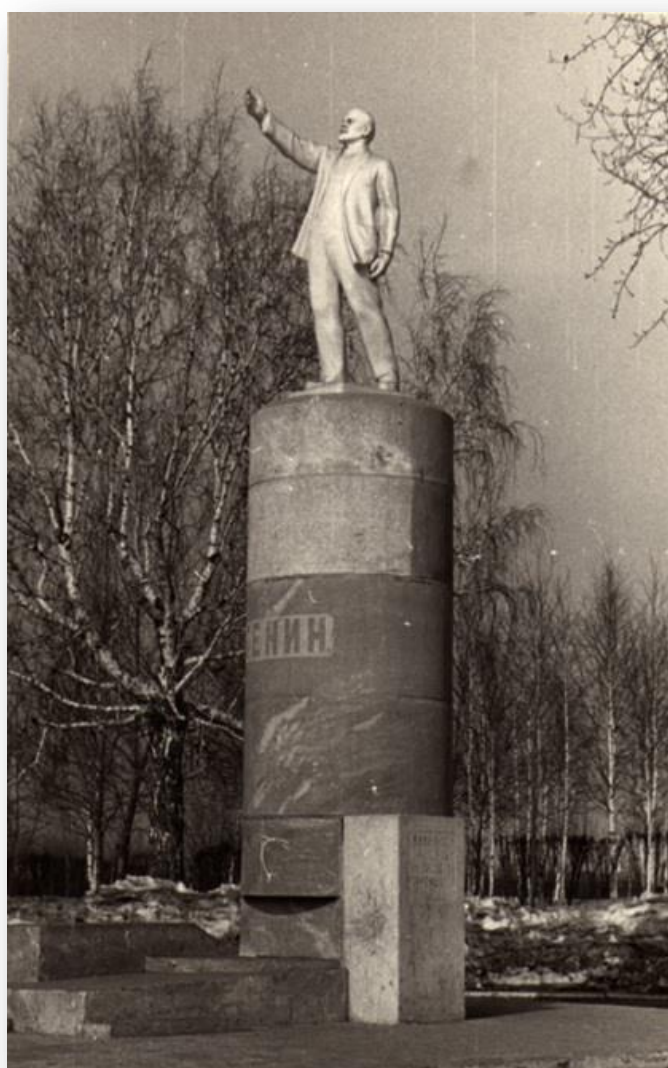
Памятник В. И. Ленину в южной части Полевского на улице Ильича

О памятнике Владимиру Ильичу Ленину (1870–1924), который с 1933 по 1993 годы украшал улицу Ильича.