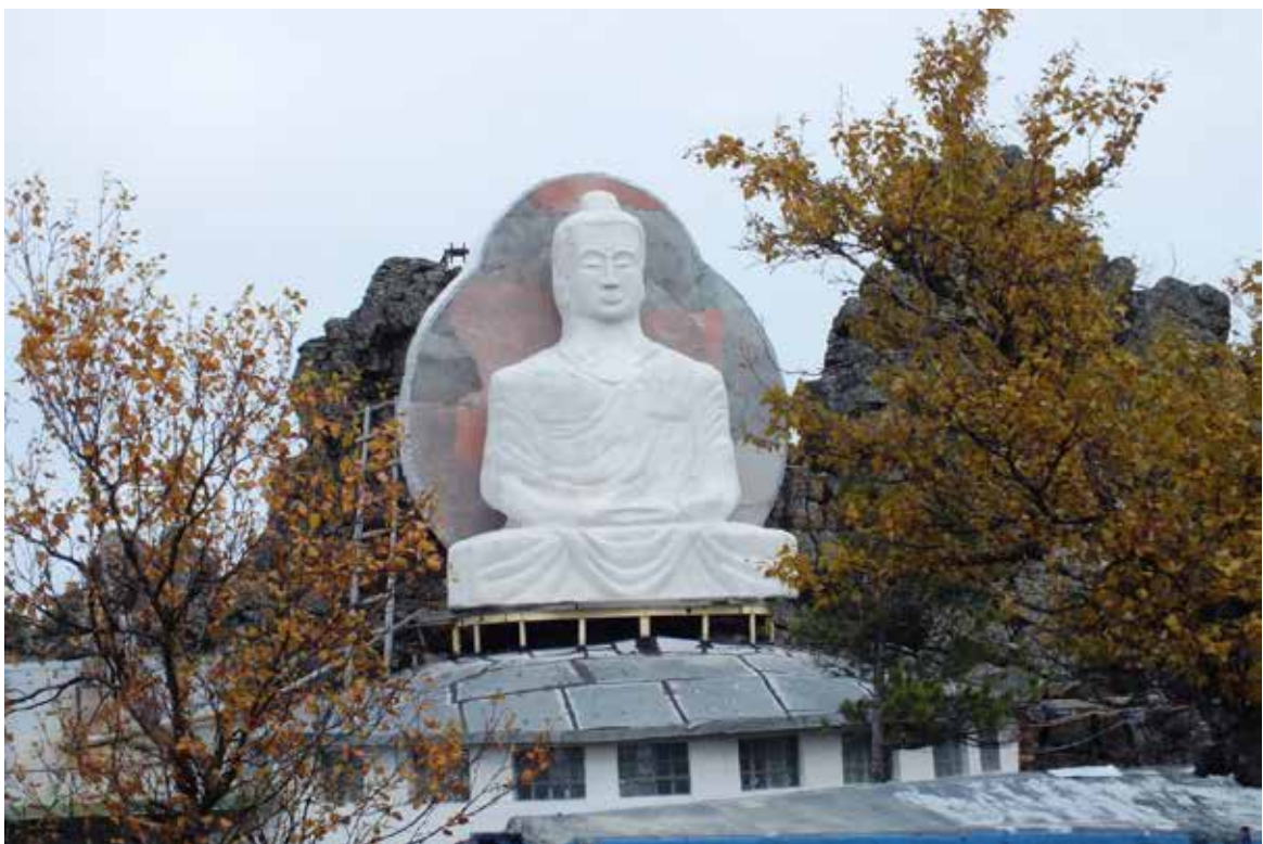
Рисунок 2 Буддийский храм Шад Тчуп Линг.