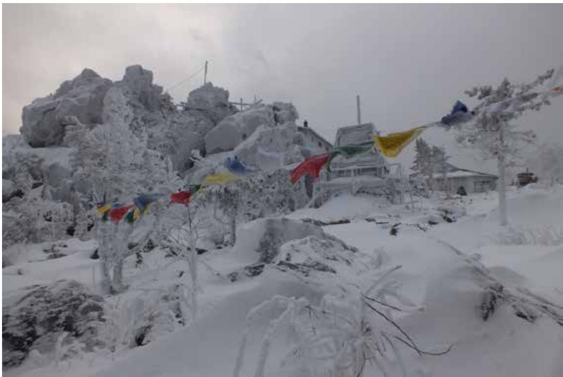
Рисунок 1 Буддийский храм Шад Тчуп Линг зимой.