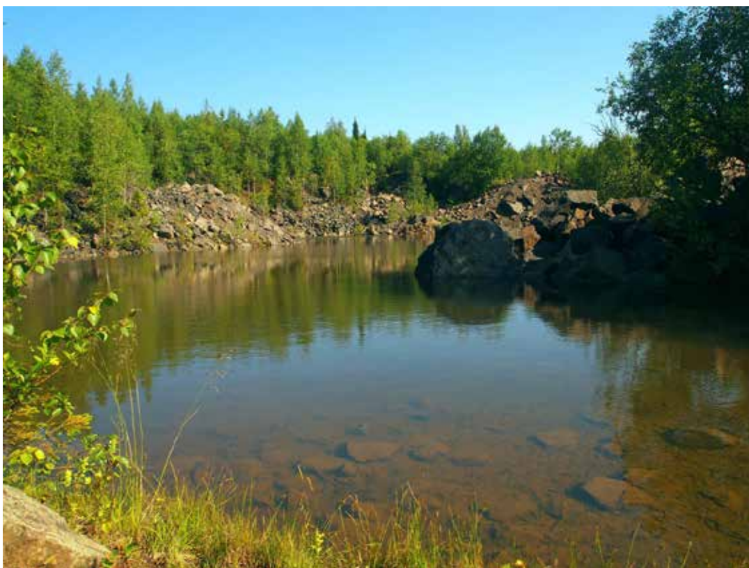
Рисунок 8 Горное озеро.