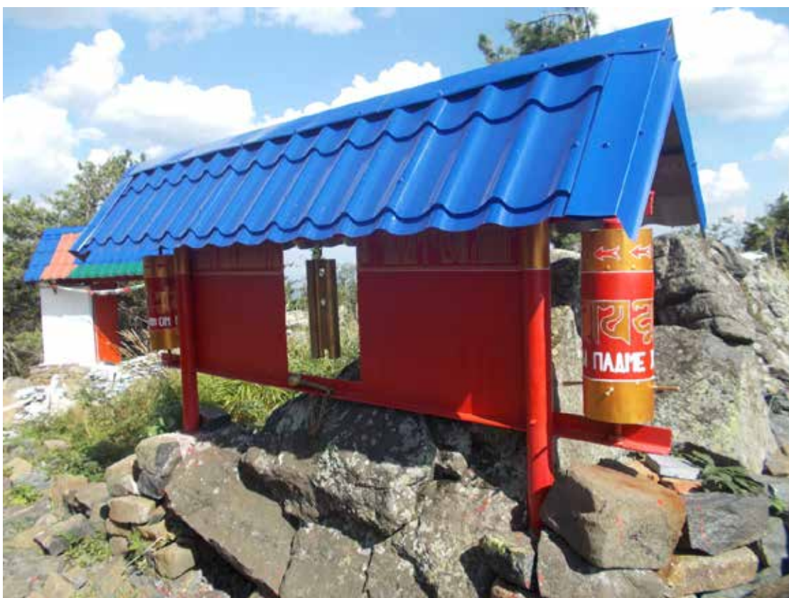
Рисунок 4 Вход в буддийский храм Шад Тчуп Линг.