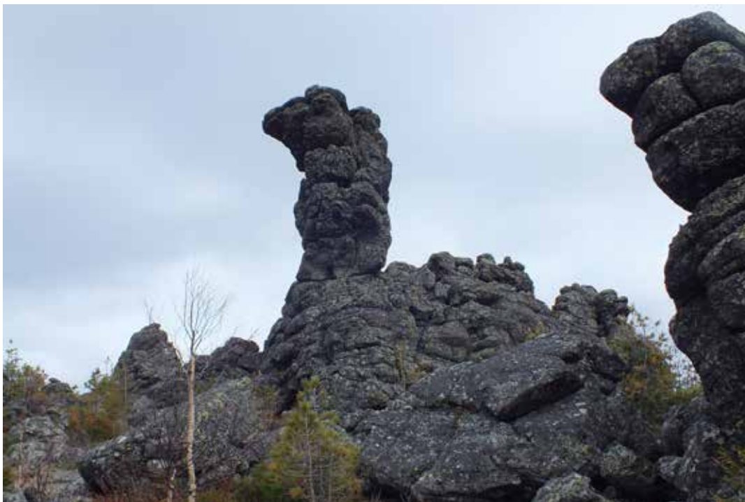
Рисунок 7 Гора Верблюд.