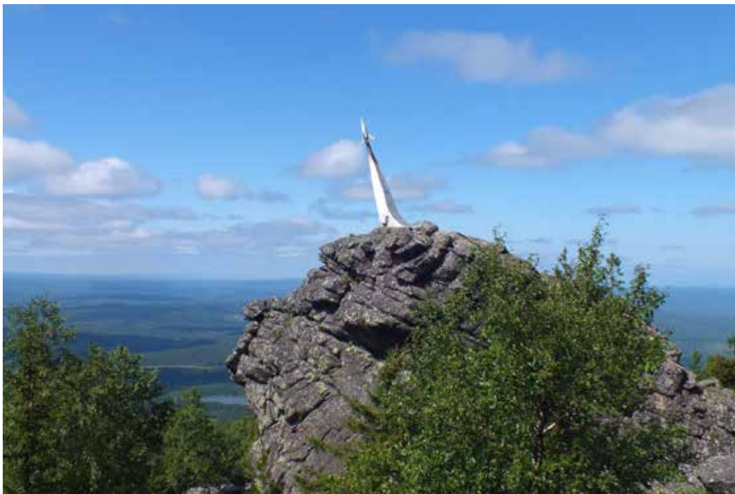
Рисунок 9 Памятник Юрию Гагарину.