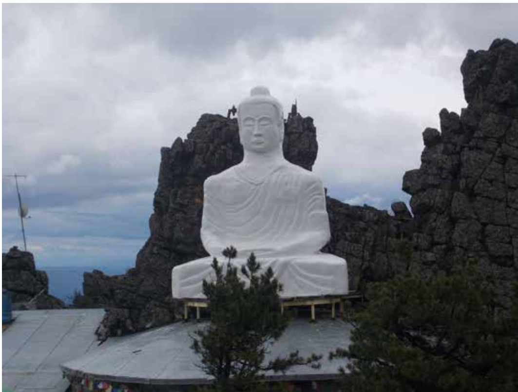
Рисунок 5 Статуя Будды.