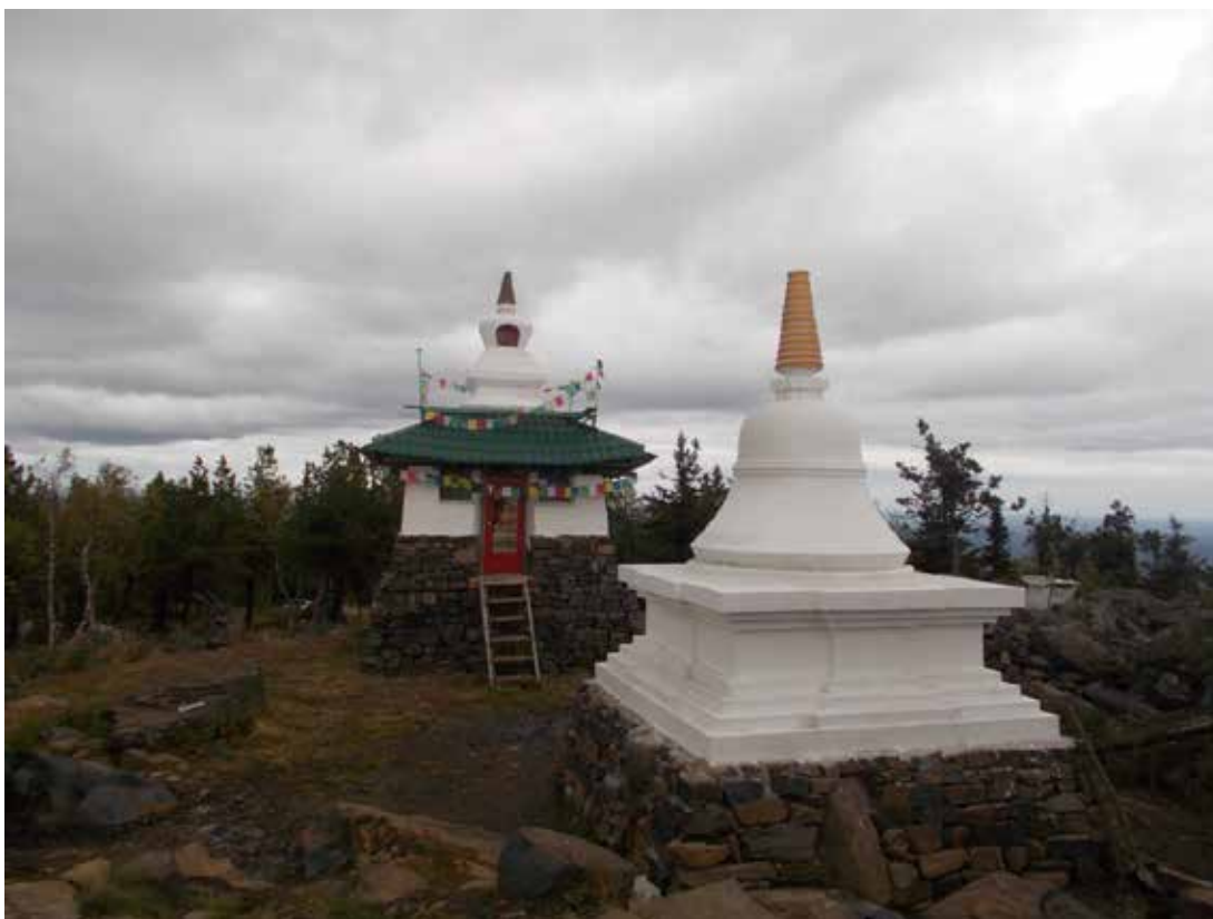
Рисунок 3 Буддийский храм Шад Тчуп Линг. Фото Е. Перминов