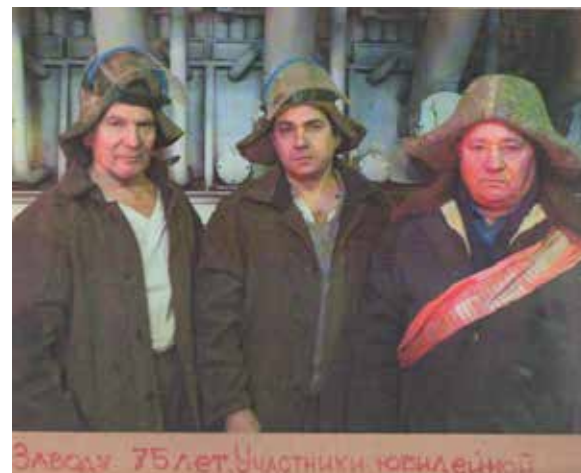
Заводу 75 лет. Участники юбилейной

По страничкам истории / по материалам исторического музея города Режа // Планета молодых. – 2008. - № 12. – С. 7. – (Прогулки по городу. Компас путешественника)