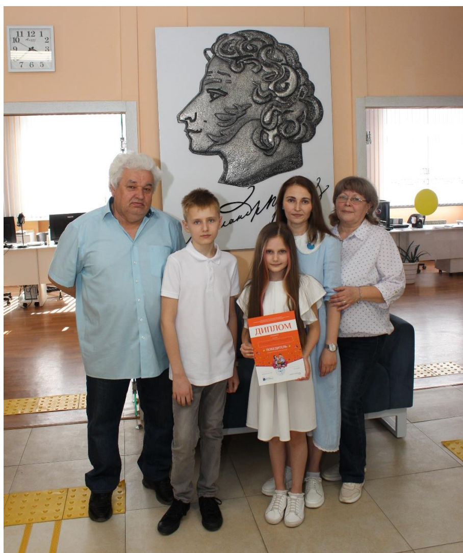
На награждении самой читающей семьи