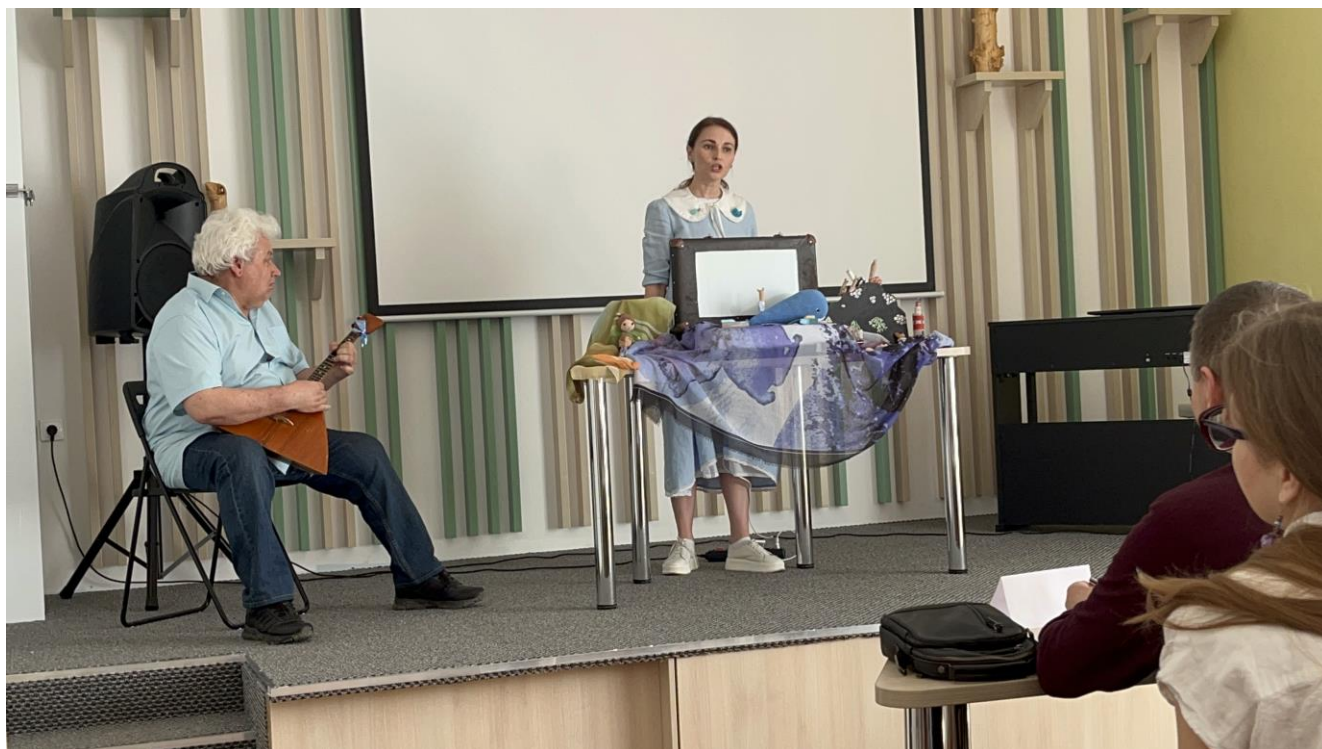
Заключительный этап конкурса - показ сказки