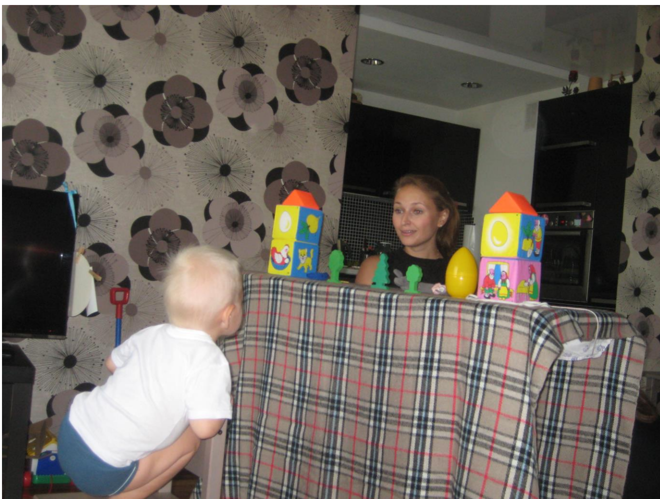
Самая первая наша сказка Курочка Ряба