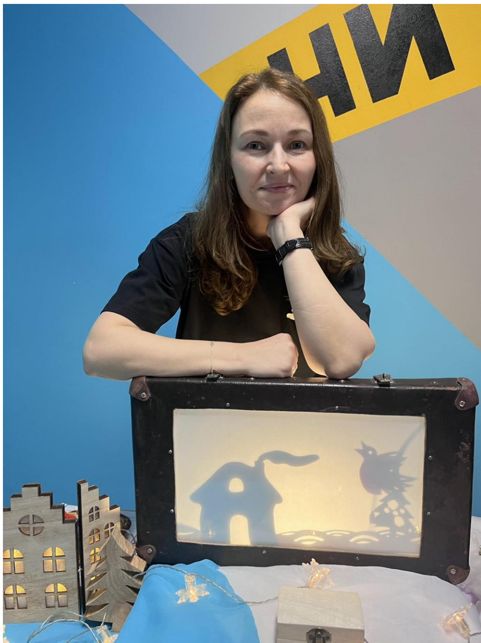
Сказки из чемодана в библиотеке