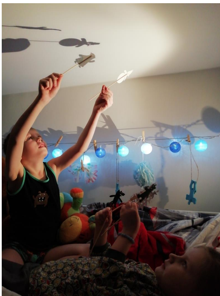
Импровизация театра теней