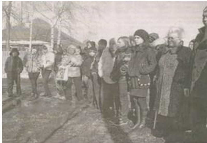
Момент памятного митинга

Конечно, на выставке была представлена лишь небольшая часть уникальной коллекции, но посетившие ее в этот день люди узнали много нового о жизни, характере, привычках и пристрастиях бесстрашного летчика, отличного друга, щедрого брата, красивого мужчины – покорителя женских сердец.