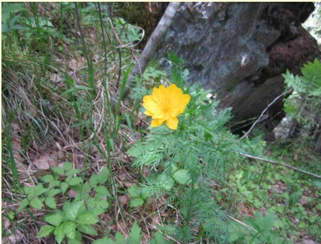
Адонис весенний (горицвет)

На Тропе встречаются растения, занесенные в Красную книгу Свердловской области.