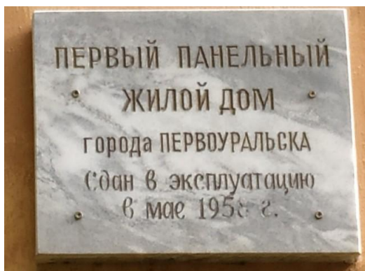
Мемориальная доска на доме на ул. Ильича, 8а. Июнь 2019 г.

В 1959 г. Василий Васильевича как скромного и трудолюбивого труженика, завоевавшего своим честным и добросовестным трудом большое уважение в коллективе, избрали в депутаты Верховного Совета РСФСР – высшего органа государственной власти РСФСР в 1937–1990 гг. Первый раз приехал в Москву 13 апреля 1959 г. на сессию Верховного Совета РСФСР.