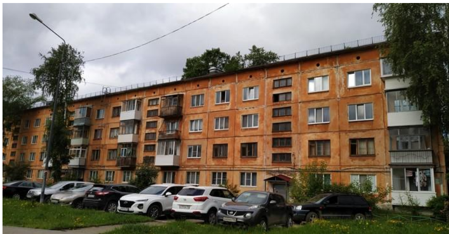
Дом на ул. Ильича, 8а. Июнь 2019 г.

тот обладает большой сноровкой и трудолюбием, сам любит трудиться и помогает молодым рабочим освоить профессию.