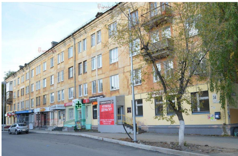
Первый крупноблочный дом в Первоуральске на ул. Ватутина, 34.