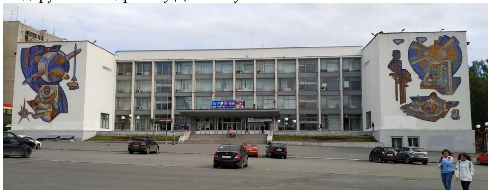
Дворец культуры и техники Новотрубного завода. 2019 г.