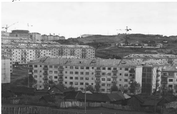
Город Первоуральск. 60-е годы XX в.

жил ребятам: «Мы берем обязательства в общем и целом, а надо, чтобы каждый рабочий лично отвечал за судьбу плана. Стремился улучшить дело, добиться высоких достижений на каждом рабочем месте. Будем брать первый рубеж - монтировать не менее четырех с половиной квадратных метров жилой полезной площади на человека в смену» . Почин одобрили коллегия Главсредуралстроя, Свердловский обком КПСС. Первыми движение за достижение наивысших показателей в натуральном выражении на человека в смену оценили и применили у себя строители: монтажники, плотники, каменщики, бетонщики, отделочники. Потом – работники промышленности, транспорта, сельского хозяйства. Оно подстегнуло весь рабочий класс Урала. Шагнуло за Урал. Сами инициаторы агитировали словом и делом, творили настоящие чудеса.