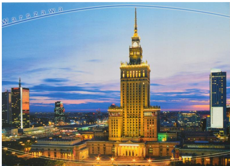
Дворец культуры и науки. Варшава.