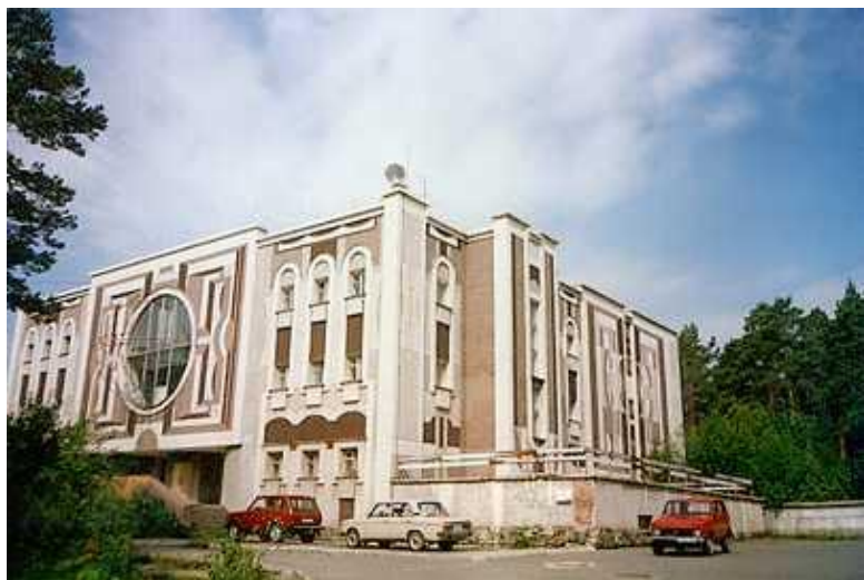
Санаторий-профилакторий «Строитель» («Соколинный камень»). 1972 год постройки.