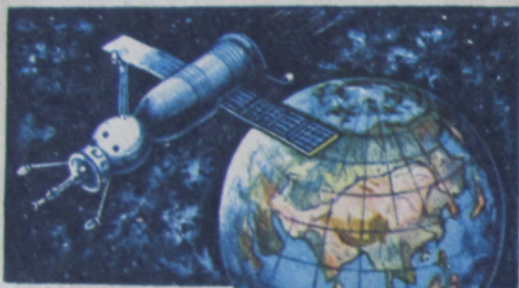
КОСМИЧЕСКИЙ КОРАБЛЬ „СОЮЗ-3“

Куда 2. Свердловск ул. Ватутина, 30, кв. 19-20