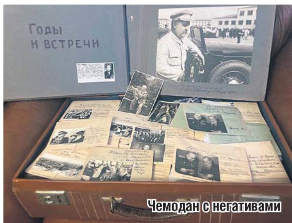
Чемодан с негативами