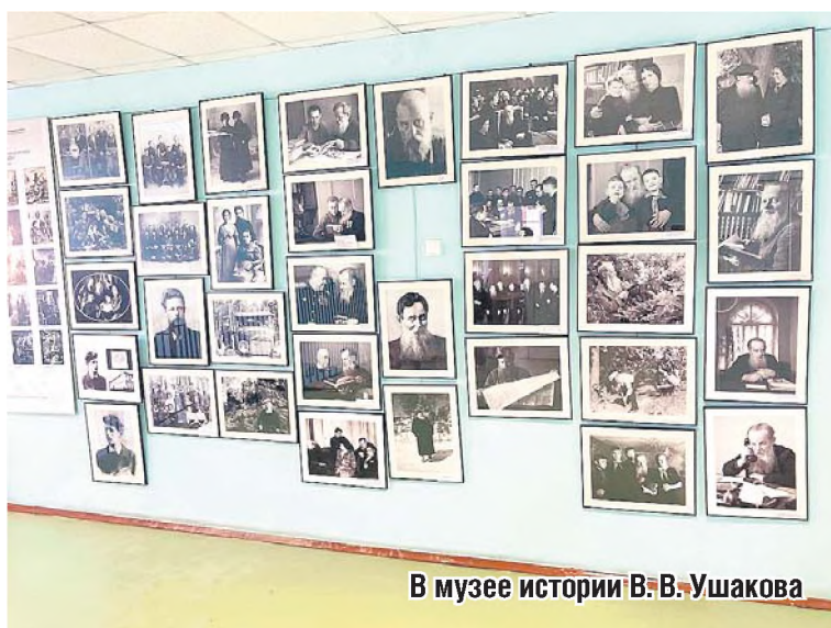
В музее истории В. В. Ушакова