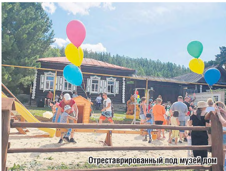
Отреставрированный под музей дом

Ирина Летемина.