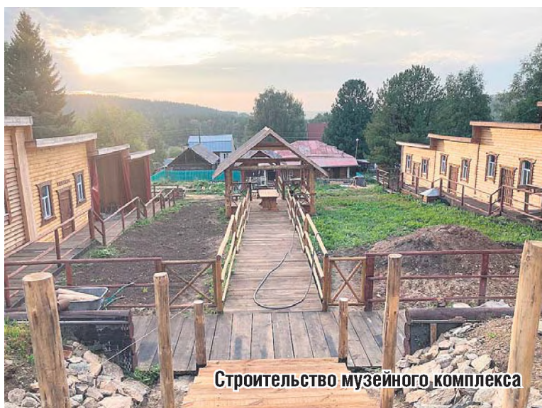
Строительство музейного комплекса