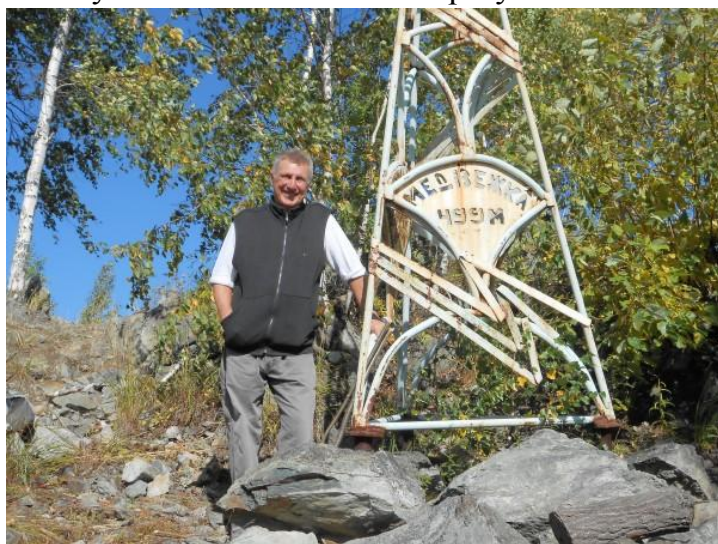
Знак «Европа-Азия» до покраски и его создатель

В народе знак так и называют – «ломовский». Можно сказать, что тропа к этому столбу «Европа-Азия» не зарастает. Тысячи туристов посещают его, в том числе и Новоуральский турклуб «Кедр» несколько раз в год проводит массовые походы выходного дня именно к этому географическому знаку.