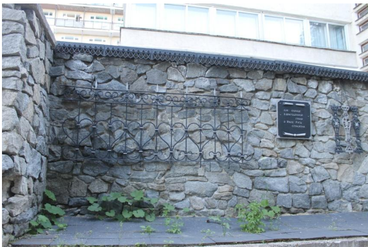
Часть музея в санатории «Зеленый мыс»