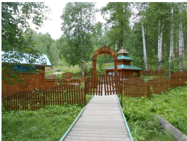
Родник Святого Серафима Саровского