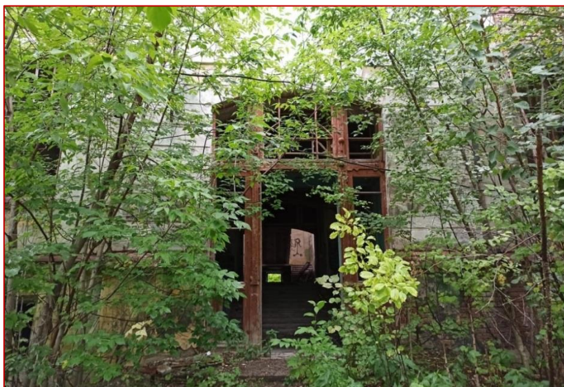
Рисунок 22. Бывшая центральная больница г. Кушва, фото 2020 г.