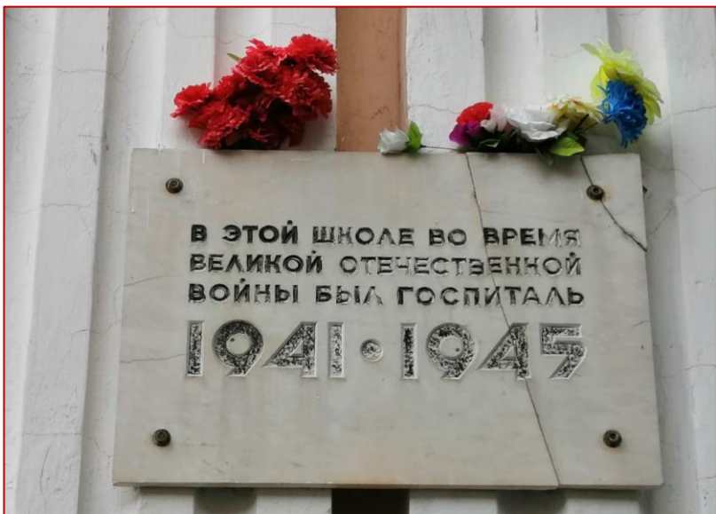
Рисунок 20. Памятная плита на школе № 42, фото 2020 г.