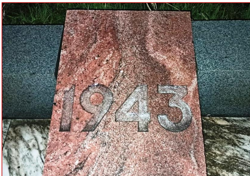
Рисунок 8. Мемориальная плита с надписью «1943», фото 2020 г.