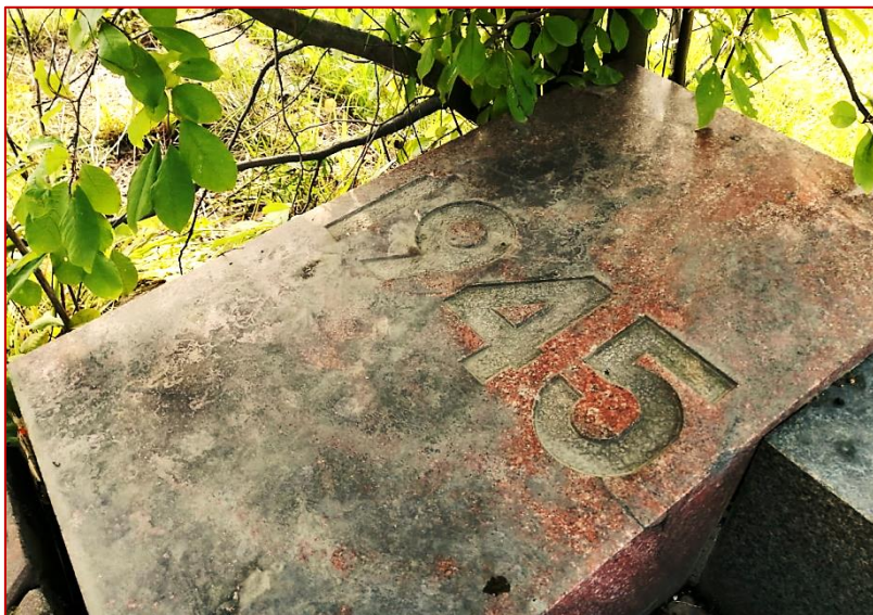
Рисунок 10. Мемориальная плита с надписью «1945», фото 2020 г.