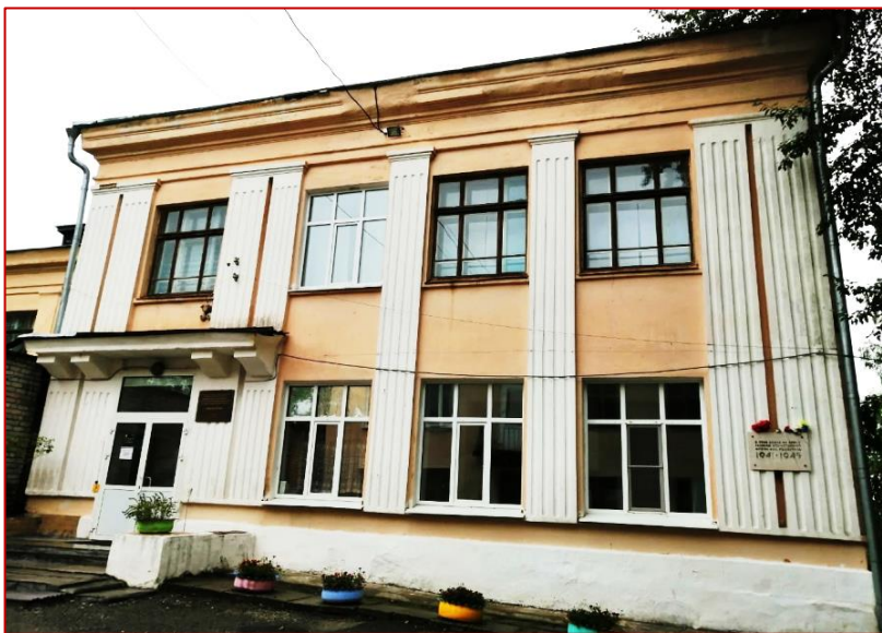
Рисунок 19. Бывшая школа № 42 г. Кушва, фото 2020 г. (сейчас – МАОУ СОШ № 10, здание 2)