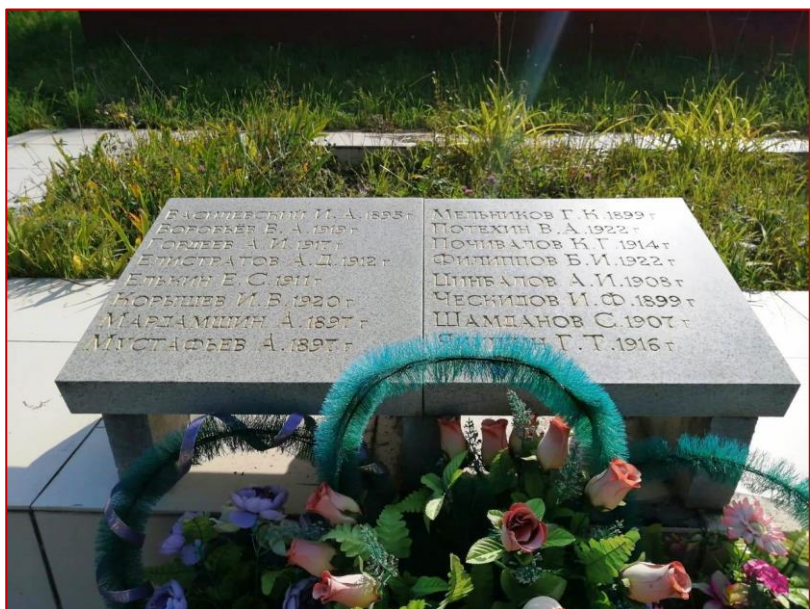
Рисунок 11. Мемориальная плита с фамилиями воинов, захороненных под мемориалом, фото 2020 г.