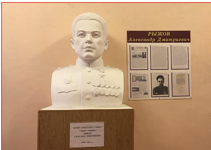
Рисунок 26. Бюст А. Д. Рыжову в Баранчинском электромеханическом техникуме (здание 2), фото 2020 г.