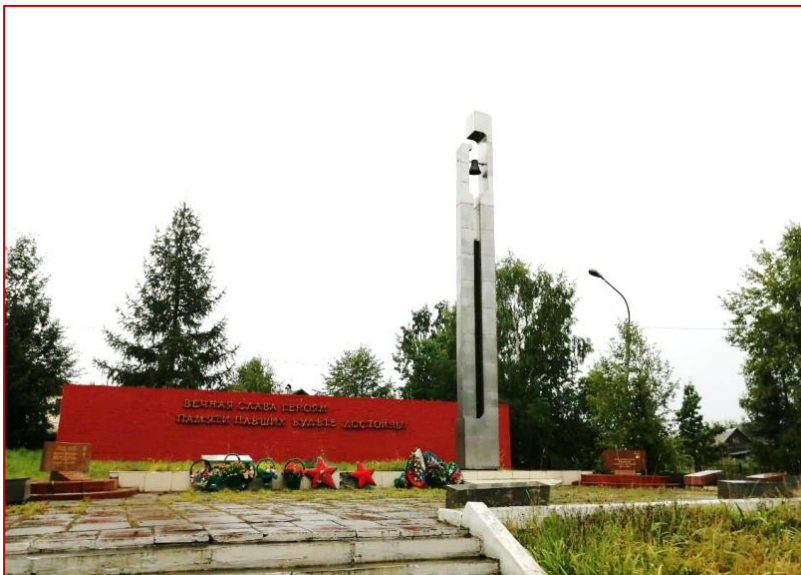
Рисунок 1. Мемориал «Воинам, умершим от ран в госпиталях города Кушва», фото 2020 г.