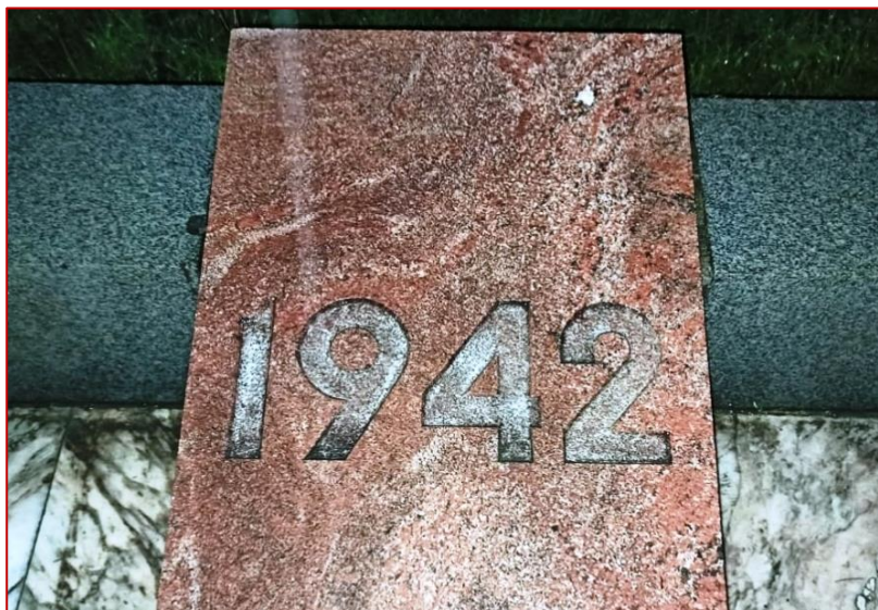
Рисунок 7. Мемориальная плита с надписью «1942», фото 2020 г.