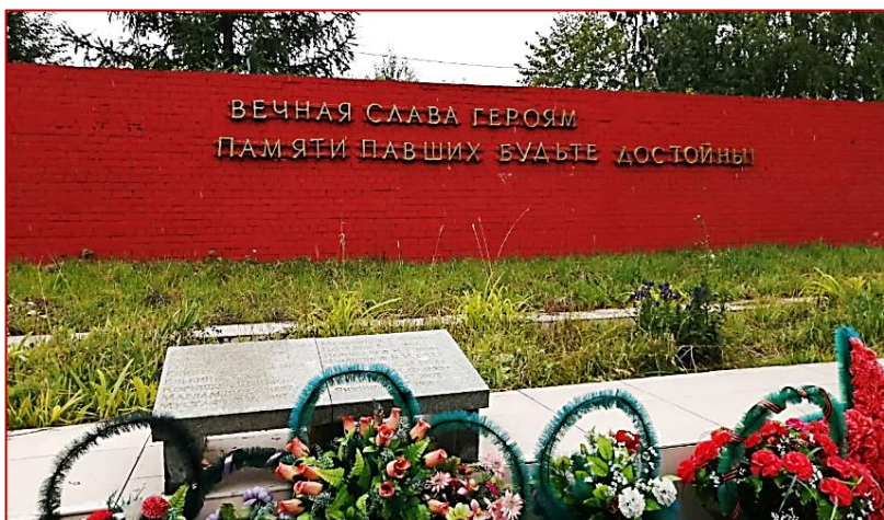
Рисунок 3. Надпись на мемориале «Воинам, умершим от ран в госпиталях города Кушва»: «Вечная слава героям, памяти павших будьте достойны!», фото 2020 г.