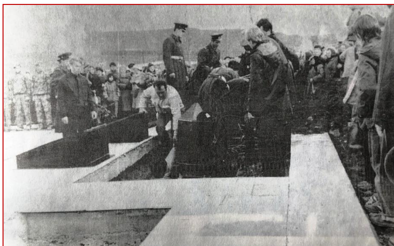
Рисунок 24. Перезахоронение праха воинов, умерших от ран в госпиталях города Кушва в 1941-1945 гг. (фото 1985 г.)