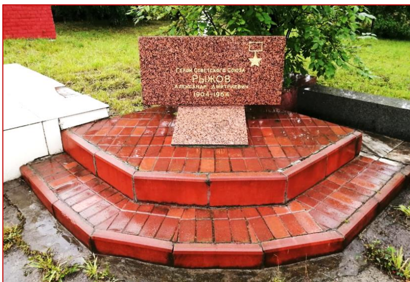
Рисунок 15. Мемориальная доска А. Д. Рыжову, фото 2020 г.