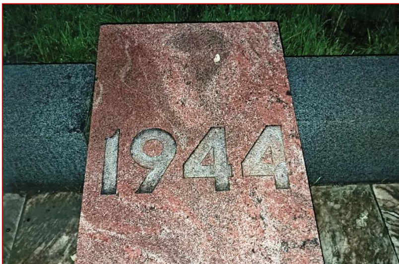
Рисунок 9. Мемориальная плита с надписью «1944», фото 2020 г.