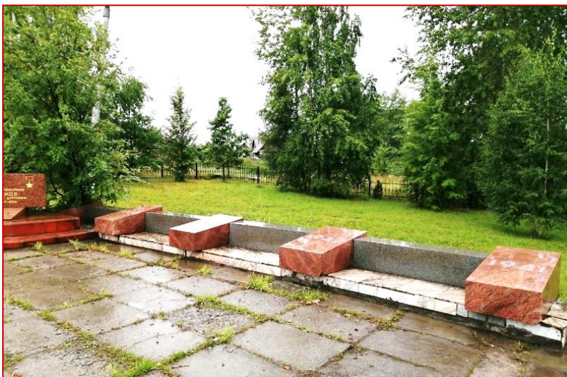
Рисунок 5. Мемориальные плиты с надписями годов Великой Отечественной войны 1941-1945 гг., фото 2020 г.