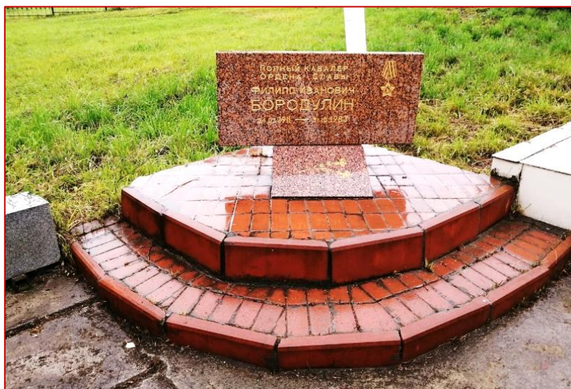
Рисунок 13. Мемориальная доска Ф. И. Бородулину, фото 2020 г.