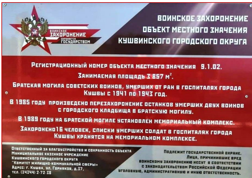
Рисунок 4. Табличка у входа на мемориал «Воинам, умершим от ран в госпиталях города Кушва», фото 2020 г.