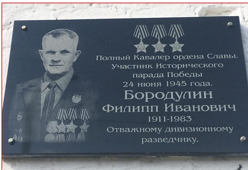
Рисунок 25. Мемориальная доска Ф. И. Бородулину на пожарной части г. Кушва, фото 2020 г.