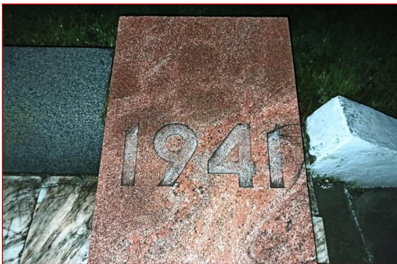
Рисунок 6. Мемориальная плита с надписью «1941», фото 2020 г.