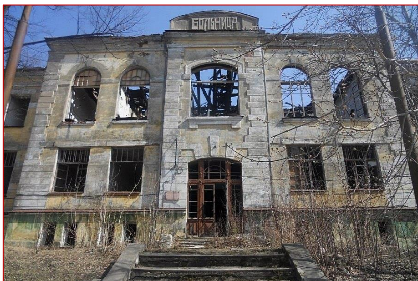
Рисунок 21. Бывшая центральная больница г. Кушва, фото 2018 г.