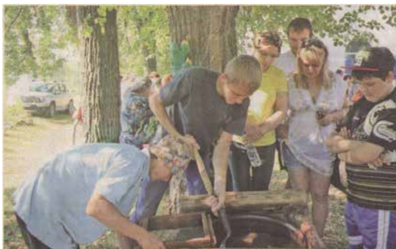
Вот он какой, Синюшкин колодец...

удаленность от густонаселенных центров. Многие оставляют благодарные отзывы в книге почетных посетителей. И в этом есть своя символика. Не ушла, значит, вместе со старыми людьми восторженная любовь к самоцветному камню. Живет она в