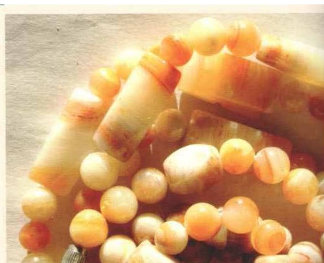
Бусы. Шайтанский переливт. «Мурзинка», 1994 г.

В конце 80-х - начале 90-х годов на местных коях прекратилась официальная добыча самоцветов. Но не потому, что они исчезли. По неофициальным данным, в конце тысячелетия вскрыты кварцевые жилы на разноцветный горный хрусталь, аметист, цитрины. В окрестностях Мурзинки имеется месторождение графита. Если найти инвестиции, то природная