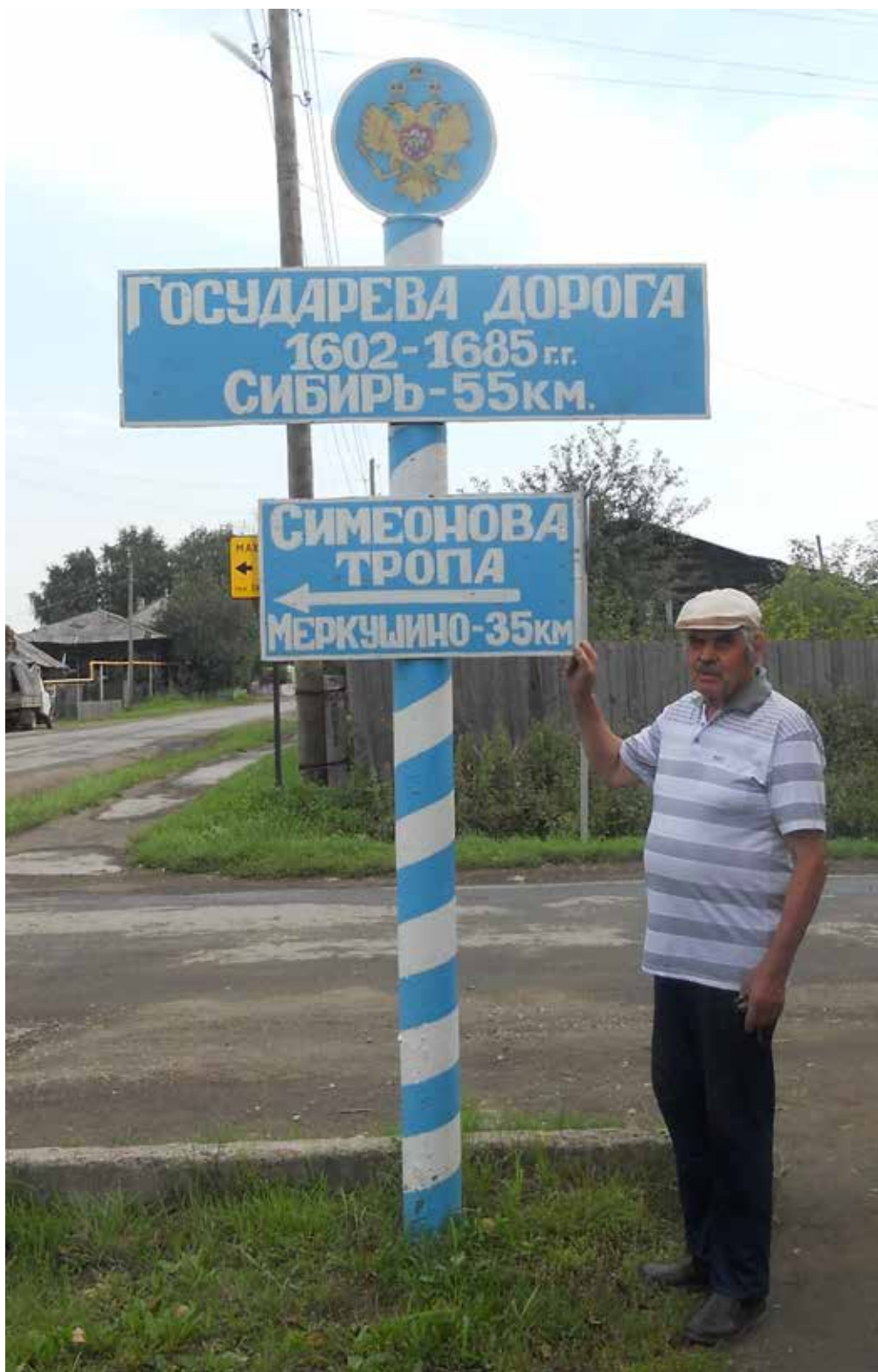
Рисунок 6 Установка указателя на Симеонову тропу