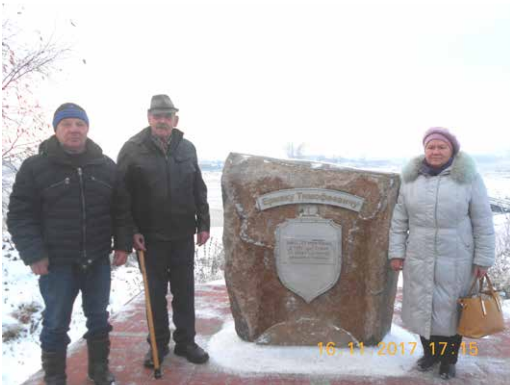
Рисунок 5Тот самый камень Ермаку