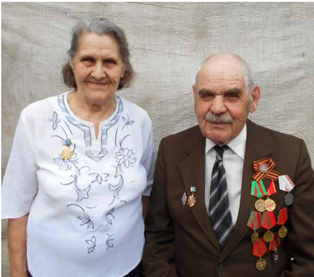
Рисунок 7 Черемисины в 2015 году