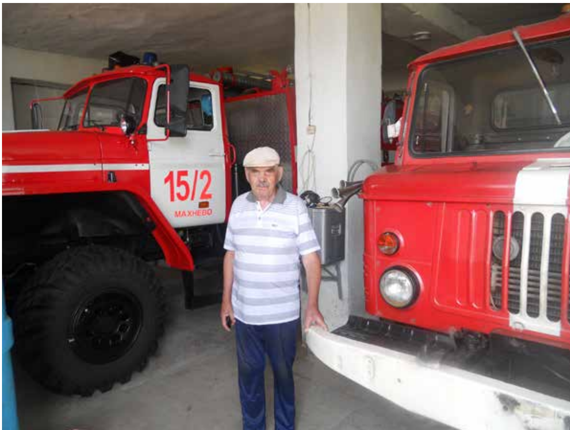
Рисунок 2Доброволец на посту