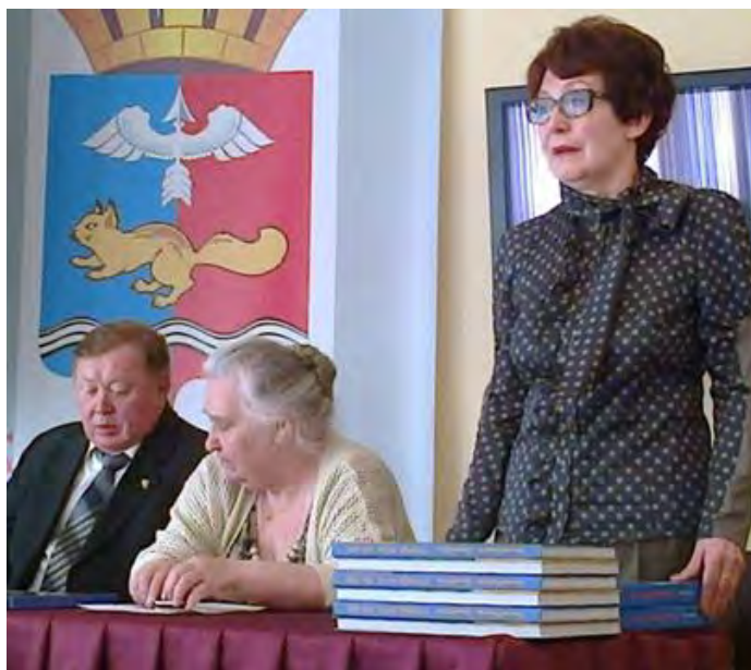
На презентации в Краснотурьинском краеведческом музее.