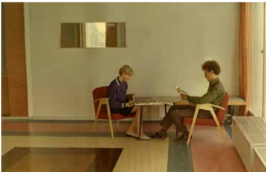
Холл у входа в артистические. 1969 год.