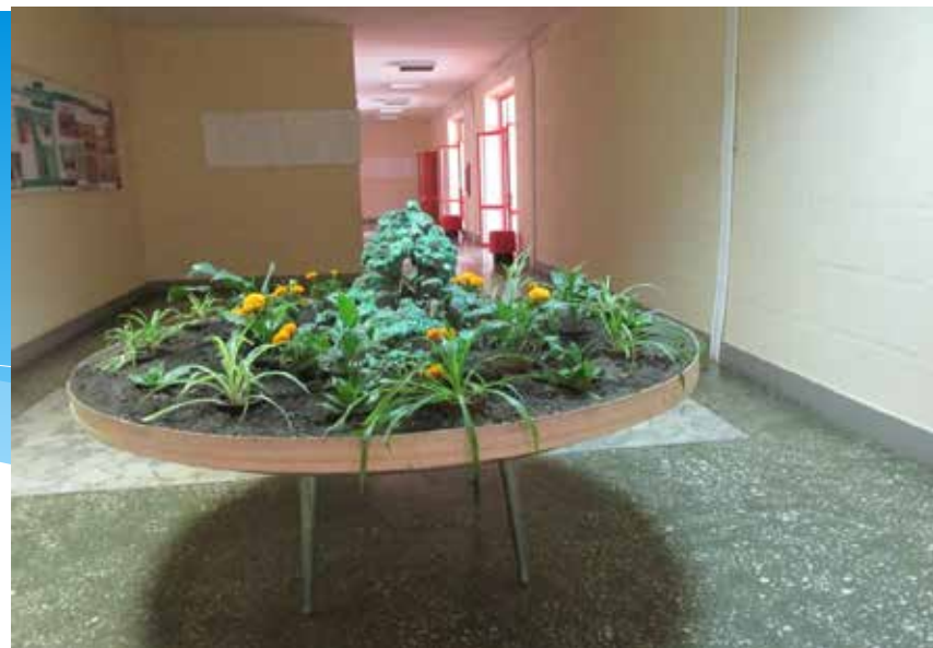
Там же. 2014 год.