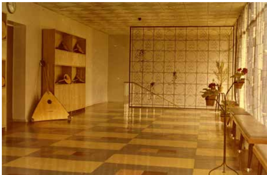
Зал для занятий оркестра народных инструментов. 1969 год.