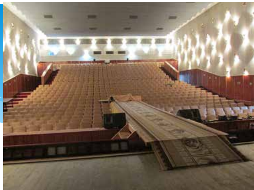
Там же. 2014 год.