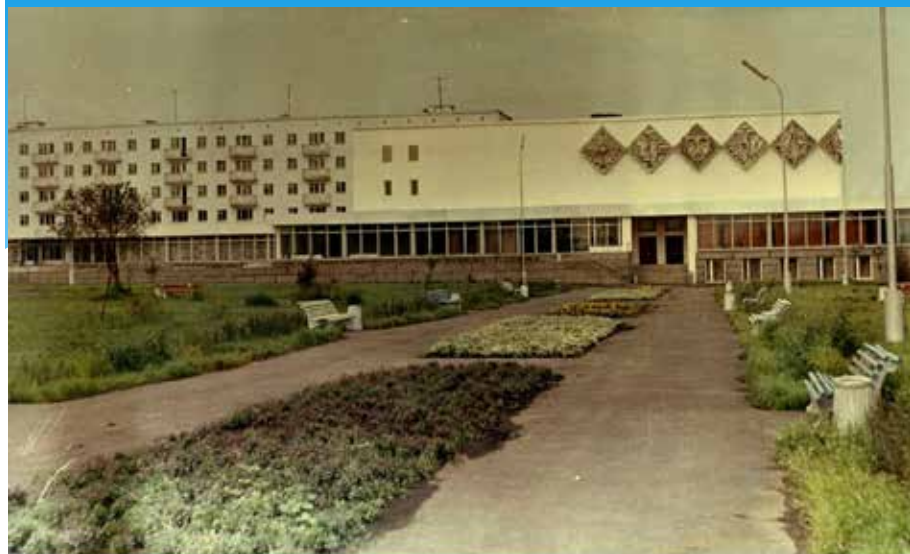
ДК со стороны сквера. 1969 год.