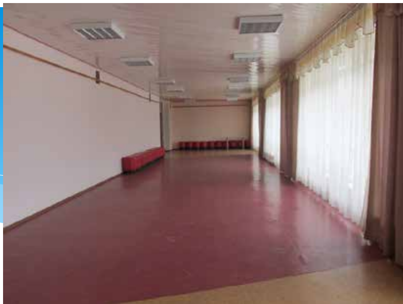
Гостиная. 2014 год.