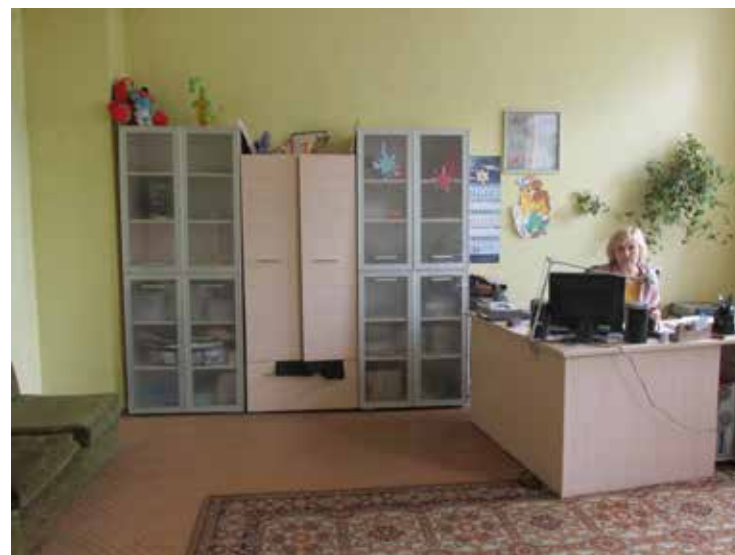
Кабинет заведующей детским сектором 2014 год.