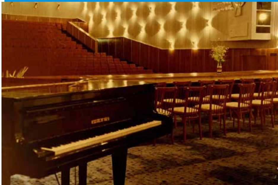
Зрительный зал на 675 мест со сцены. 1969 год