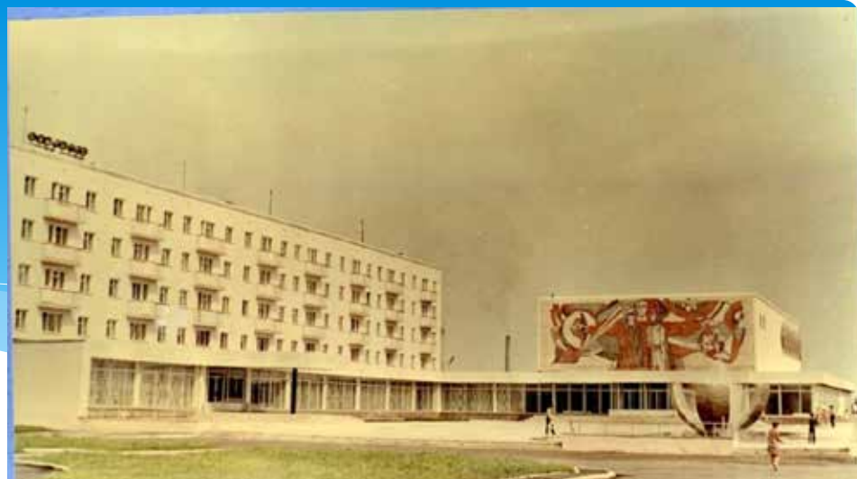
Дворец культуры «Металлург» в 1969 году