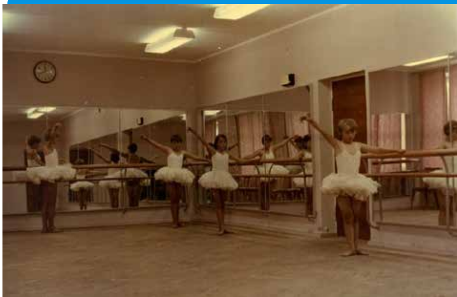
Балетный класс. 1969 год