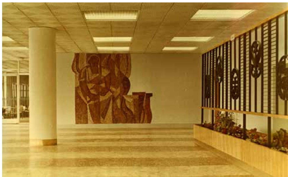
Вестибюль со стороны кафе. 1969 год.