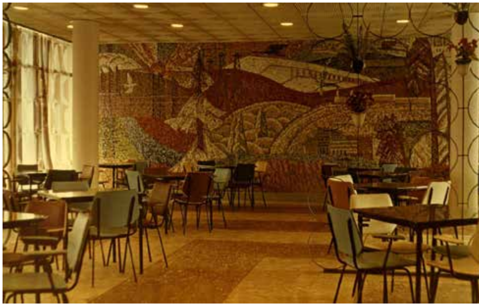
Кафе. 1969 год.