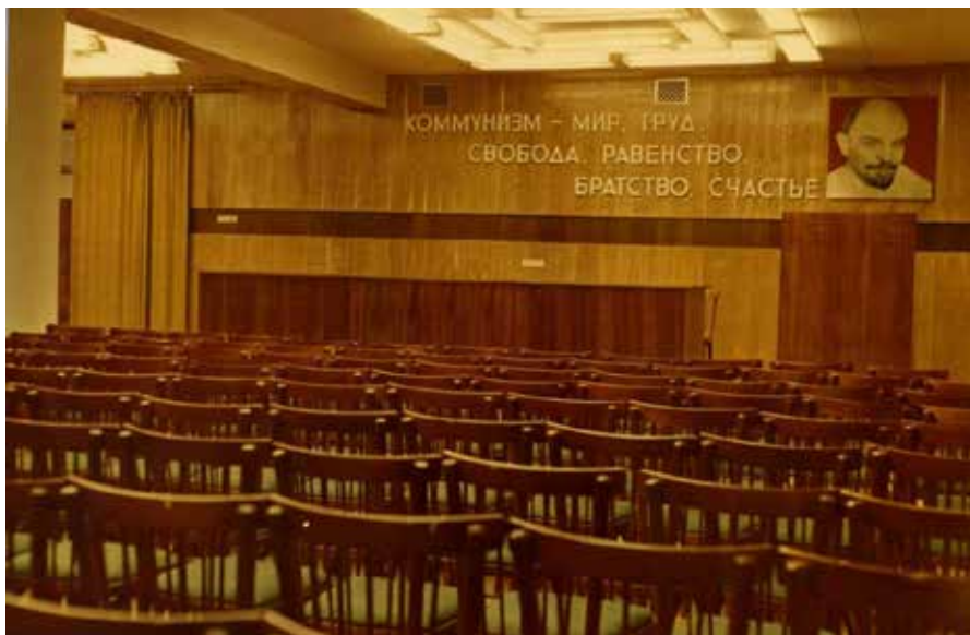
Конференц-зал на 250 мест. 1969 год.