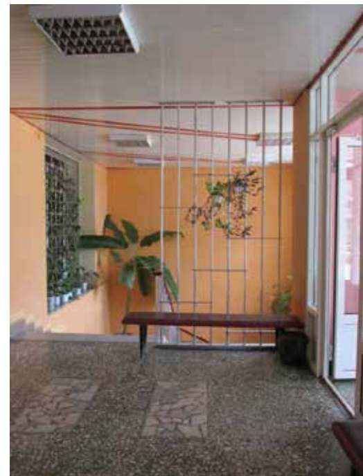
Там же. 2014 год.