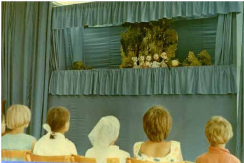
Кукольный театр. 1969 год.