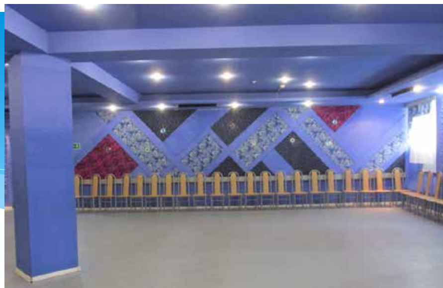
Малый зал. 2014 год.