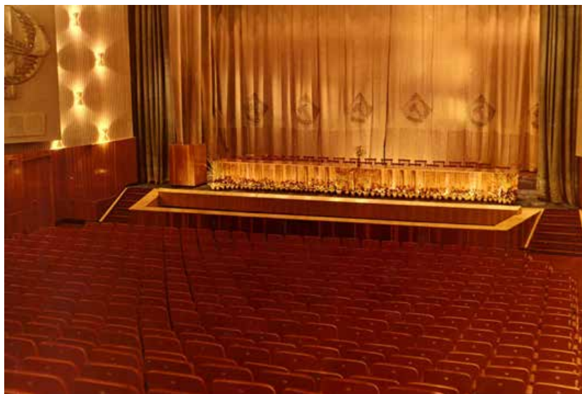
Зрительный зал на 675 мест из зала. 1969 год.