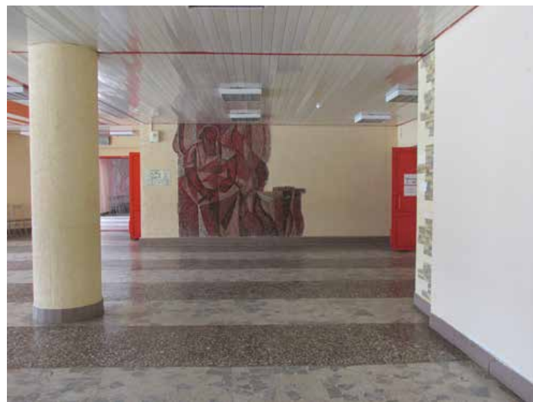
Там же. 2014 год.