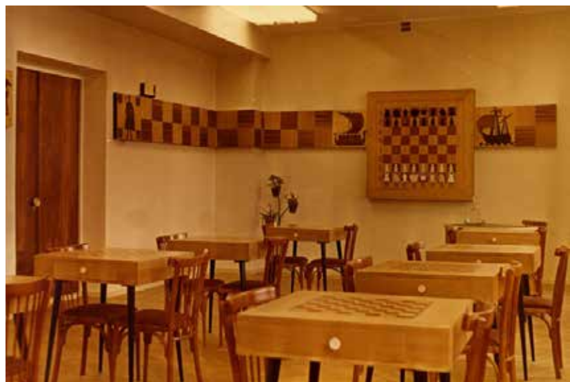
Шахматный клуб. 1969 год.