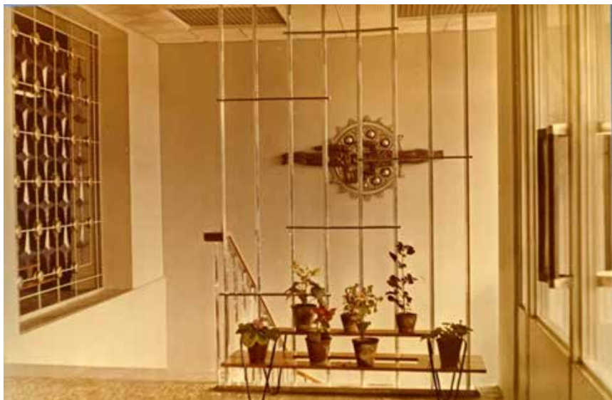
Интерьер у одной из лестниц. 1969 год.