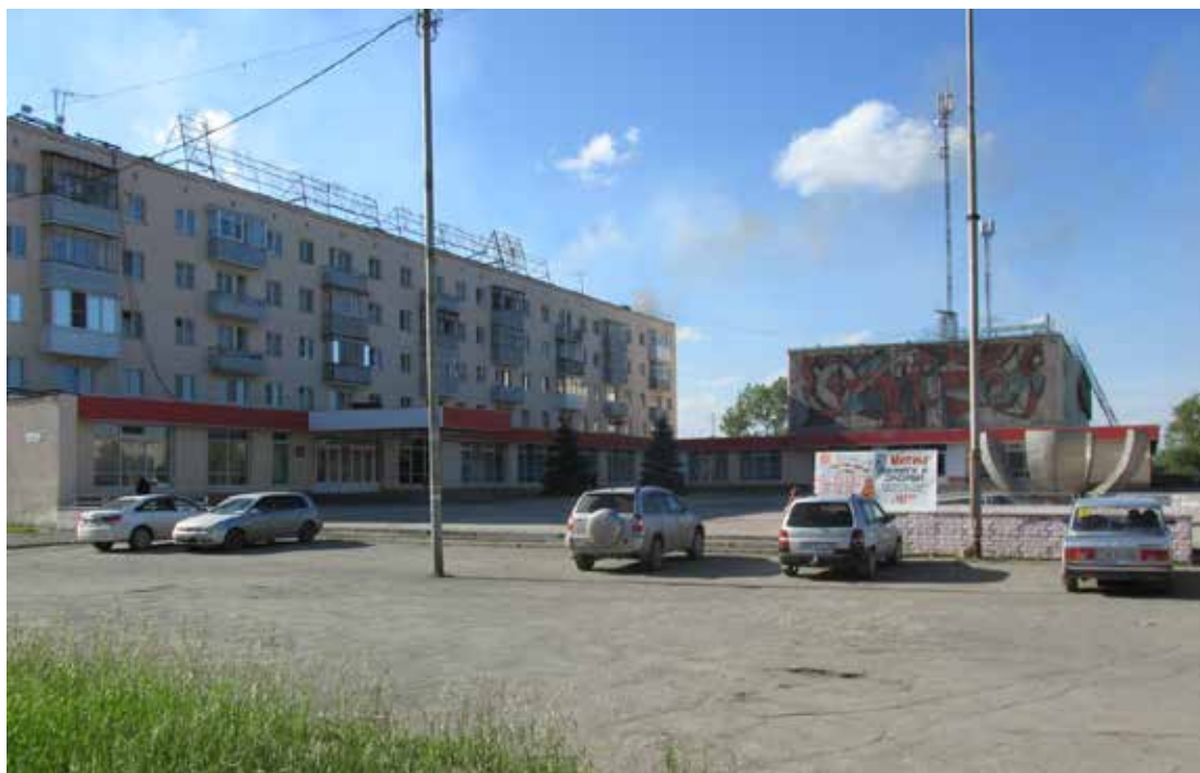
И в 2014 году