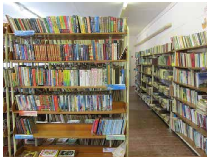
Абонемент библиотеки. 2014 год.