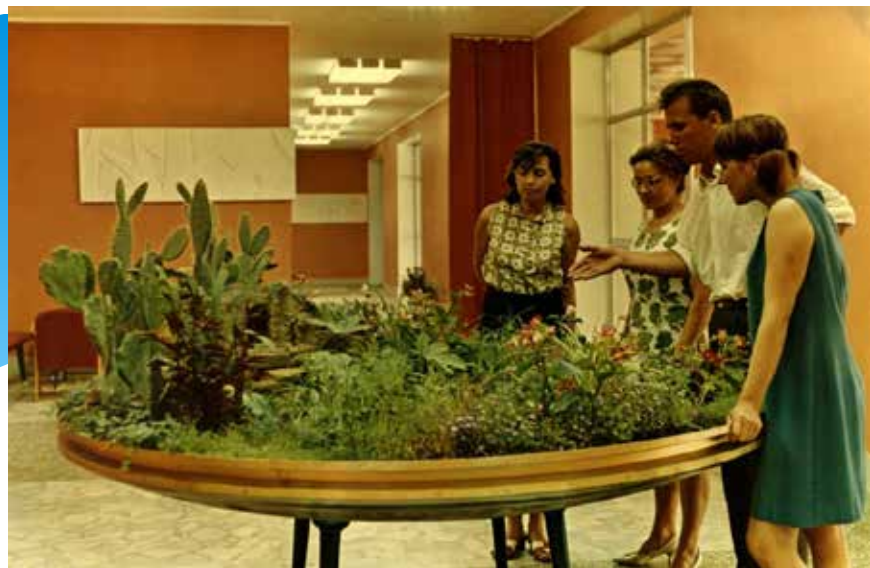
Один из холлов дворца. 1969 год.