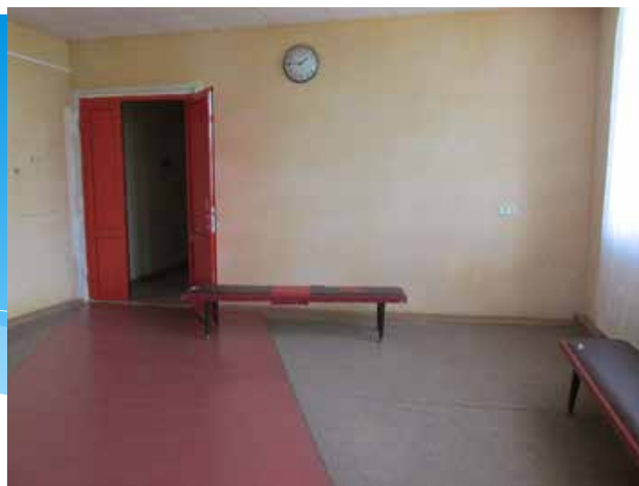
Там же. 2014 год.