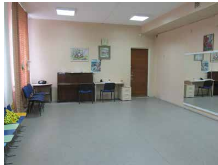
Там же. 2014 год.