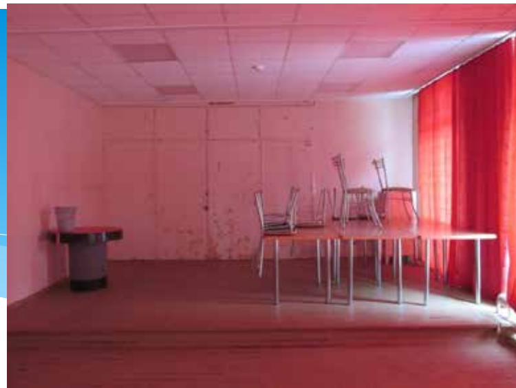
Там же. 2014 год.