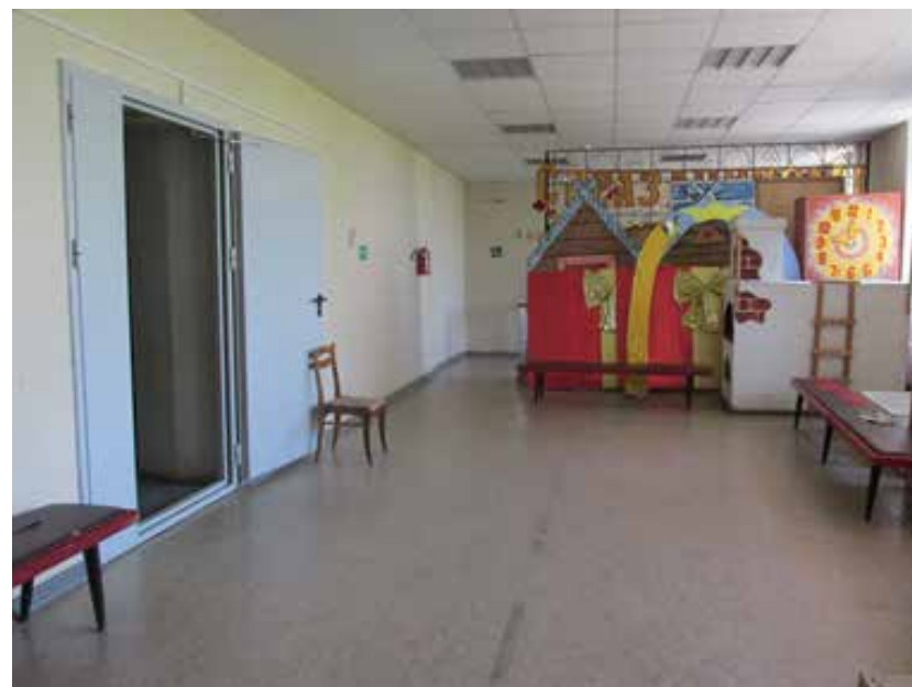
Там же. 2014 год.