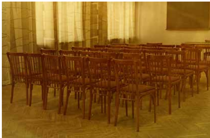
Зал оркестра духовых инструментов. 1969 год.