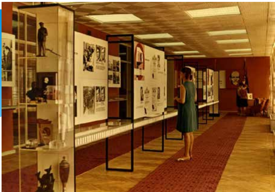
Зал трудовой славы. 1969 год.