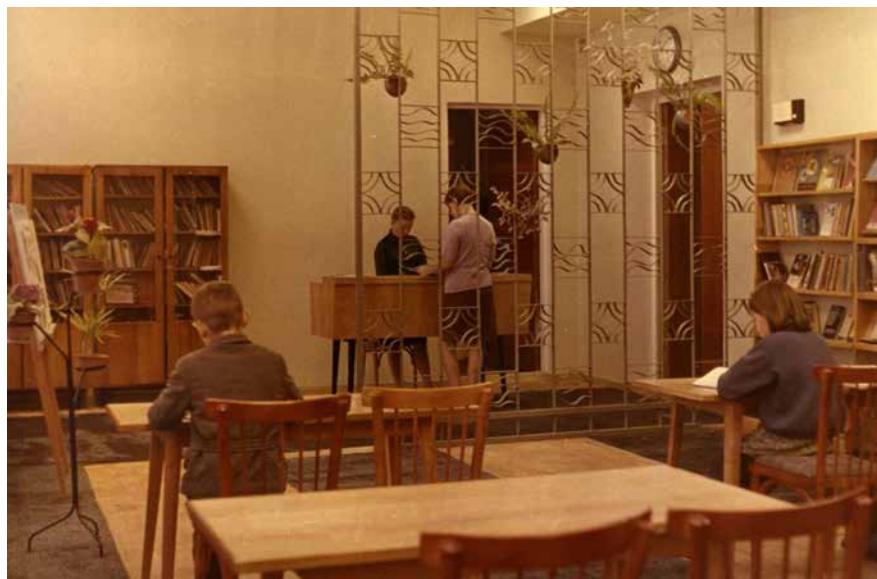
Детская библиотека. 1969 год.