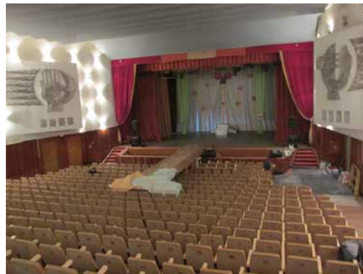
Там же. 2014 год.