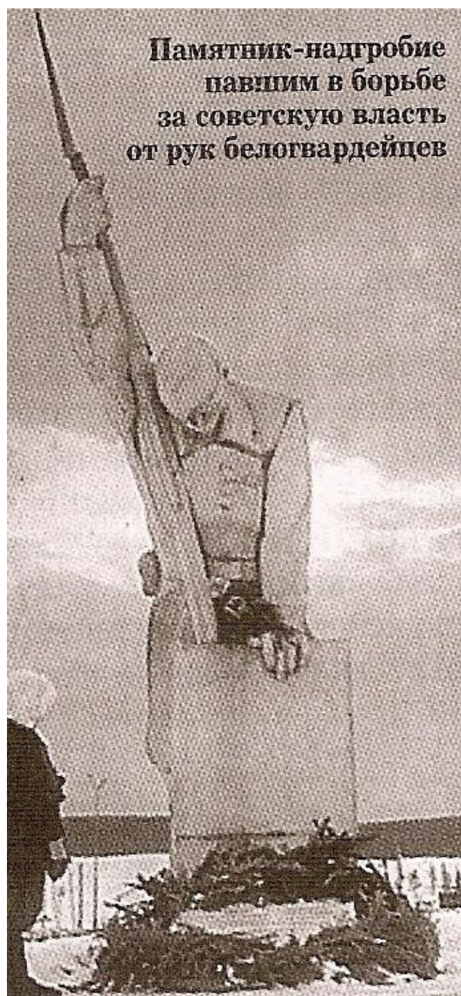
Памятник-надгробие павшим в борьбе за советскую власть от рук белогвардейцев

Колчаковцы не встретили сопротивления местных жителей. На то были причины. Всего три месяца тому назад, когда сложилась на Урале неблагоприятная обстановка для Красной Армии, здесь началось формирование добровольческих отрядов. Коммунисты и многие беспартийные рабочие Северного Урала тоже вливались в них и уходили защищать Совет-