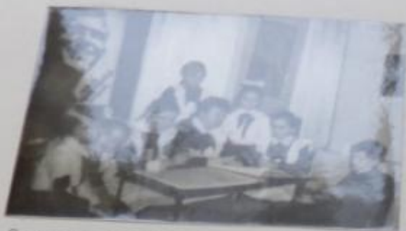
Музей И.М.Аввакумова Центр эстетического, военно-патриотического и нравственного воспитания традиций школ города

В музее юные экскурсоводы проводят экскурсии обзорные и тематические: „Здесь прошло детство художника“, „Комсомолец Ленинского призыва“, „Певец Магнитки“, „От картин веет порохом“, „Это не должно повториться!“, „Художники в борьбе за мир“, „Творчество асбестовских худож- ников“, „Две музы И.М.Аввакумова“.