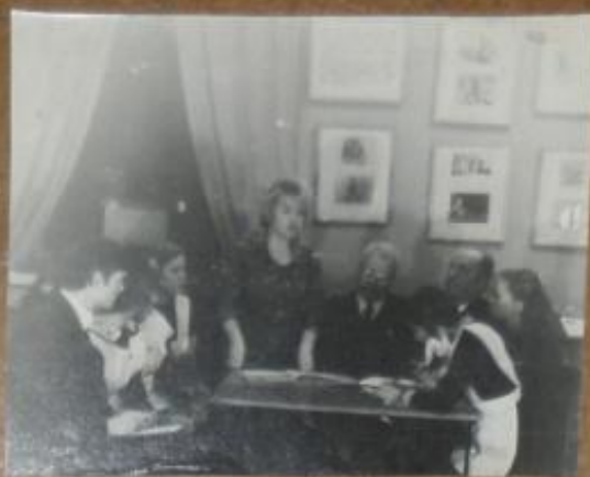
Заседание совета музея.