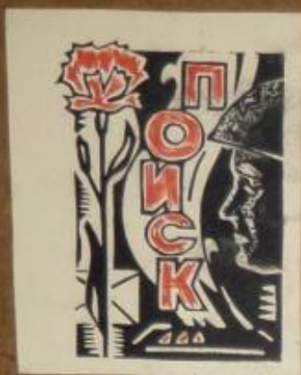
Эмблема клуба "Поиск"