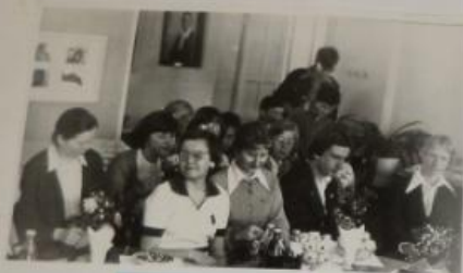
Встреча аввакумовцев в музее 1978 г.