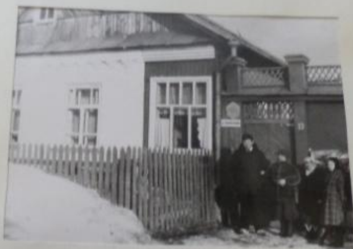
У ДОМА В. И. САННИКОВА