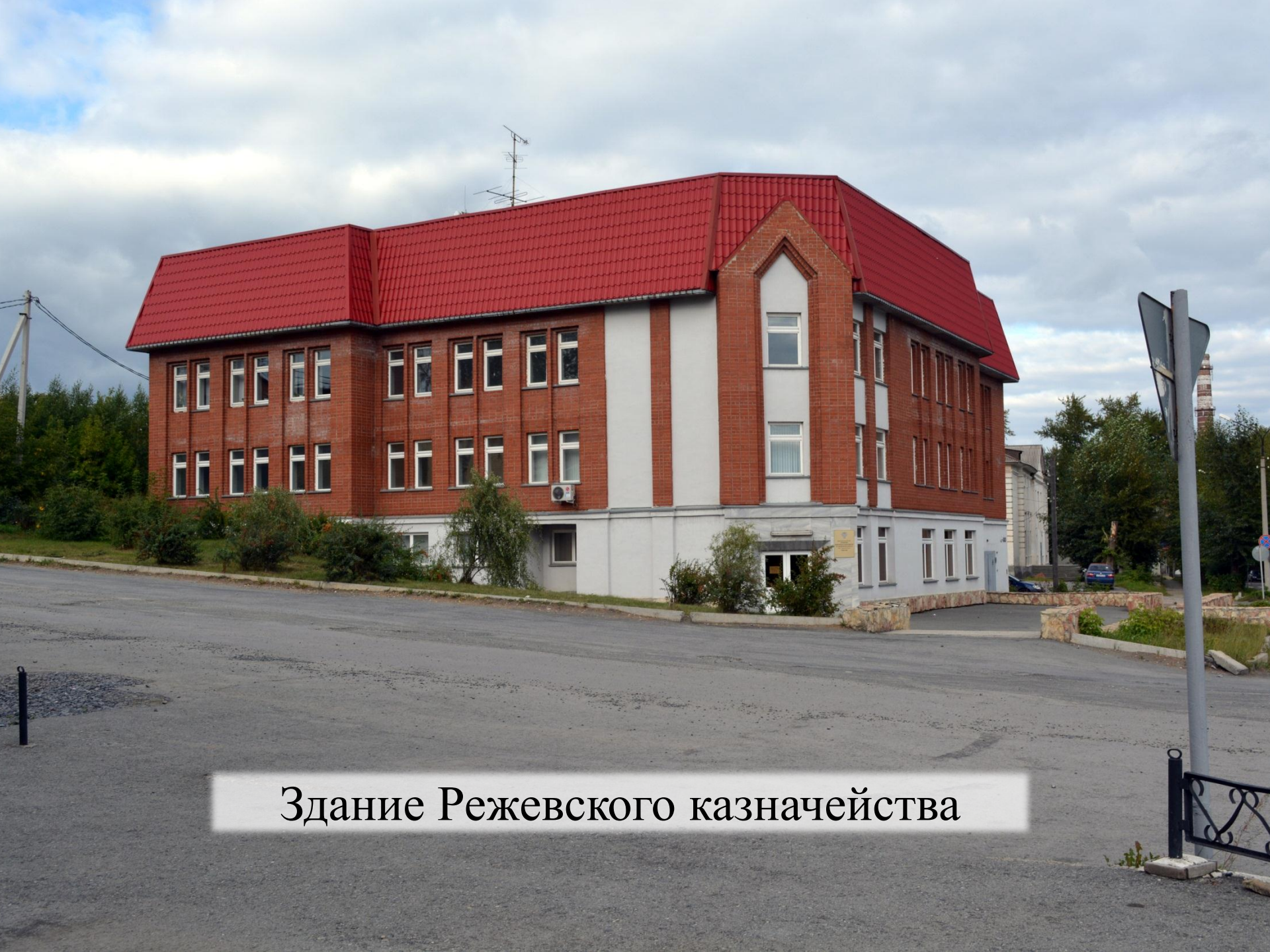
Здание Режевского казначейства