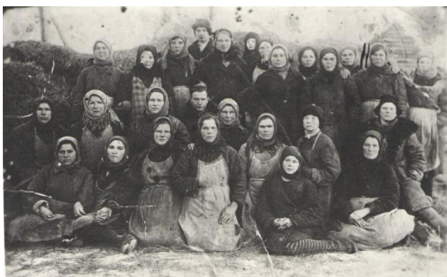
1931 год. Бригада колхоза им. Будённого