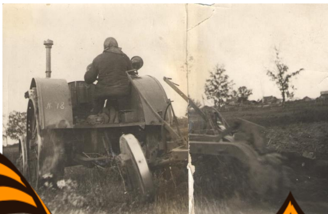
Один из первых тракторов 1937 год.

- Будем строиться, народ весь перетянем, - убеждено говорил он крестьянам.