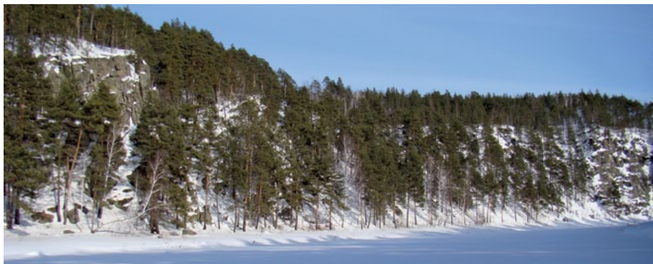
■ Скальная гряда с Исаковской писаницей, 2010 год