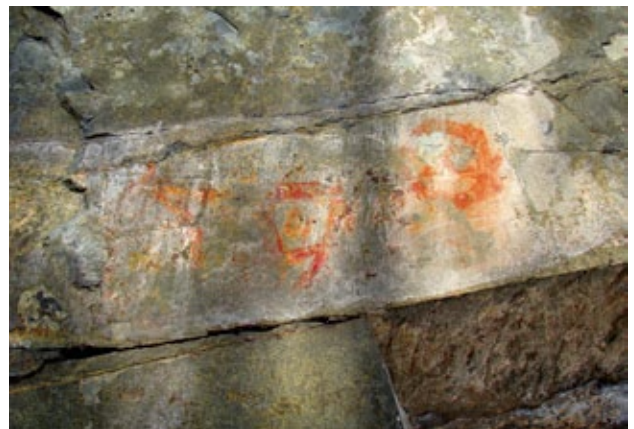
■ Фигура условно-антропоморфного существа и геометрический мотив в виде сетки, 2010 год