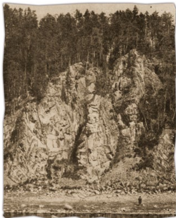
■ Скала с писаницей в 1914 году