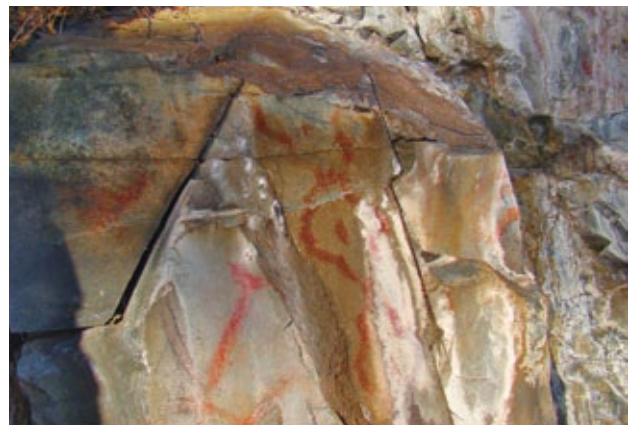
■ Геометрические фигуры в левой части панно, 2010 год