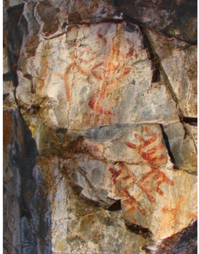
■ Фигура условно-антропоморфного существа и геометрический мотив в виде сетки, 2010 год

Еще один пункт с фрагментами древних изображений был найден исследователями на левобережной скале реки Реж у деревни Исакова. Здесь можно разобрать остатки линий и пятна краски бледно красного цвета. Плохая сохранность этого панно не позволяет выделить здесь какие-либо фигуры. Эти фрагменты рисунков получили название Исаковской II писаницы.