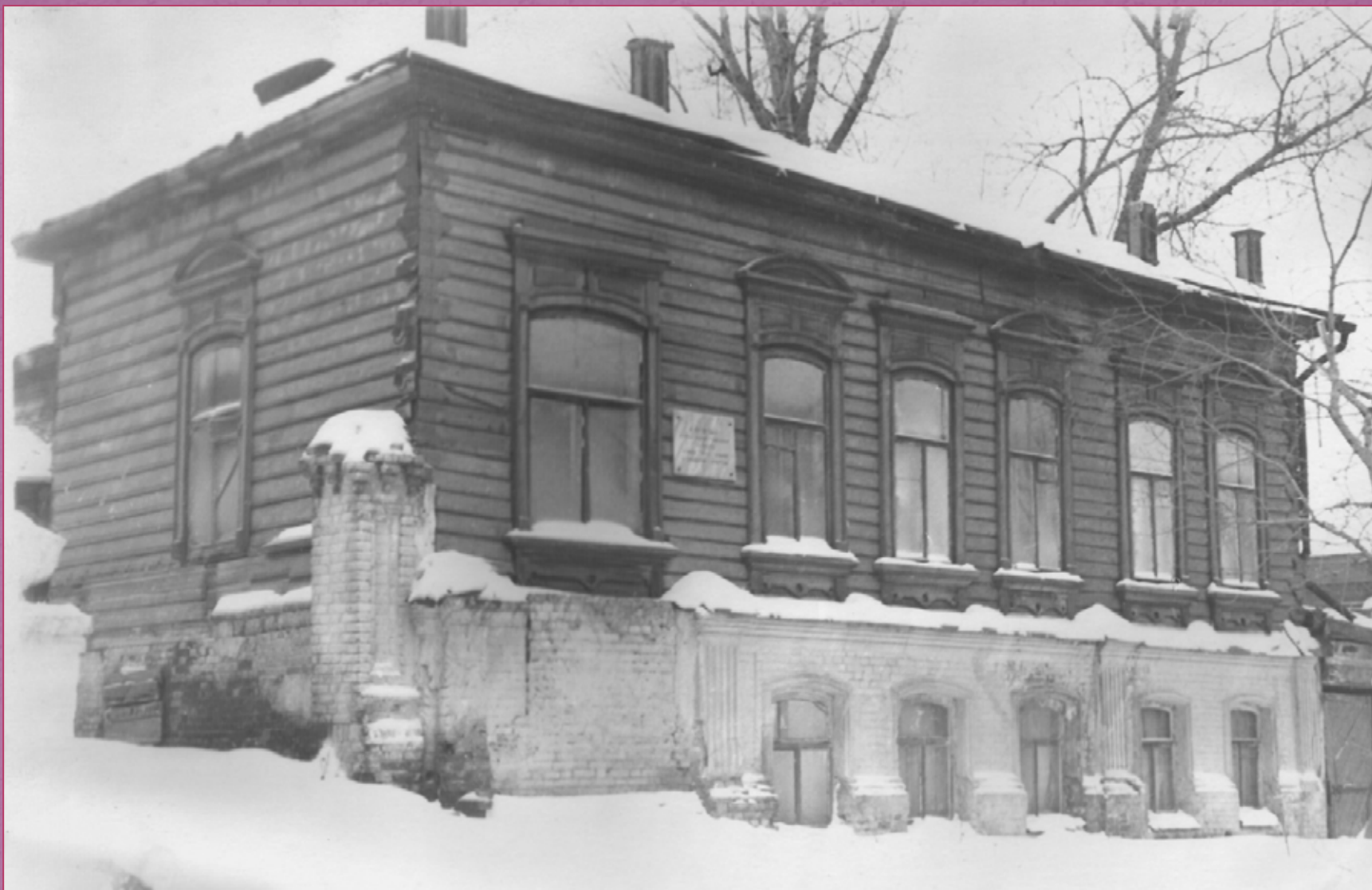
Детская библиотека Кушвы на улице Первомайская, 1937 год