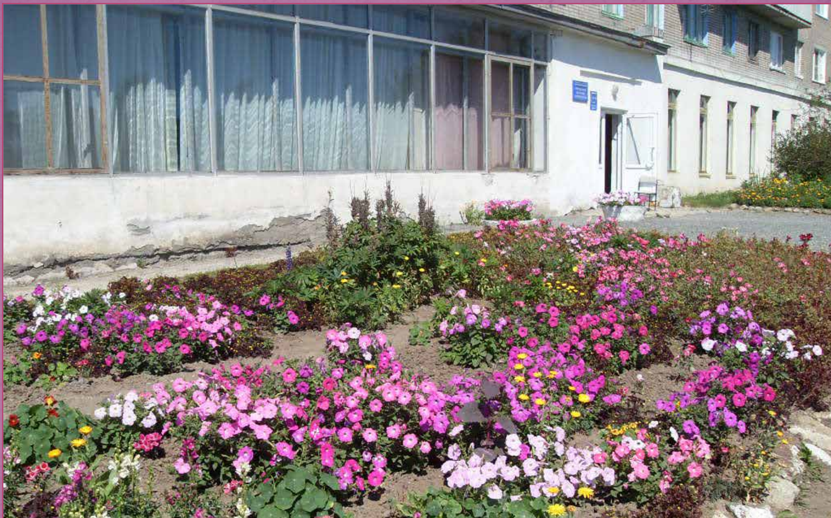
Городская детская библиотека Кушвы на улице Луначарского, д. 10, 2014 год