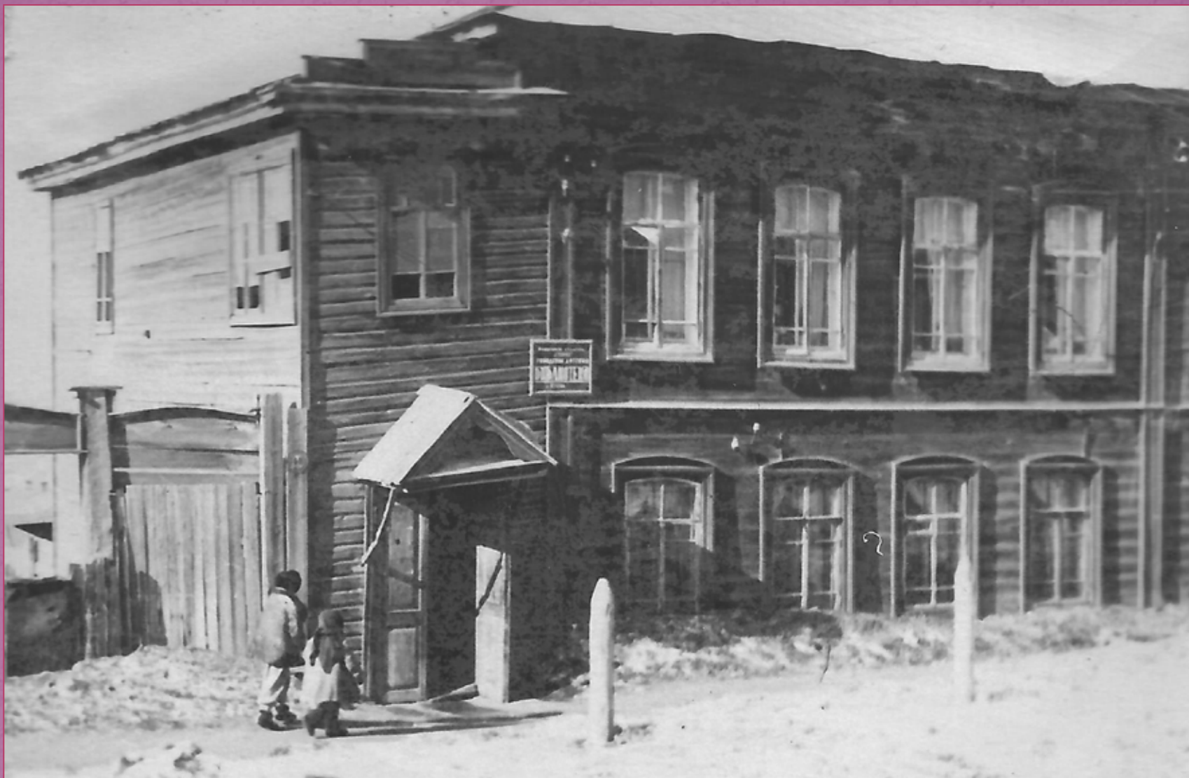
Детская библиотека Кушвы на улице Коммуны, д. 71, 1954 год