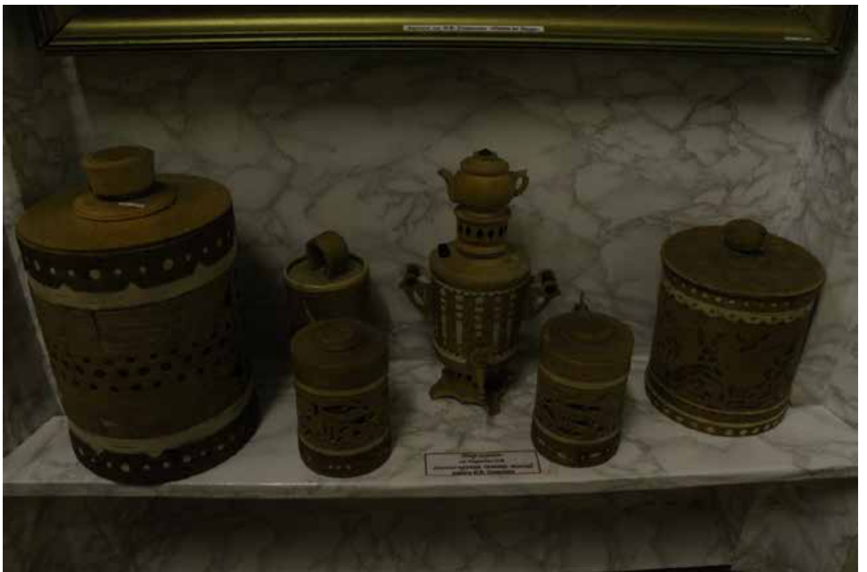
И. Ф. Соколов. Пивные кружки, самовар, туески.