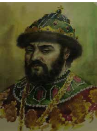
Иван V Алексеевич