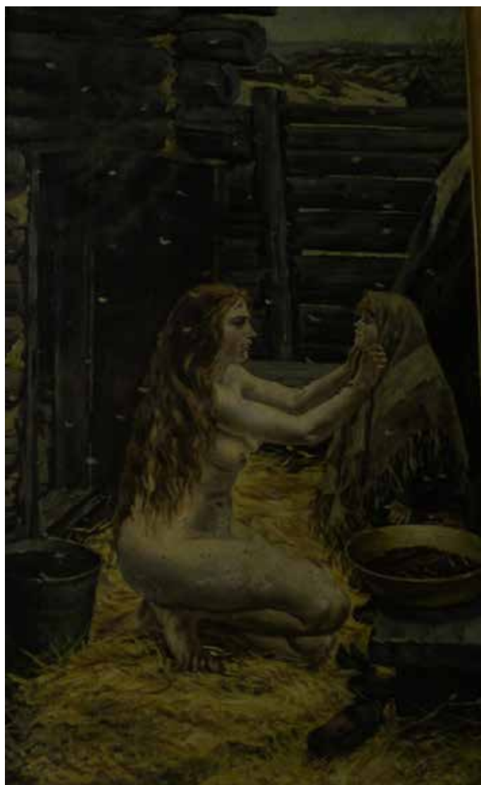
Художник Пластов Весна в бане