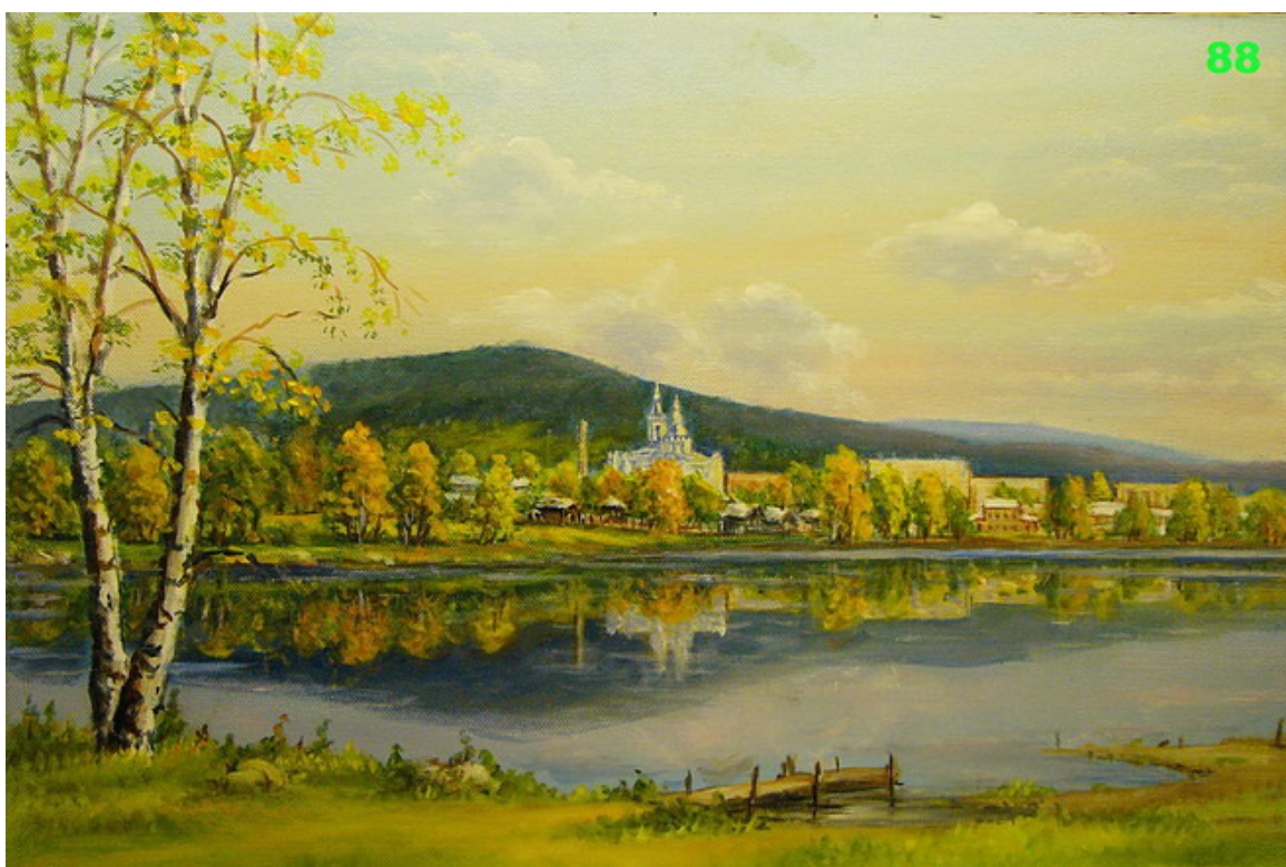
«Золотая осень» 2011г.