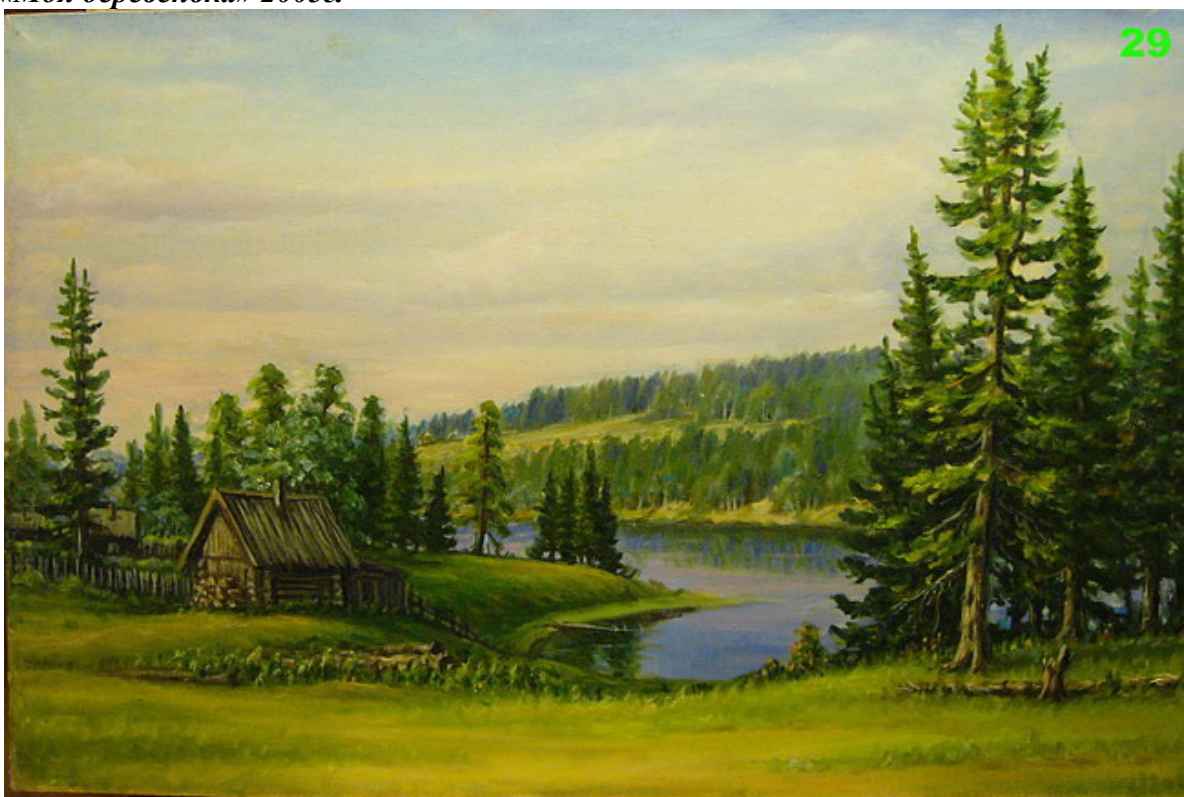
«Моя деревенька» 2003г.