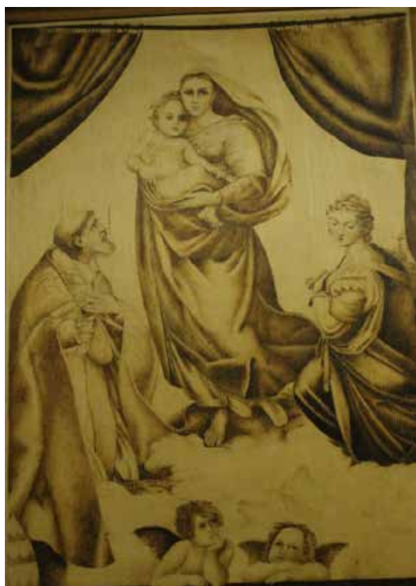
Репродукция. Сикстинская Мадонна