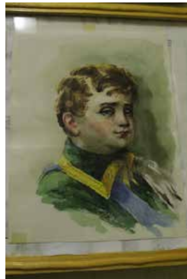
Иван VI Антонович