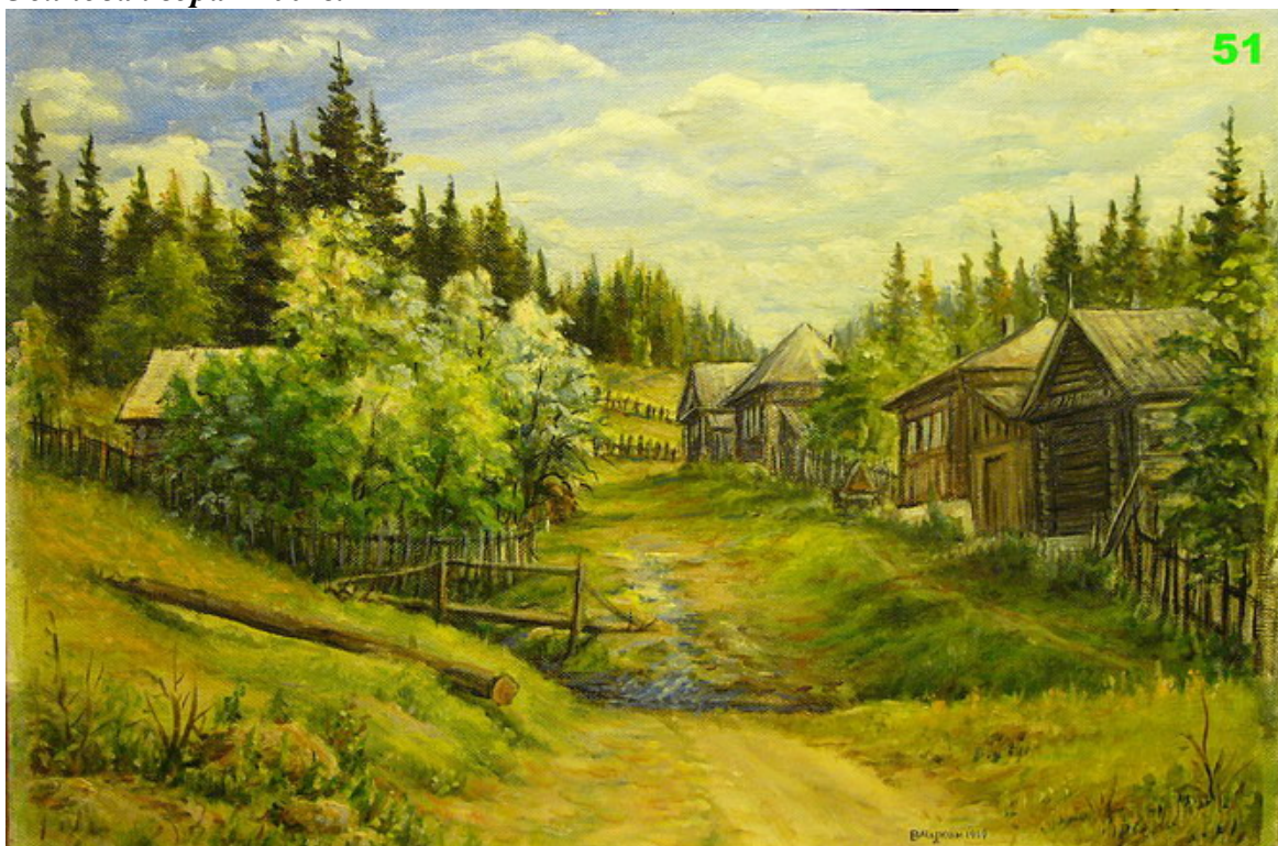
«Осиновая гора» 2004г.