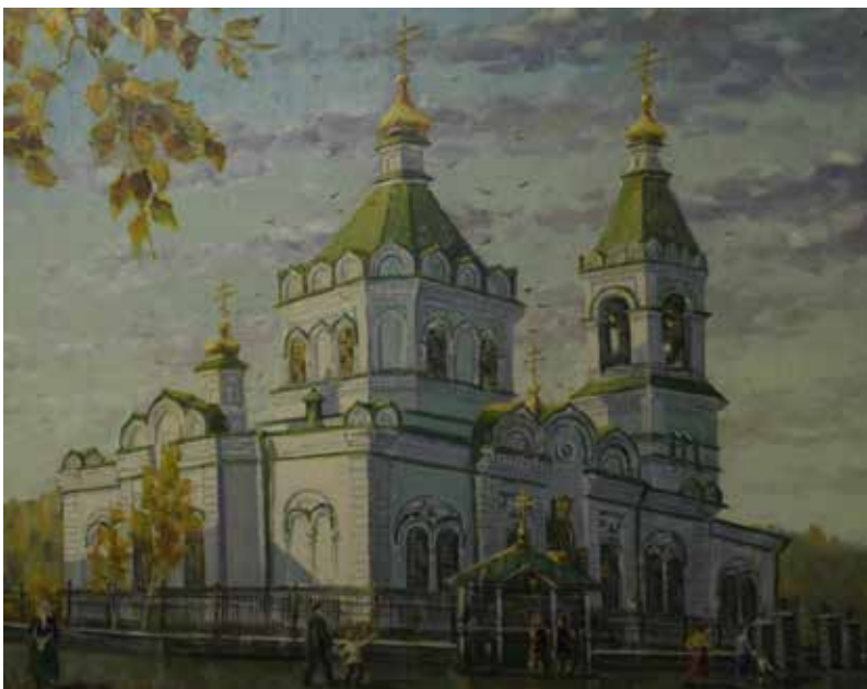
Введенская церковь поселка Верхние Серги