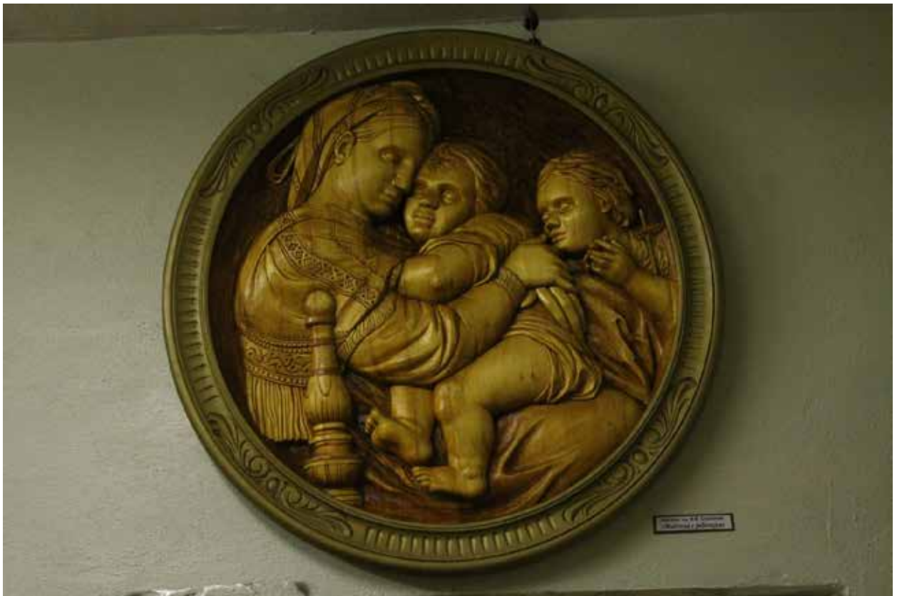
Картина И.Ф. Соколова «Мадонна с ребенком»