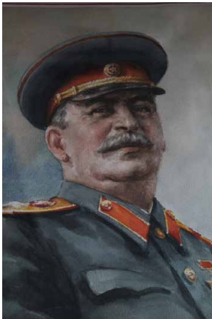
Портрет И. В. Сталина