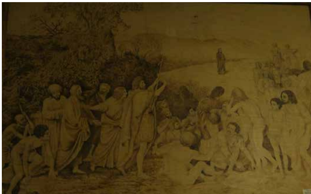
Репродукция. Явление Христа народу