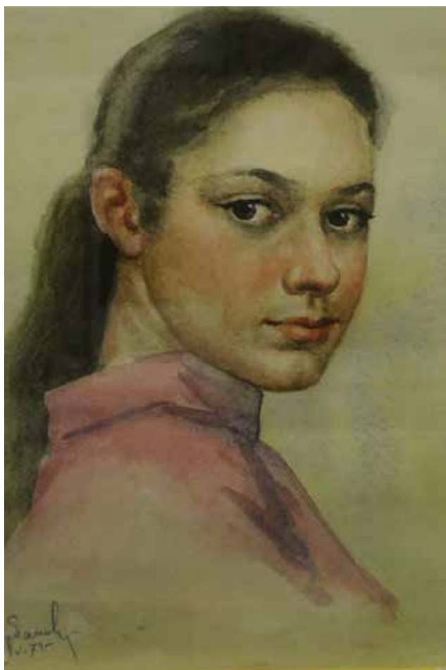
Портрет старшей дочери