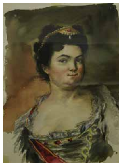
Екатерина I Алексеевна