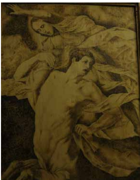
Репродукция. Кентавр, похищающий Диану.