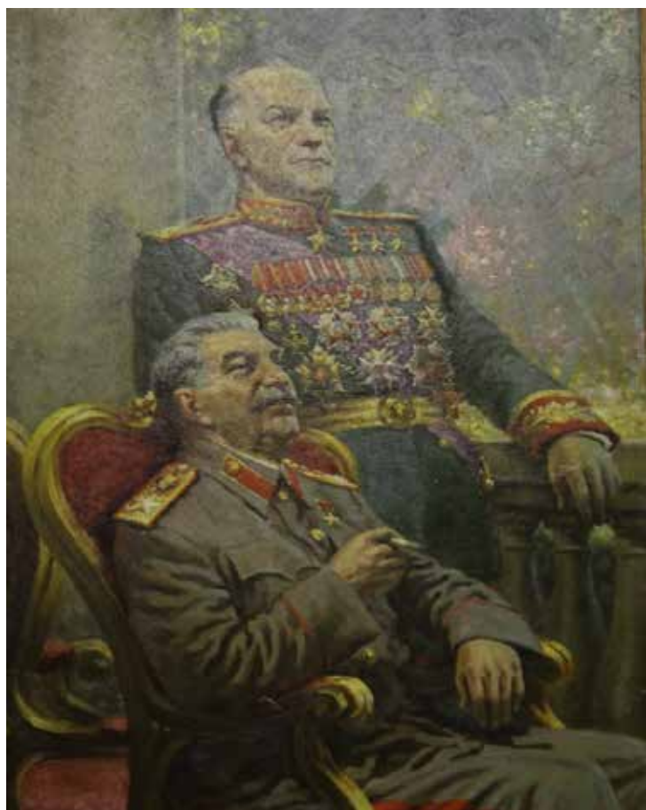
Салют Победы Иосиф Сталин и Георгий Жуков