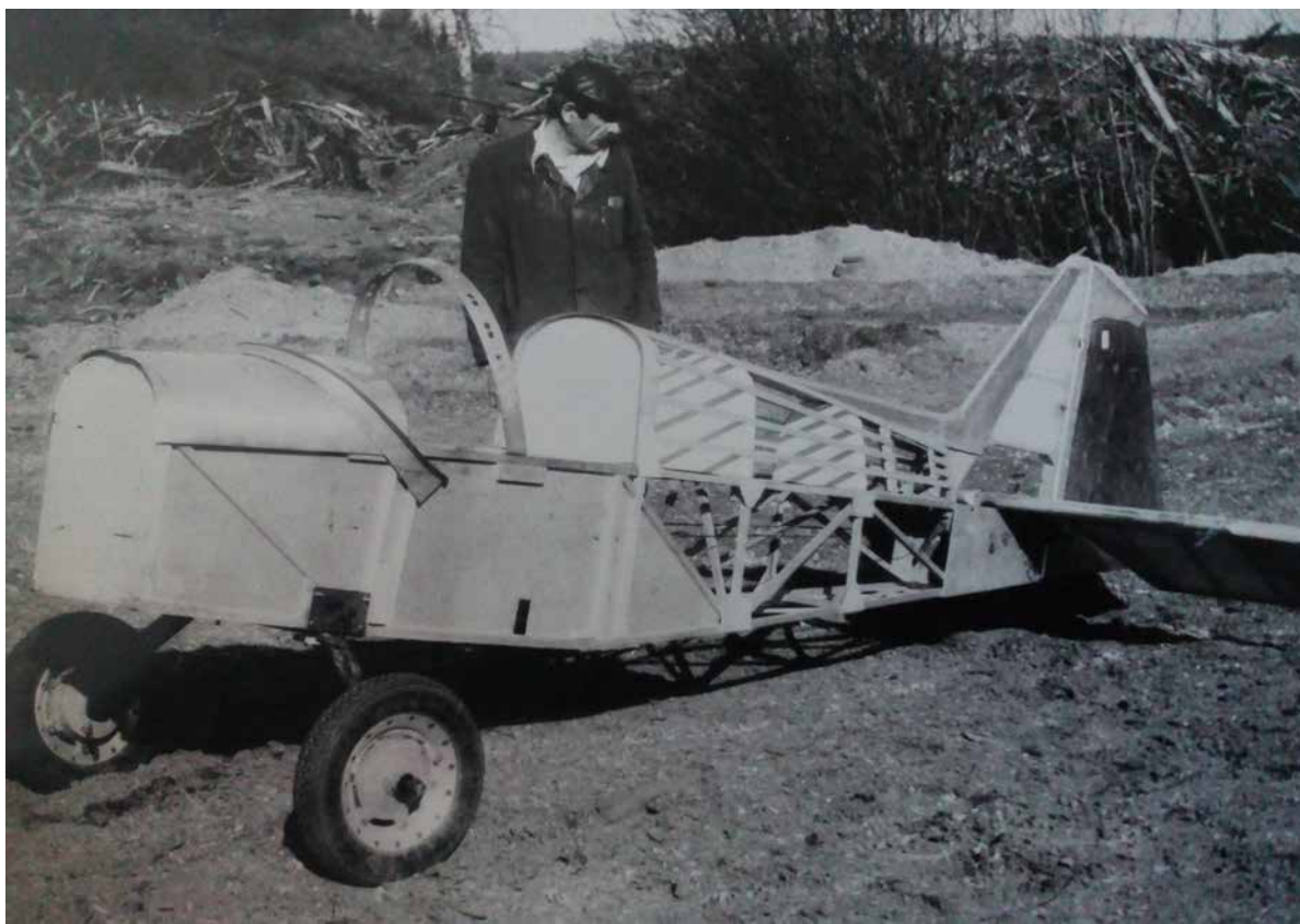
Самолет, сделанный своими руками.