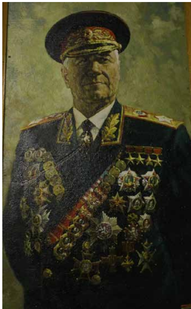
Маршал Советского Союза Жуков Георгий Константинович