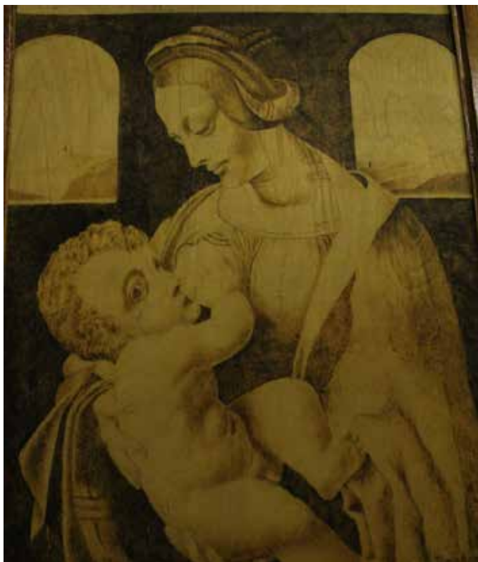
Репродукция. Мадонна с младенцем.