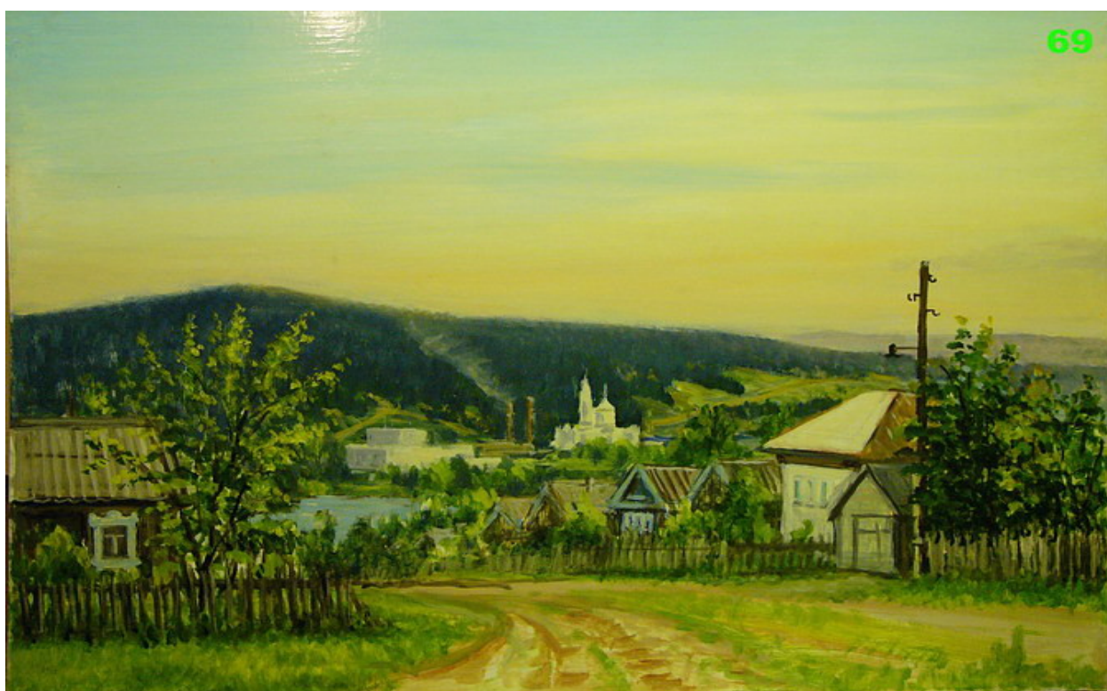
«За прудом» 2006г.