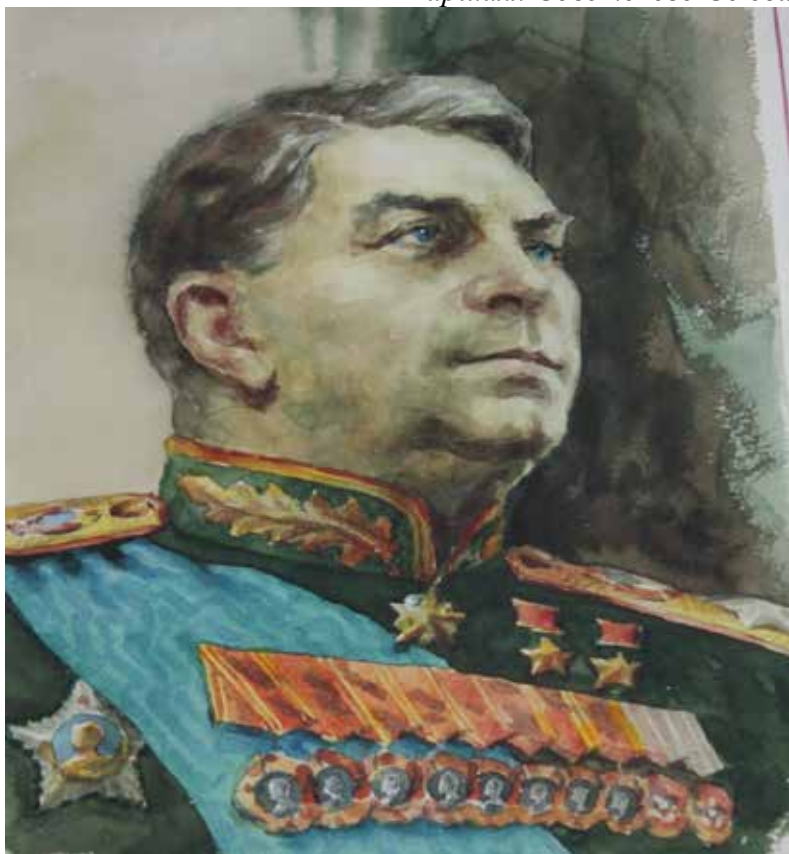
Маршал СССР А. М. Василевский