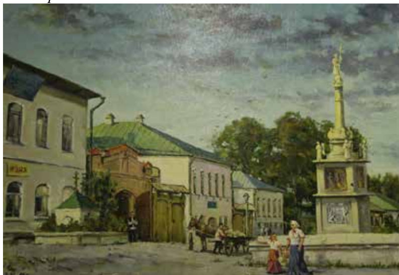
Центр поселка Верхние Серги в 1900 году