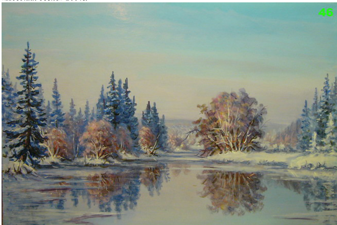
«Поздняя осень» 2004г.