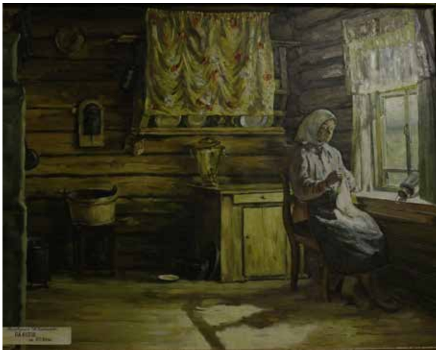
Художник Кугач На кухне