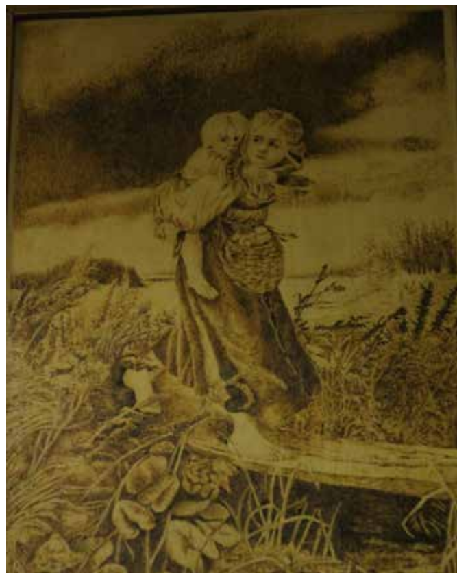
Репродукция. Дети, бегущие от грозы