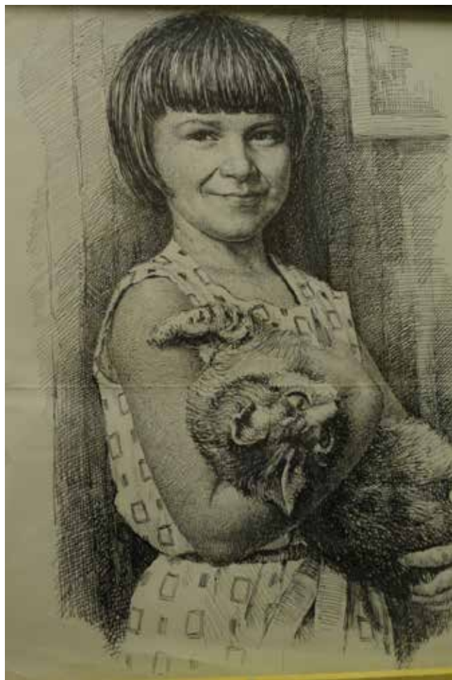
Портрет младшей дочери