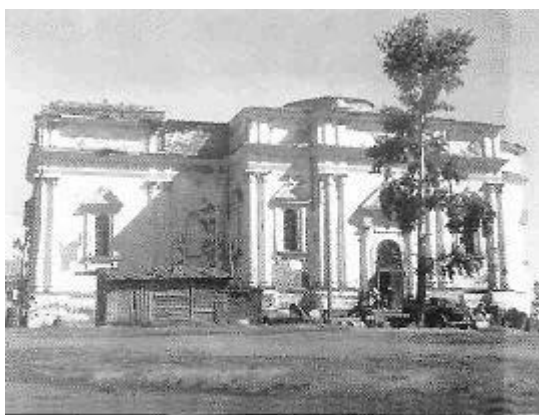
Питерный склад, 1943 г.

Жители занимаются работой в рудниках, мелкой добычей золота, перевозкой различных необходимых для рудников и заводов материалов и отличаются некоторой зажиточностью сравнительно с крестьянами других местностей. Эта зажиточность дает им возможность уделять часть своих достатков на дела благотворительности. Так, например, в 1877 г. во время русско-турецкой войны турьинские прихожане пожертвовали до 3000 руб. на больных и раненых воинов, за что и получили Высочайшую благодарность от Государыни Императрицы Марии Александровны.