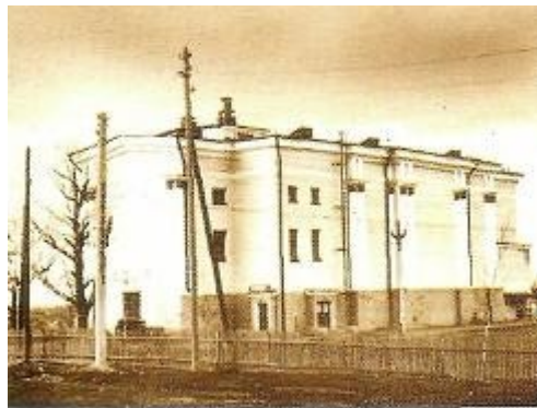
Кинотеатр «Россия», 1960-е гг.

В 1834 г. на средства прихожан был построен новый деревянный кладбищенский храм на правом берегу реки Турьи во имя архангела Михаила. Новый храм был приписан к приходской Максимовской церкви. В 1844 г., с благословения архиепископа Пермского Аркадия, на месте сгоревшей Максимовской церкви был заложен каменный храм во имя препод. Максима. На постройку храма Государем Императором Николаем I пожертвовано было 20000 руб., а остальной капитал, употребленный на постройку, собран был прихожанами. Постройка храма была закончена в 1851 г. Главным начальником Уральских горных заводов генералом Глинкою куплены были в Петербурге для храма иконостас в пять ярусов, иконы итальянской живописи и необходимая утварь.