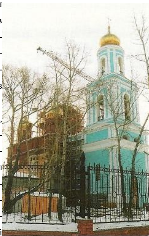
Максимовская церковь, 2002 г.

Из икон, находящихся в Максимовском храме, особенным почитанием среди местных жителей пользуется приобретенная в 1890 г. икона Знамения Пресвятыя Богородицы, работы монахинь Понетаевского монастыря Нижегородской епархии. Перед иконой этой почти ежедневно усердствующие богомольцы служат молебны с положенным акафистом. Храму принадлежит несколько лавок, с которых получается до двух тысяч в год арендной платы, и капитал, достигающий до 40000 руб.