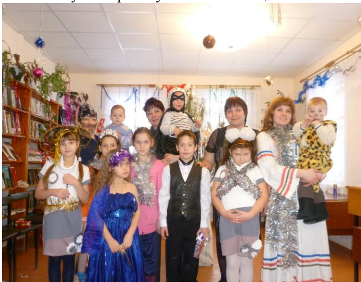
новогоднее мероприятие в библиотеке

потенциала своих читателей, организует деятельность по продвижению чтения и книги в обществе, привлекает к этому движению местную творческую интеллигенцию.