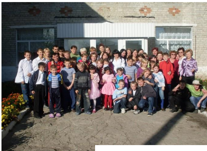
дети и коллектив Детского дома

где их учат вышивать, вязать, рисовать и т. д, занимаются художественной самодеятельностью, принимают участие в районных, областных конкурсах и олимпиадах.