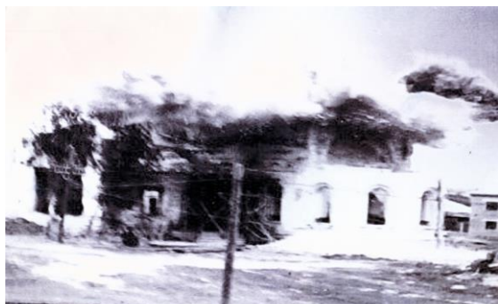
ВЗРЫВ ЦЕРКВИ 50-

Только в 2004- м году православная община в Заводоуспенском была