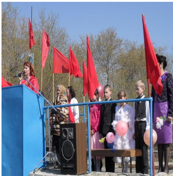
митинг, посвященный Дню Победы