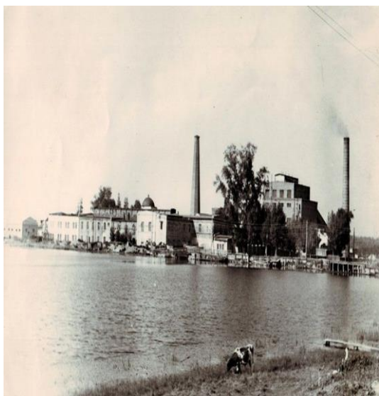
писчебумажная фабрика на берегу пруда XIX век