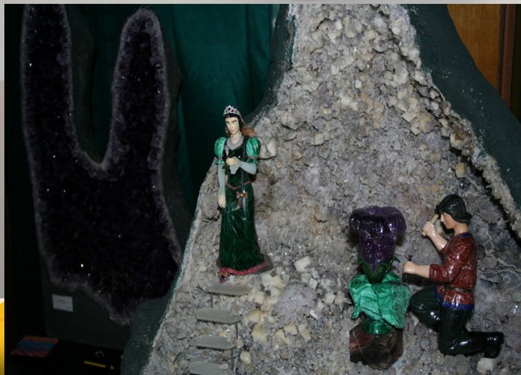
Работы мастера – камнереза.