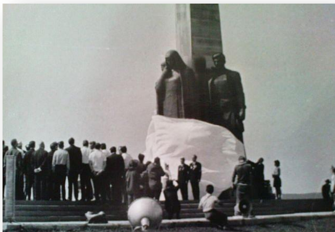
Открытие монумента. Спадает полотнище.

«Казалось, весь Реж устремился утром седьмого июля к никелевому заводу - туда, где на околзаводской площади должен был открыться Монумент боевой и трудовой славы режевлян в годы Великой Отечественной войны. Белое покрывало скрывало еще фигуры монумента, но стела его высоко взметнулась в синее июльское небо, чистое, солнечное!