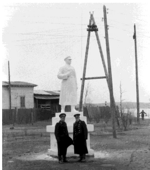
Памятник К. Ворошилову

Несколько лет на месте будущего Монумента в центре сквера находился специальный камень.