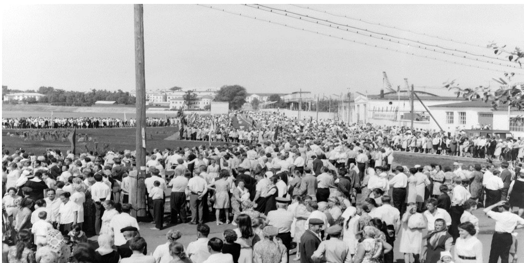
Момент открытия Монумента боевой и трудовой славы 7 июля 1973 года