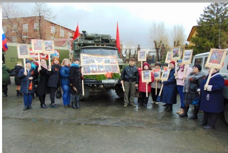
День Победы. Центральная библиотека. Бессмертный книжный полк.