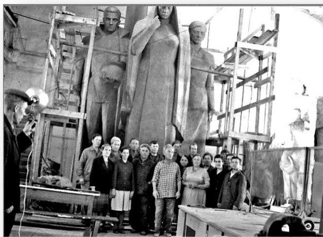
После сборки скульптур в энергоцехе РНЗ. В центре один из авторов памятника.