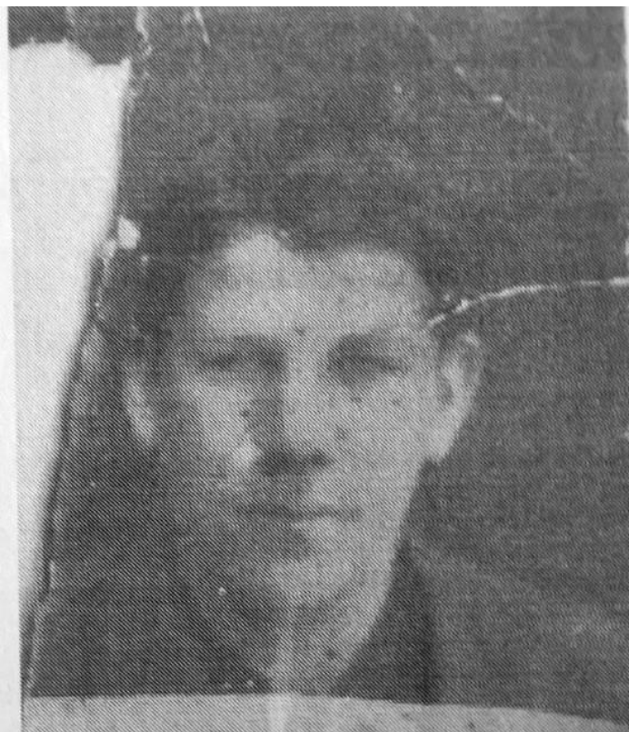
Фото с пропуска на завод во время войны

построено как сжатая пружина, расхлябанность даже одного участника процесса могла обернуться катастрофой в полном смысле этого слова (взрывы, утечка металла под печь и т. д.). Почти вся изнурительная работа в цехе легла на плечи несовершеннолетних детей. Питание было хорошее. Рабочие получали продукты по высшей категории и питались в столовых. Получали по 1 кг. хлеба в день, соответственно, мяса, масла, сахара и крупы рабочие основных цехов тоже получали по повышенной норме. Рабочие неосновных профессий получали 400 - 600 граммов хлеба в день. Вскоре