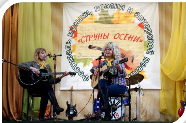
г. Тавда «Струны осени»

Артемовские поэты оставили о себе яркое впечатление, выступив на фестивалях: в г. Каменск-Уральский «Зелёная карета»,