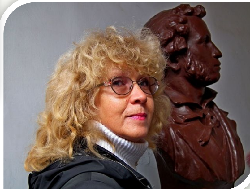
и фестиваля на Пушкинских горах «Бакенбардия»