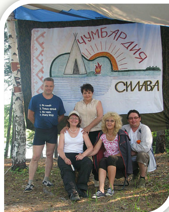
в г. Урай «Чумбардия»