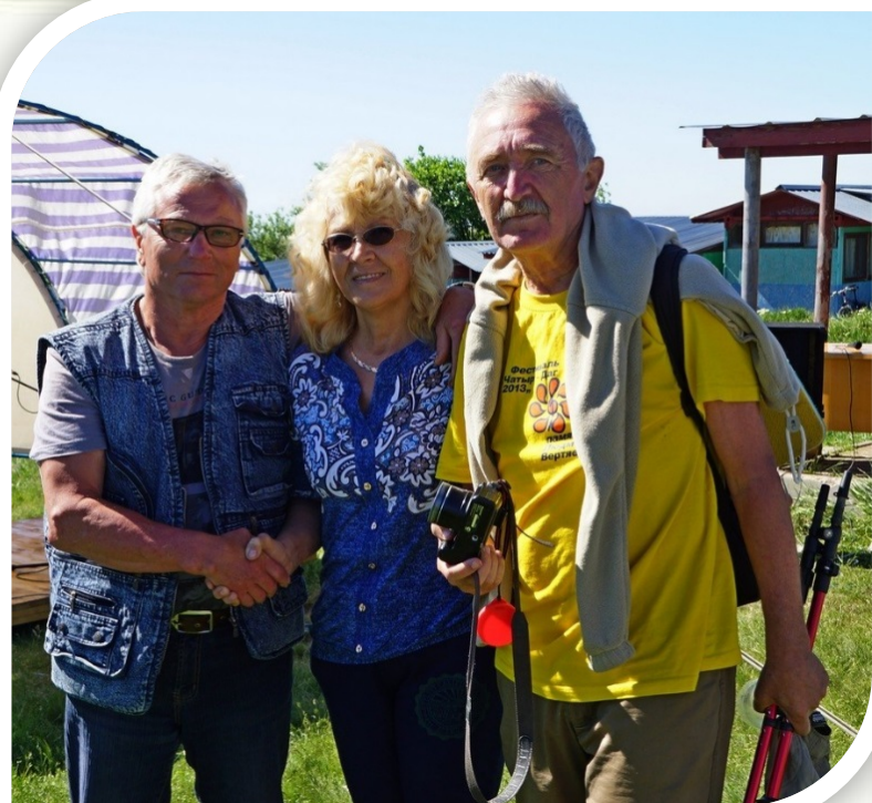
Стали лауреатами Чатырдагского фестиваля