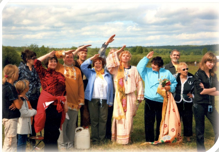
в с. Мугай Алапаевского района

ЛИТО «Здравствуй» знают не только в родном Артёмовском, но и далеко за его пределами. Коллектив помогал организовывать фестивали: