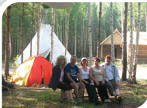
п. Междуреченский «Таёжный романс»