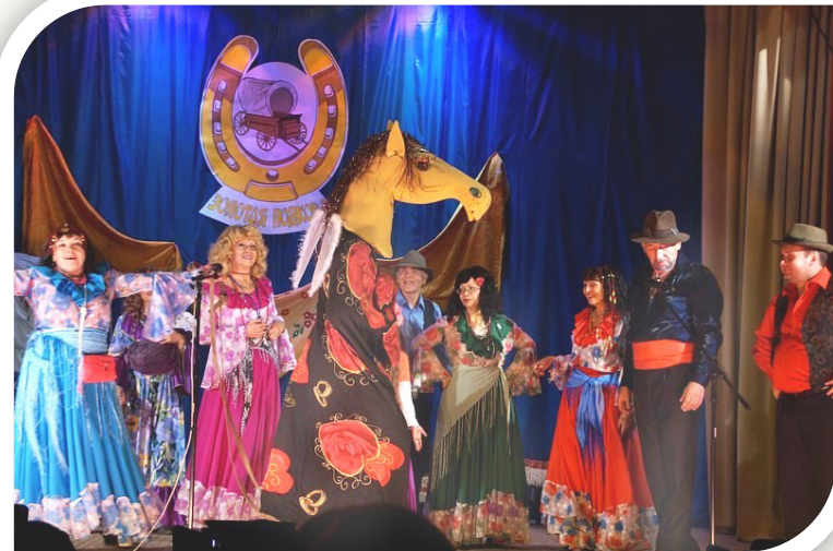
«Золотая подкова» (2012)