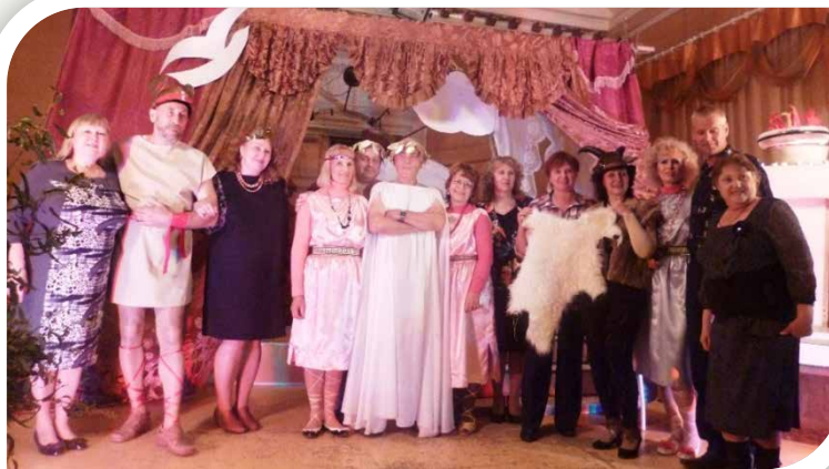
«В поисках золотого руна» (2013)