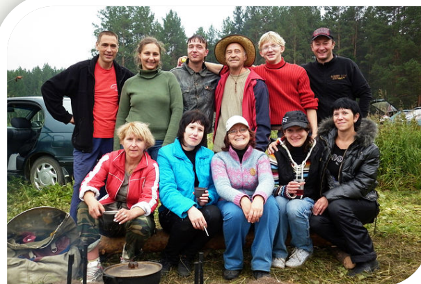
г. Нижний Тагил «Зелёная лампа»