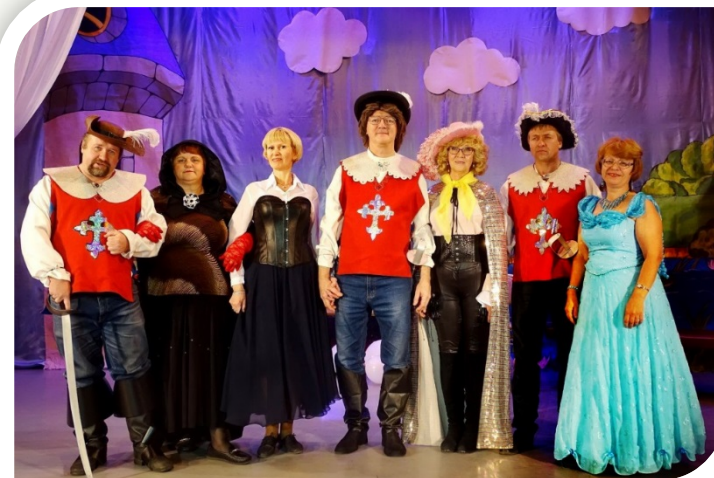
«Пуркуа па» (2018)