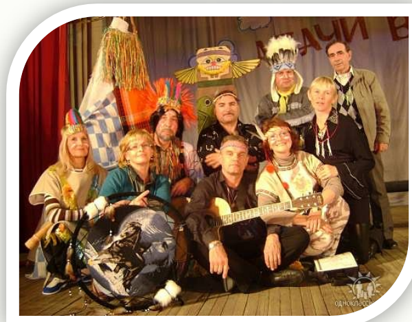
«Апачи в городе» (2010)