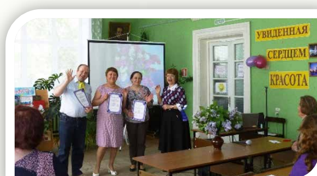
«Сплетаются стихи в сиреневом тумане» (2016)