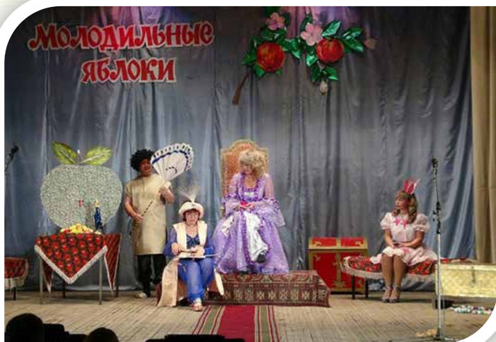
«Молодильные яблоки» (2011)