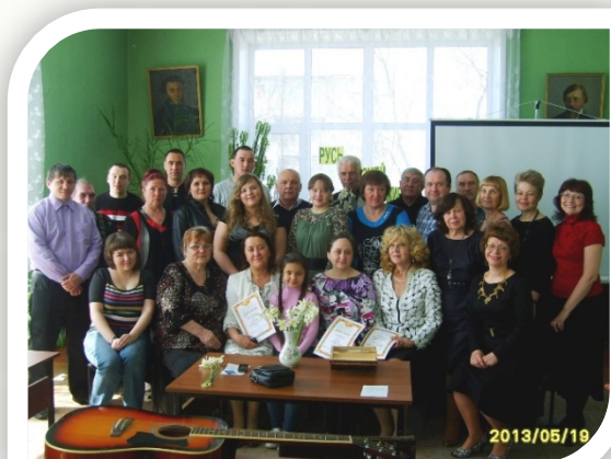
«Русь поэзией жива» (2013)

А также активно участвовали в районных фестивалях поэзии и бардовской песни проводимых в Центральной районной библиотеке с 2011 года: