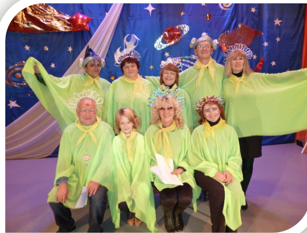
«Таки, да!» (2015)