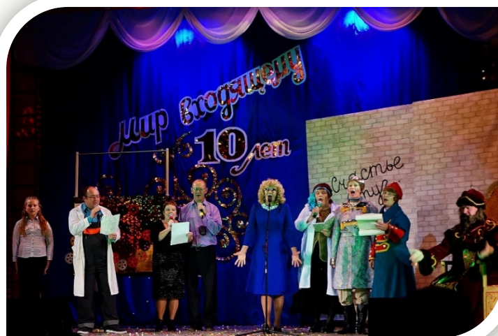
«Счастье вдруг...» (2016)