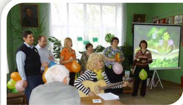
«Звонкая удал' стиха» (2015)