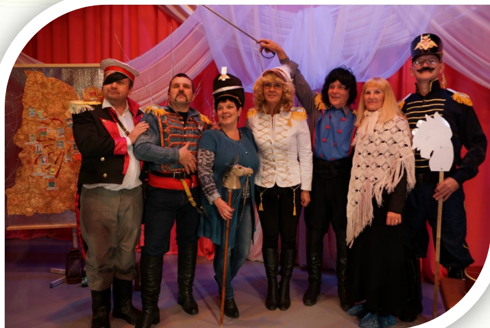
«Сами с усами» (2014)