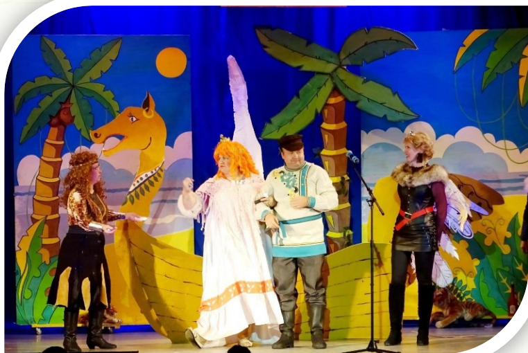
«Остров, где всё не так» (2017)