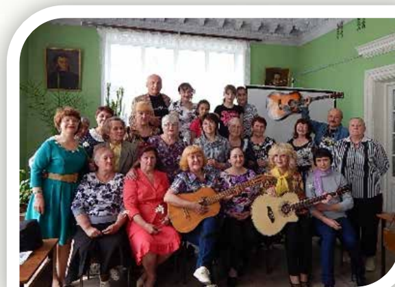
«Олимпиада солнечных людей» (2014)