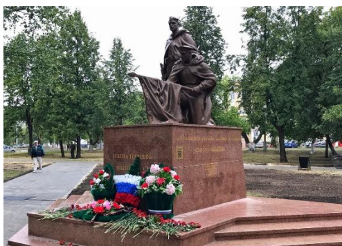
Памятник героям-победителям в Великой Отечественной войне, 24 июня 2020