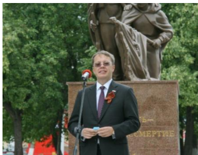
Депутат Государственной Думы РФ Лев Ковпак, 24 июня 2020

Это был цветущий майский день. Собралось много каменцев и гостей города. В торжественной церемонии приняли участие глава города Алексей