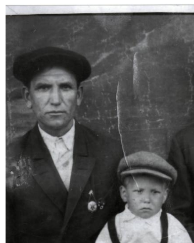
Владимир с отцом 6 лет, октябрь 1938 г.

«А еще отец был хорошим охотником: мог настрелять за зарю до тридцати уток. Привезет бабушке — та причитает: «Куда ж их девать?»»