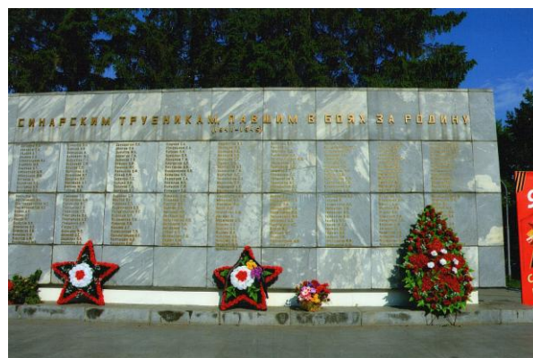
Памятник синарским трубникам, 2019