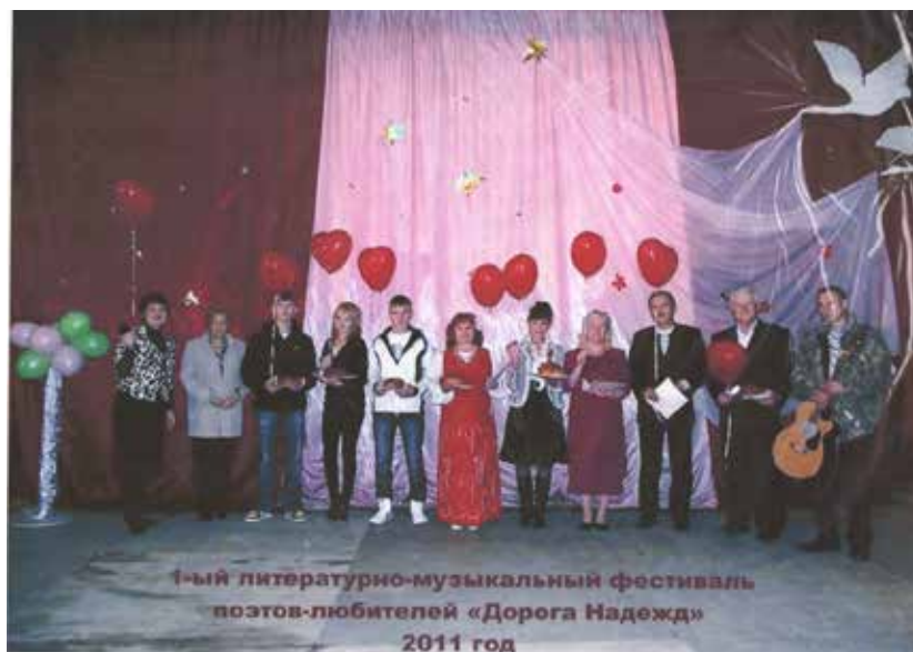
Первый фестиваль 2011 г.

В 2011 году состоялся первый литературно-музыкальный фестиваль поэтов-любителей «Дорога Надежд». Участниками этого фестиваля были поэты с. Петрокаменского.