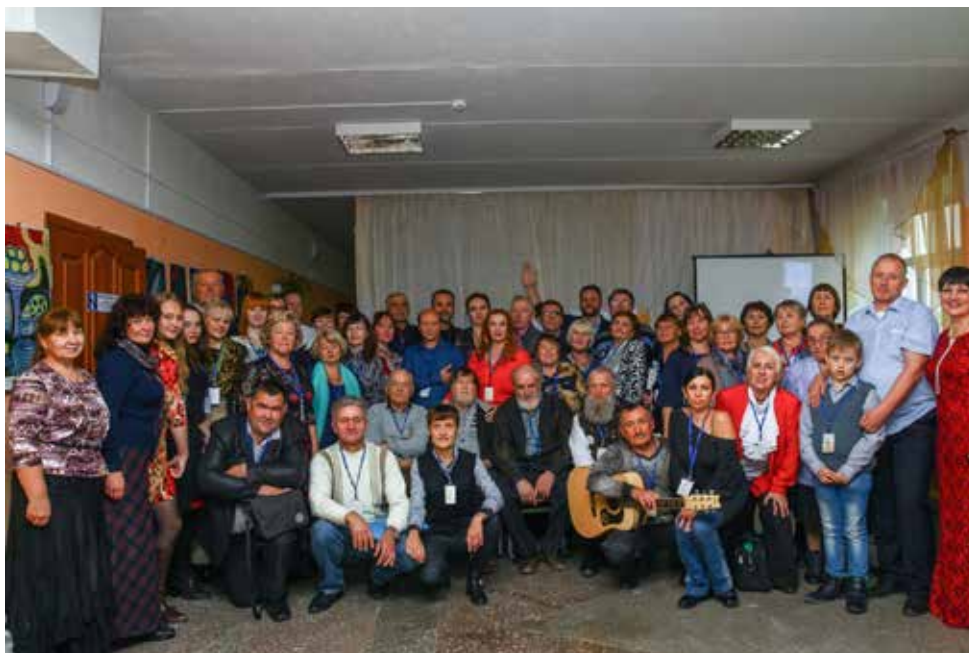
VII фестиваль «Дорога надежд»

В 2016 году было присвоено звание районного литературно-музыкального фестиваля. В конкурсе уже участвовали поэты со всего Пригородного района. На седьмом фестивале в 2017 году участвовали поэты из двадцати двух территорий Свердловской области.