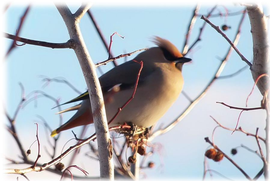
Вот он красавчик. Свиристель – обжора!