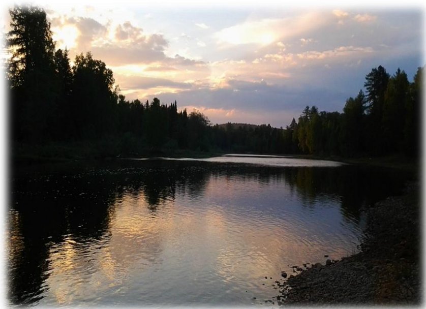
Река Сосьва, вечер.

недельный «всплеск» непогоды. Через день вода чуть спала и я по срубленному дереву перешёл реку, а больше никак... Водой идти – утатило бы, «как с добрым утром», и нашли бы может тело моё где-нибудь в завале, когда-нибудь. Горные реки в таком состоянии беспощадны.