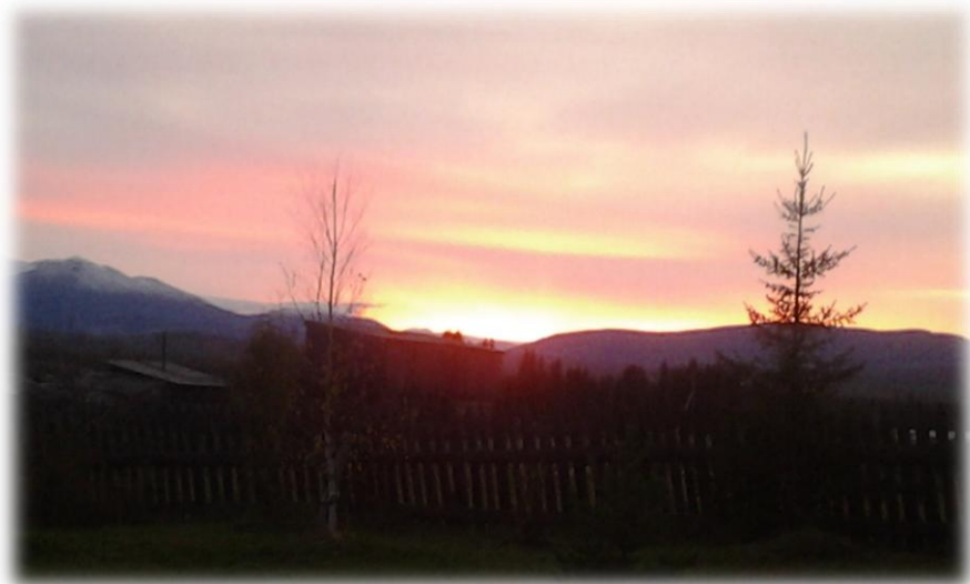
Природа – пейзажист