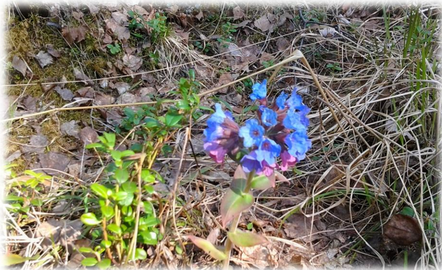
Первоцветы, радуют глаз, когда ещё в лесу совсем голо. Скромная медуница.