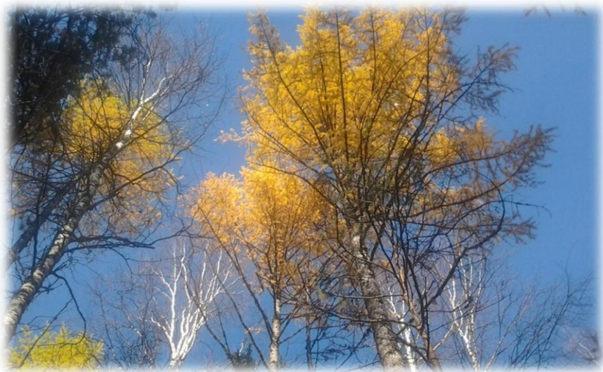
Неба синева и лес в уборе осени