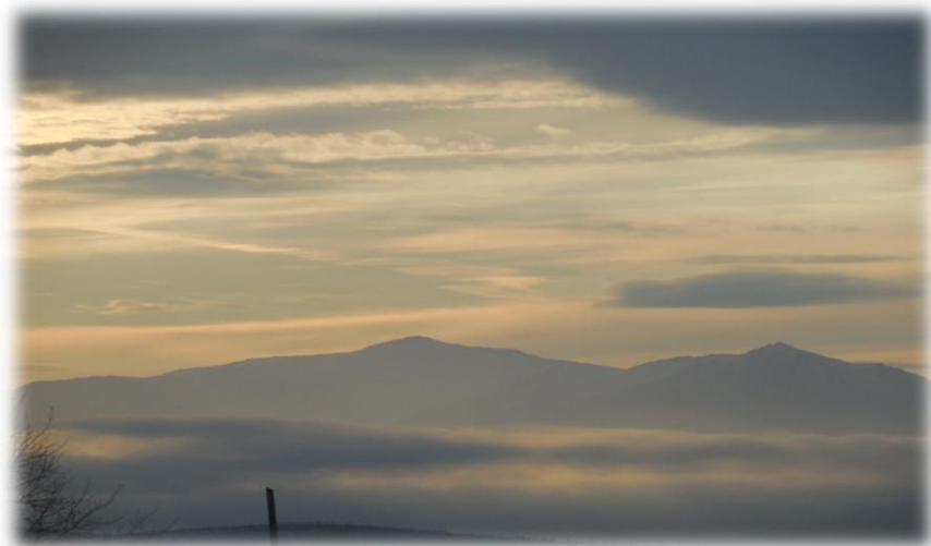
«Двухэтажный» туман – и такое бывает на Денежкине.

Ну ладно, будем дальше жить и думать о хорошем.