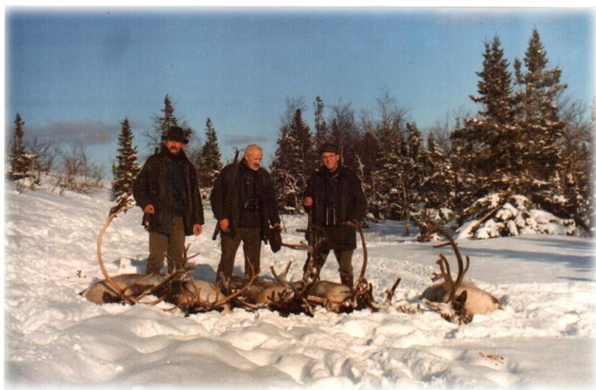
«Драй хантерс», очастливленные своими «трофеями»

удосужились полистать литературку по данному объекту охоты перед выездом, в конечном итоге сыграли, как это ни странно, положительную роль в проведении данного мероприятия. Одна сторона получила долгожданные, остро необходимые денежки, вторая – приобрела трофеи, массу положительных впечатлений – была довольна и счастлива.