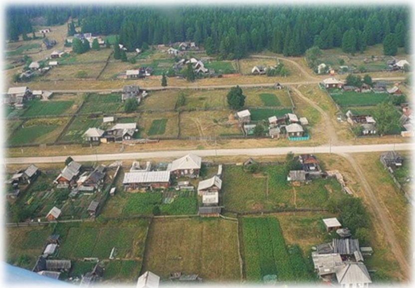
«Деревня» наша с высоты птичьего полёта. За огородами лес.