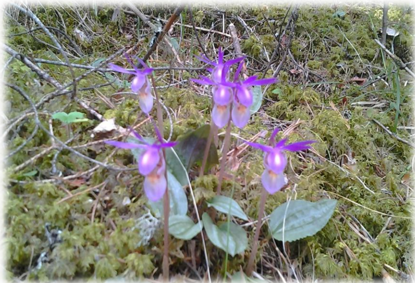
Погода погодой, а природа своё берёт! Уральская орхидея – калипсо.