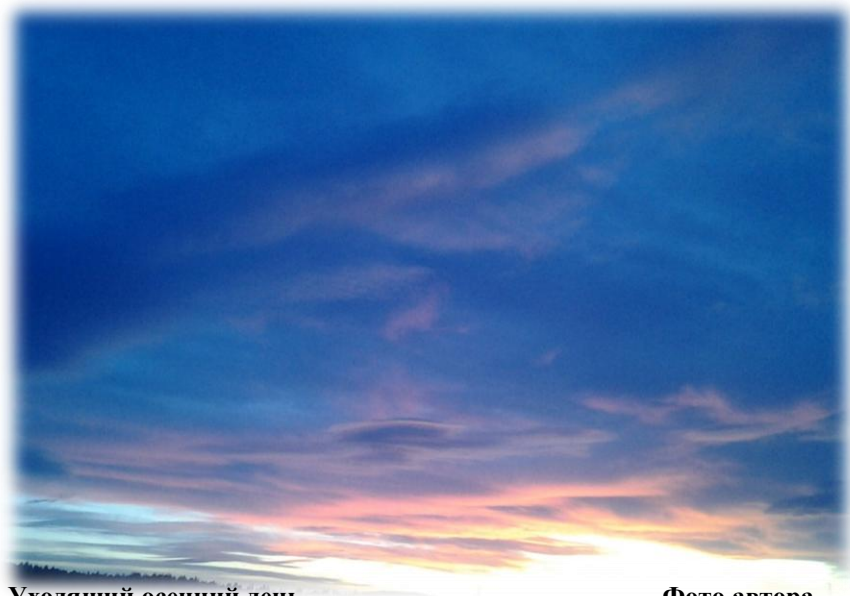
Уходящий осенний день.

Конец года среди зимы?... как-то не совсем логично. Подводить итоги помогает и профессиональный «взгляд» в окружающий деревню лес, где отслеживается всё календарное многообразие изменений в природной среде и становится как-то спокойнее от того, что всё как шло, так и идёт своим чередом, не нарушаемое никакими человеческими и какими-либо другими ненужными «катаклизмами».