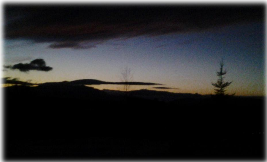
Где-то рядом ночь