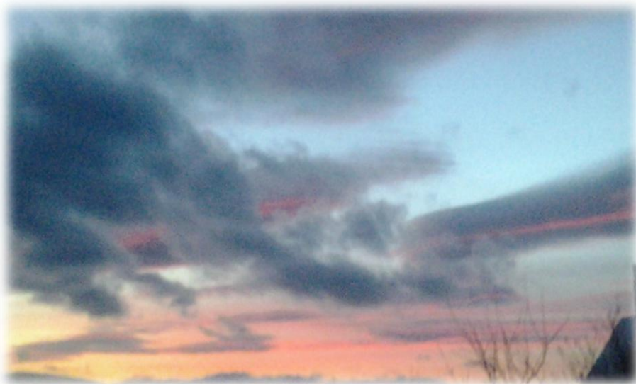
Природа – импрессионист