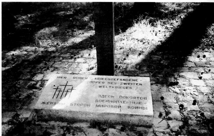
г. Реж, Свердловской области. Место условного захоронения. Здесь покоятся военнопленные — жертвы второй мировой войны.