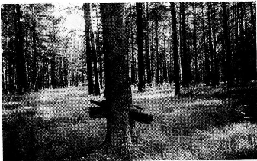
г. Реж, Свердловской области. Лес за р. Ржавкой, где «Знак» захоронений немецких военнопленных из Кёнигсберга в 1944-м году. (Крест поставлен самой природой, без вмешательства человека)