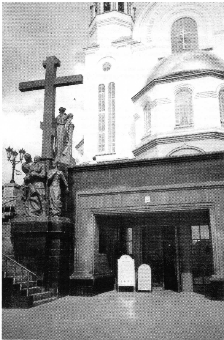
Возле входа в нижний придел Храма-на-Крови, где Мемориальная расстрельная комната Императора Николая II и его семьи. г. Екатеринбург