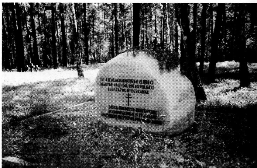
г. Реж, Свердловской области. Место условного захоронения. Здесь покоятся венгерские военнопленные и граждане погибшие во второй мировой войне.