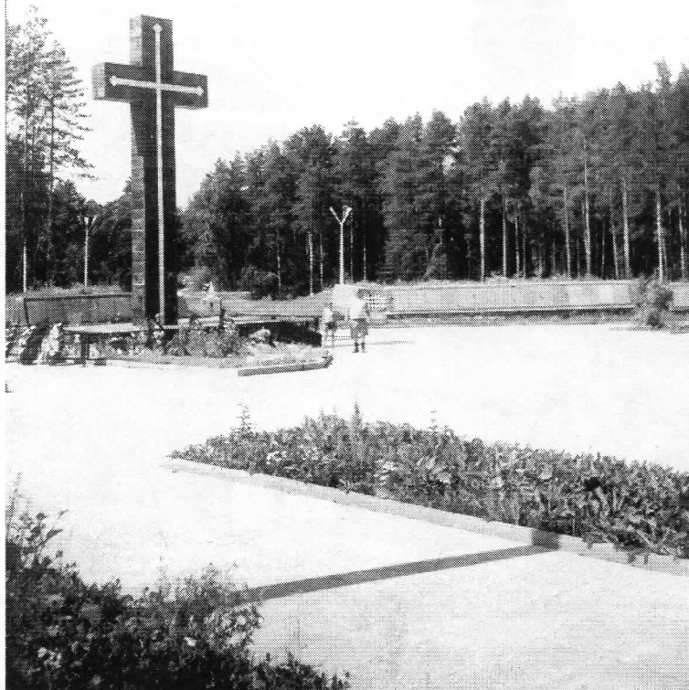
«Крест жертвам политических репрессий» 12-й км автодороги Свердловск — Первоуральск Поставлен крест в 1997 году.