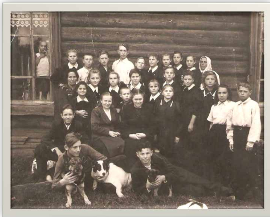
Коллектив детского дома и воспитанники старшей группы. (1953г.)