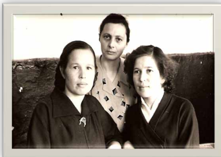
Коллектив детского дома март (1951 г.)